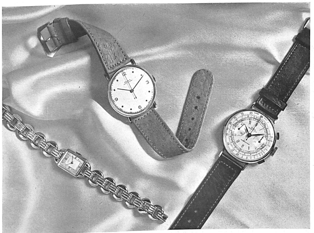
Manufacture des Montres Doxa, Le Locle.