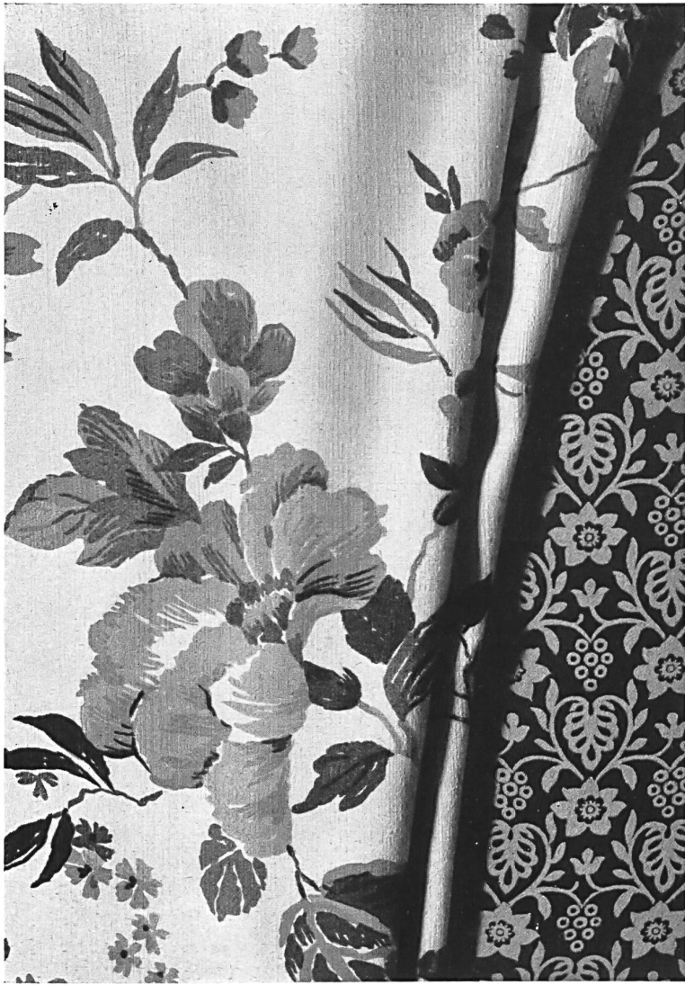
From the collection presented by Messrs : Del muestrario de la casa : Da coleção da Casa : H. W. Giger A. G., Flawil.