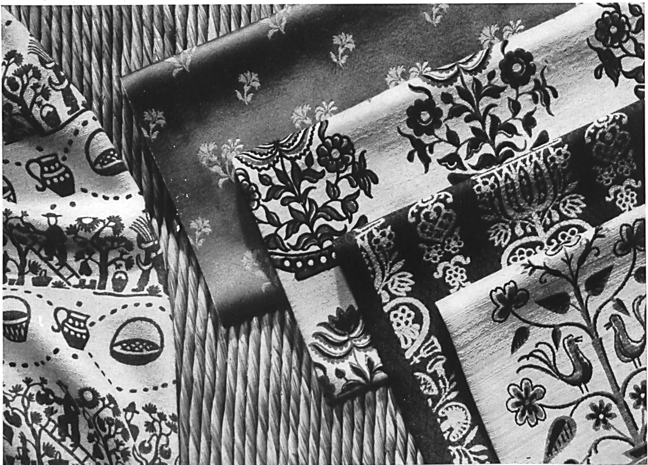
Ltd. A. & R. Moos, Weisslingen Staple fibre and rayon upholstery fabric. Tejido para el mueblaje, de fibraná y rayón. Estofos para decoração em lã e sêda artificiais.