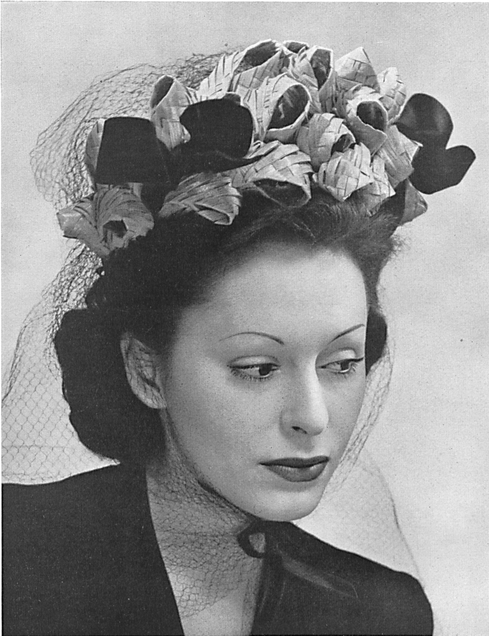
Otto Steinmann & Cie S. A., Wohlen. « OSCOLINA » braid No. 4680. Modèle Muller, Zurich.