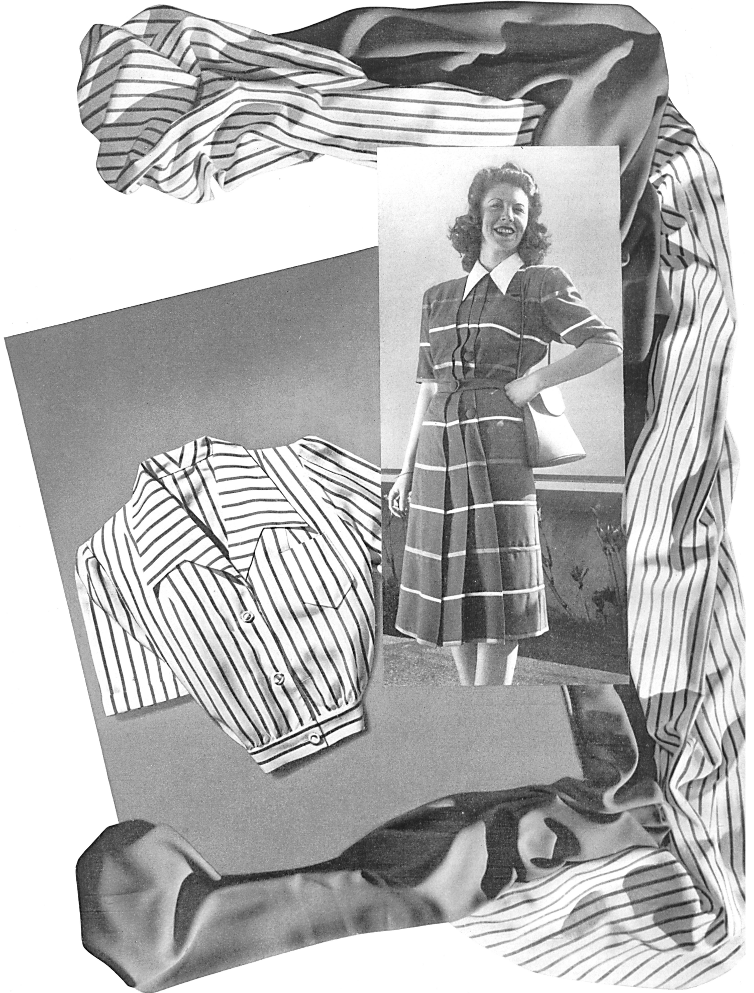
Christian Fischbacher Co., St-Gall Eolienne and Diagonal, staple-fibre Atelier Honegger-Lavater