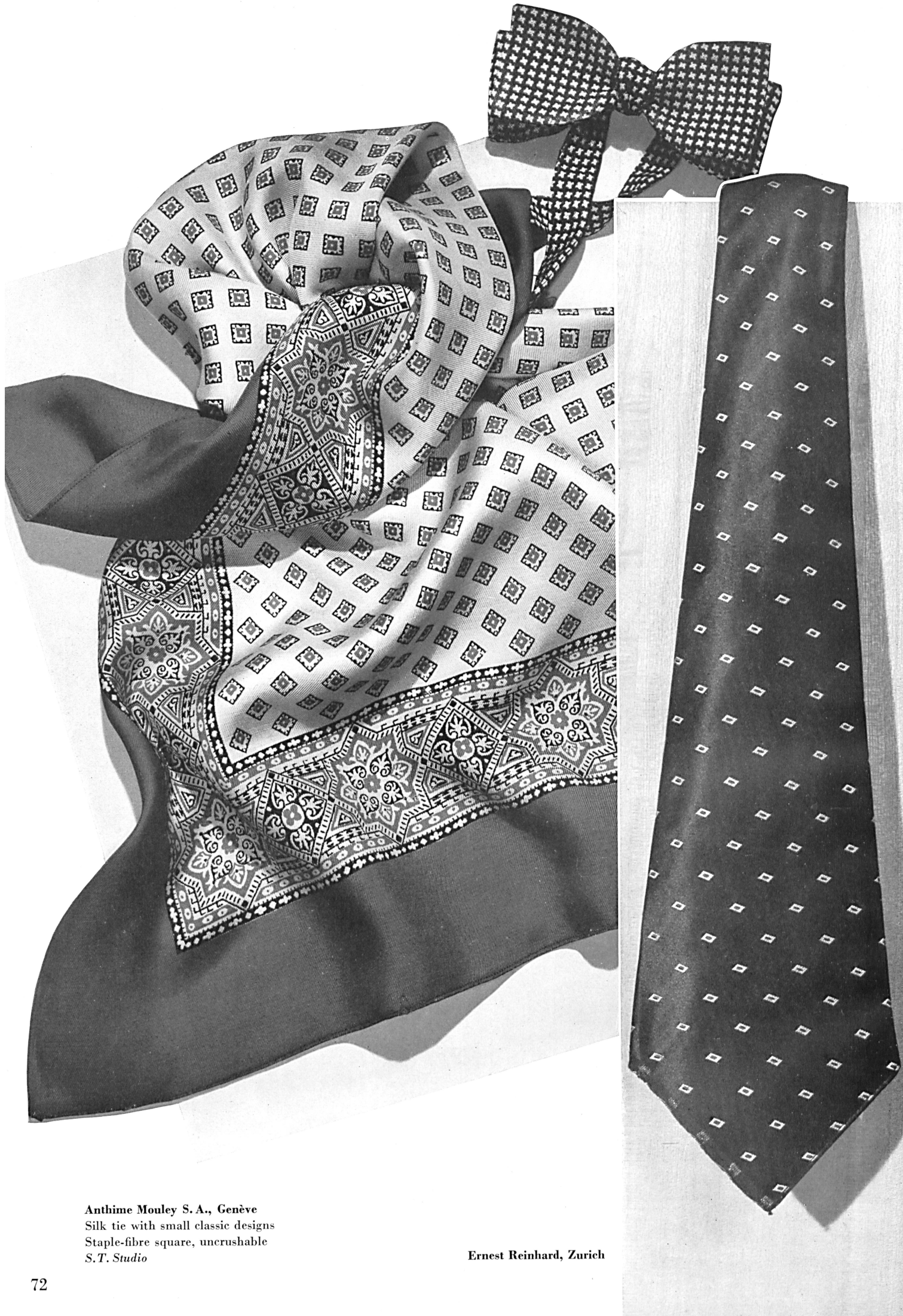
Anthime Mouley S. A., Genève Silk tie with small classic designs Staple-fibre square, uncrushable S.T. Studio