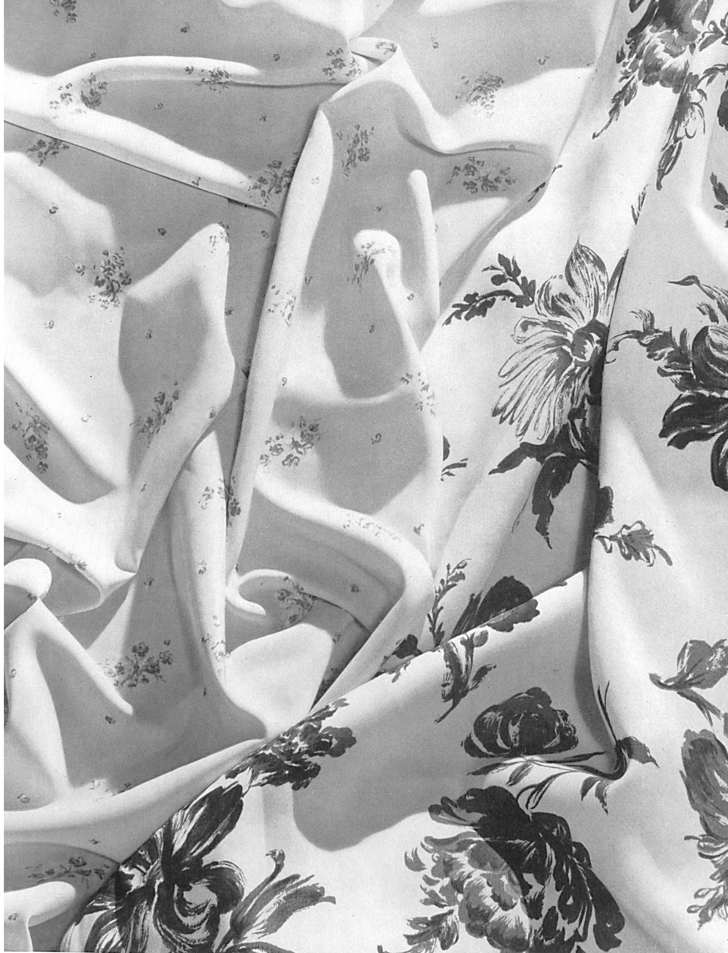
Hausamann & Cie, Winterthur A selection from the new dress and lingerie fabrics