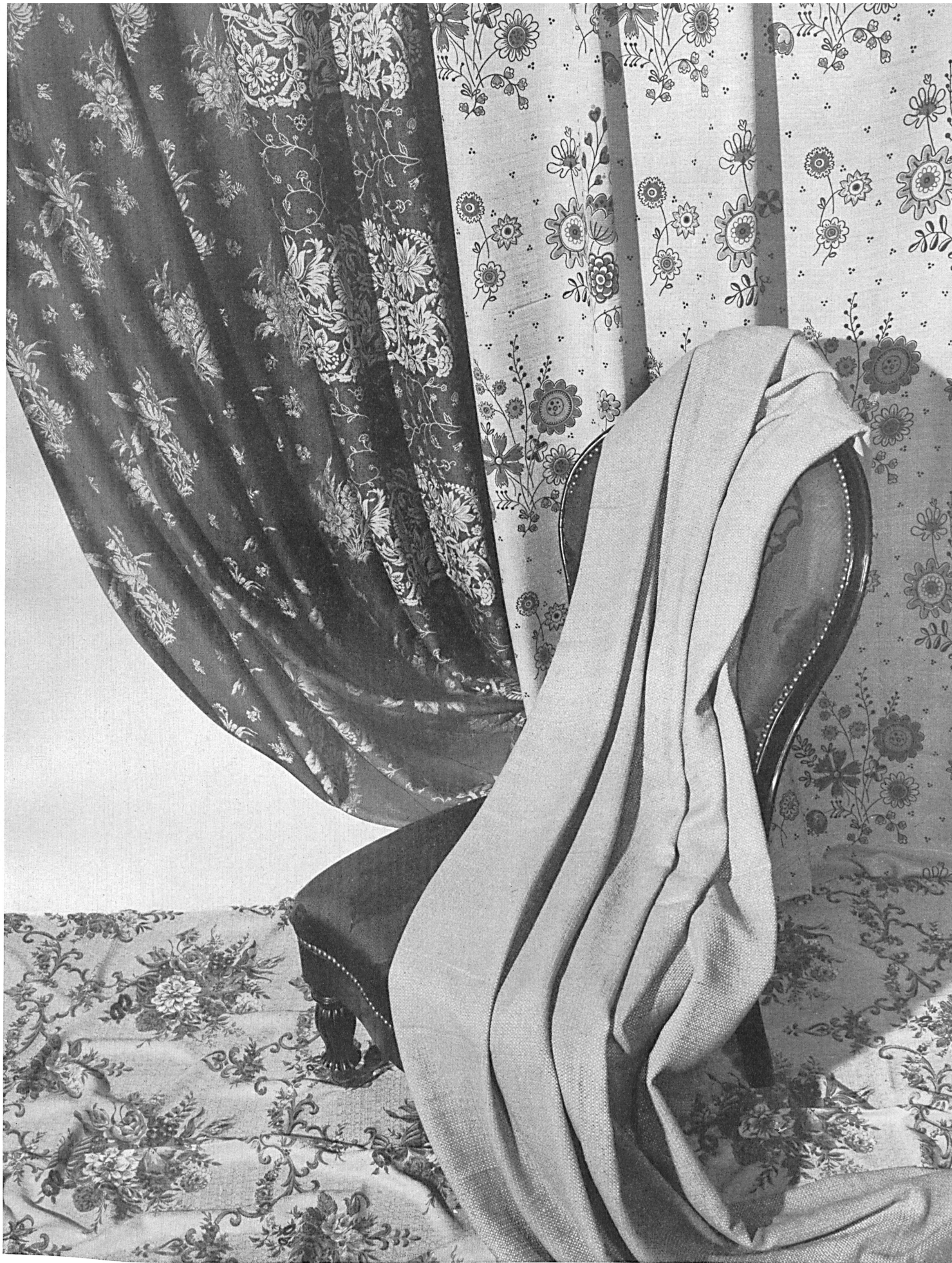
Société Anonyme A. & R. Moos, Weiblingen /Zch. Soft furnishing fabrics: printed, Jacquard, colour woven, plain. Upholstery fabrics. Chintz S.T. Studio