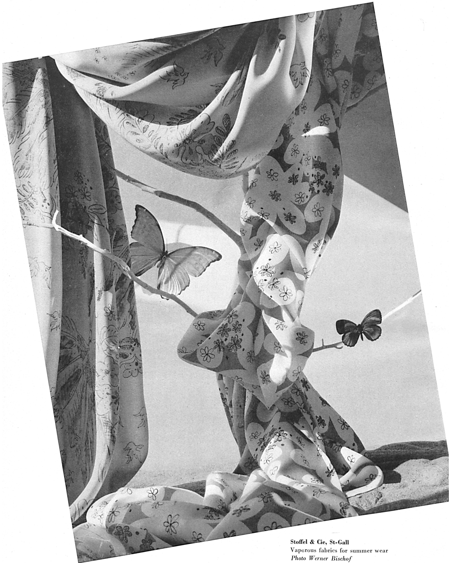
Stoffel & Cie, St-Gall Vaporous fabrics for summer wear