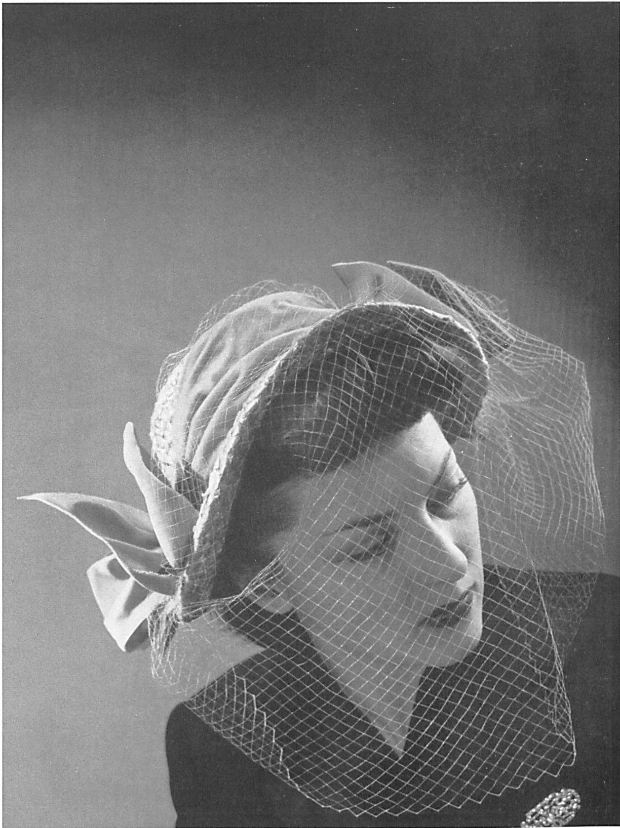
Stäger & Cie S. A., Villmergen Model in strawbraid Modèle Baehler, Berne