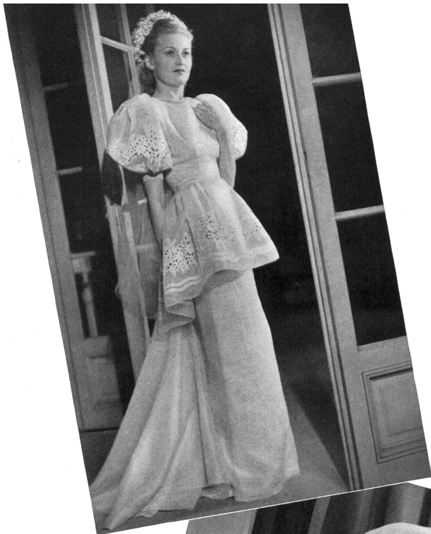
SCHIAPARELLI A. Naef & Cie, Flawil THIÉBAUT-ADAM, PARIS