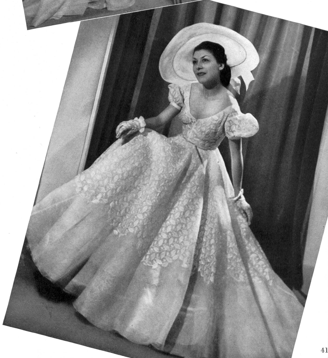
NINA RICCI Union S.A., St-Gall THIÉBAUT-ADAM, PARIS