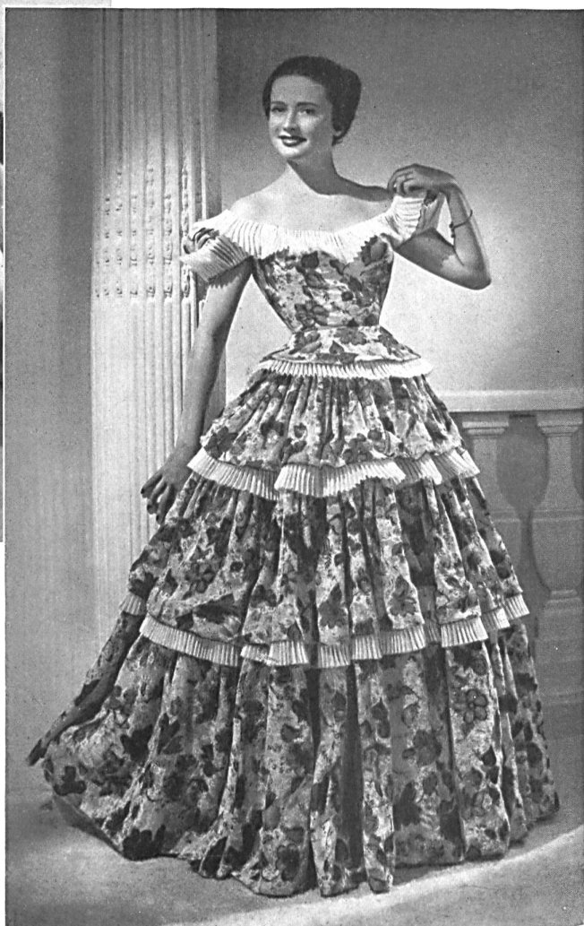
CARVEN Stoffel & Cie, St-Gall. ROUBAUDI, PARIS.