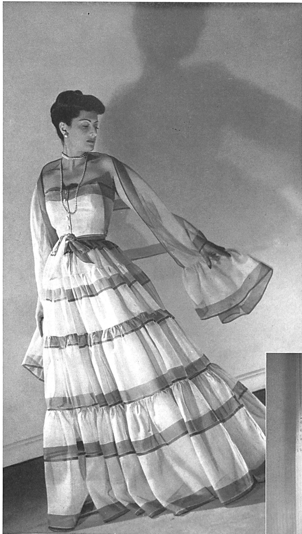
BALENCIAGA Stoffel & Cie, St-Gall. INAMO, ZURICH.