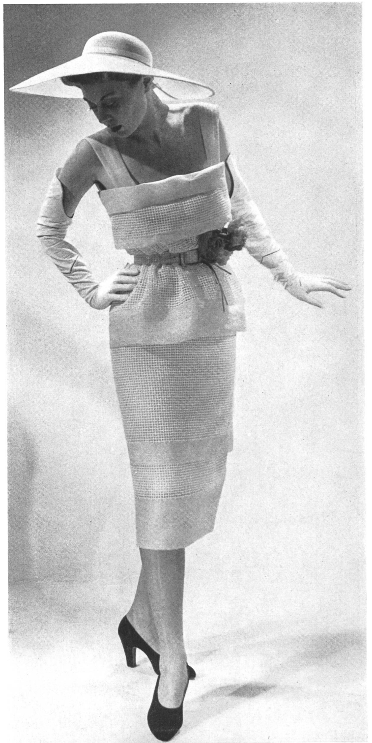
CHRISTIAN DIOR Forster Willi & Cie, St-Gall INAMO, ZURICH