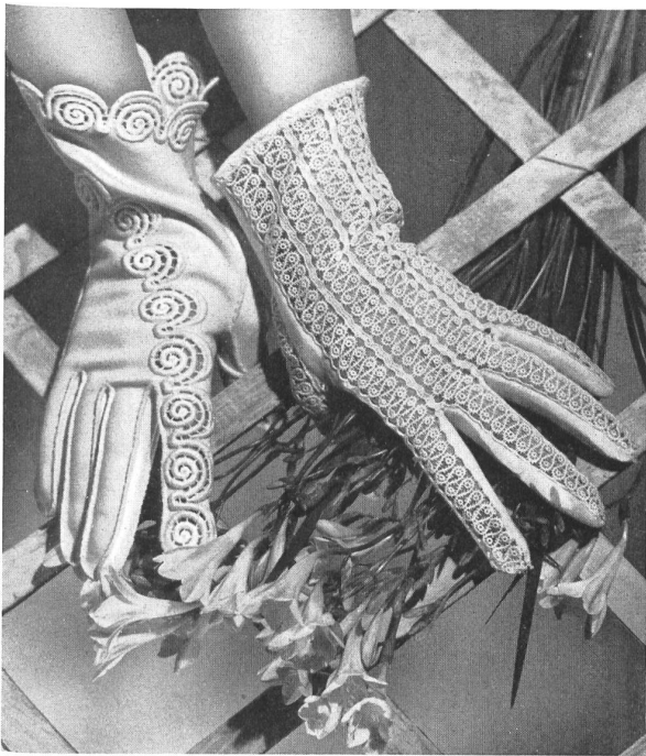
ILDA Willy Zurcher, St-Gall Aug. Giger & Cie, St-Gall PIERRE BRIVET FILS, PARIS