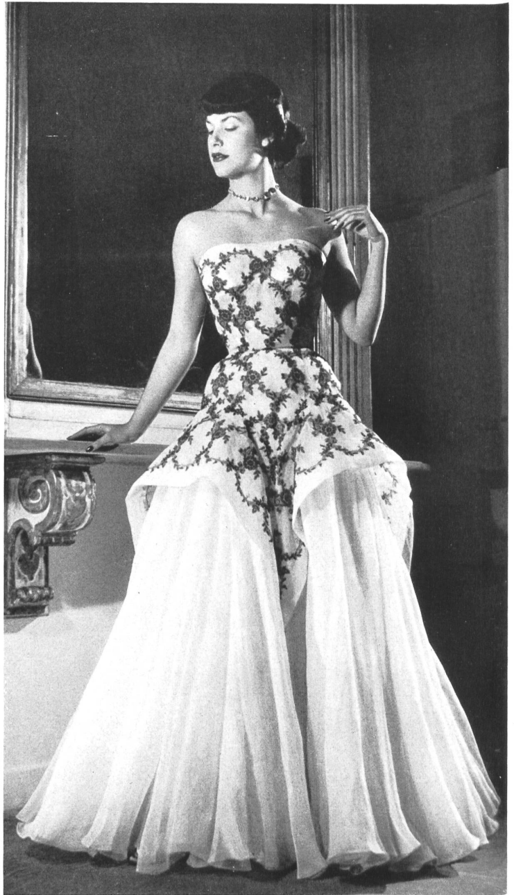
CARVEN Union S. A., St-Gall PIERRE BRIVET FILS, PARIS