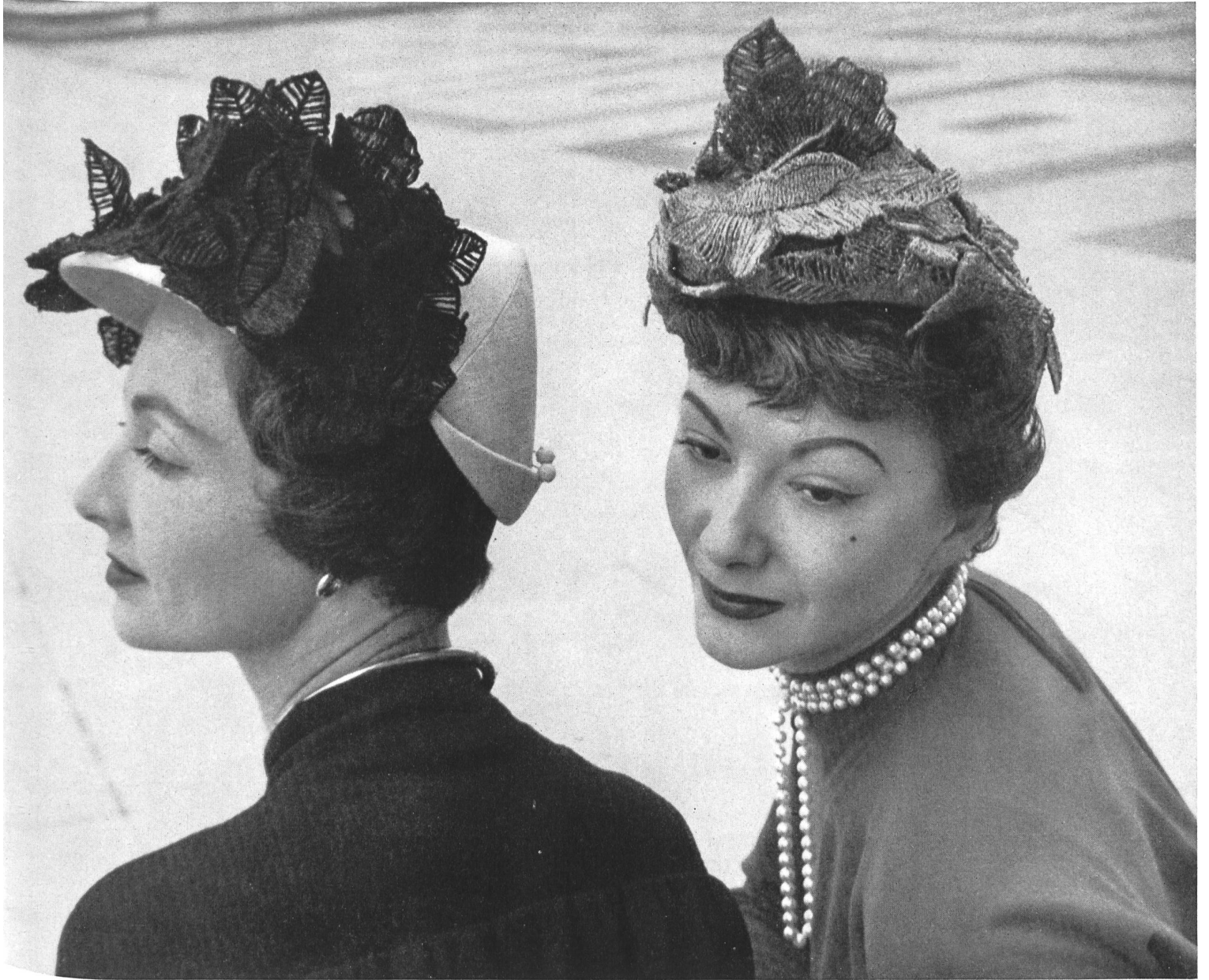
LEGROUX SEURS Forster Willi & Cie, St-Gall INAMO, ZURICH

← NINA RICCI J. G. Nef & Cie, Herisau M. GUITRY, PARIS