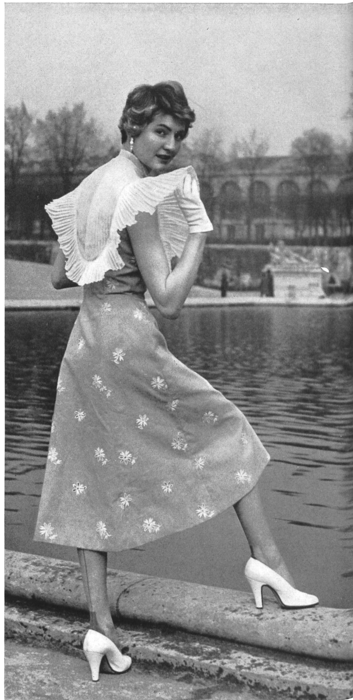
JACQUES FATH A. Naef & Cie, Flawil PIERRE BRIVET FILS, PARIS