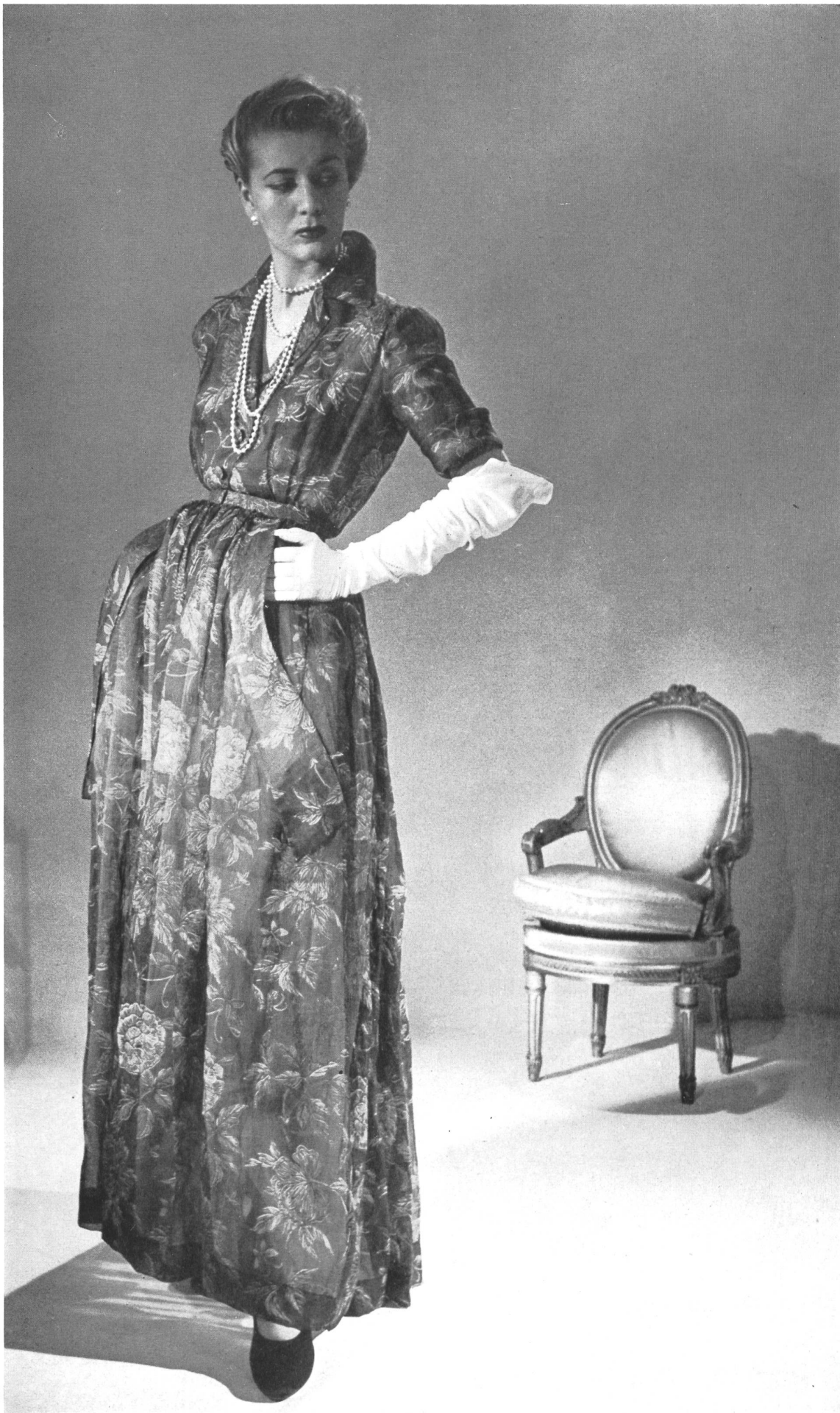
CHRISTIAN DIOR Stoffel & Cie, St-Gall INAMO, ZURICH