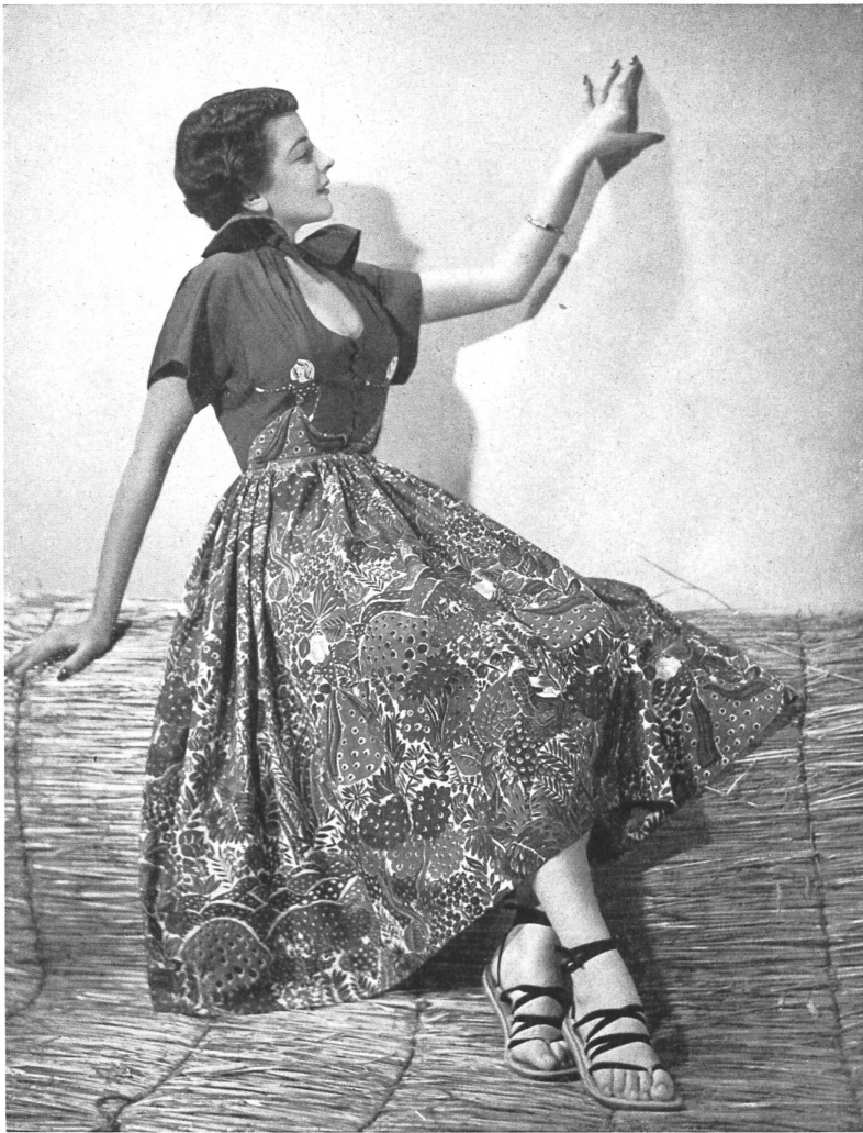
RAPHAEL Rudolf Brauchbar & Cie, Zurich