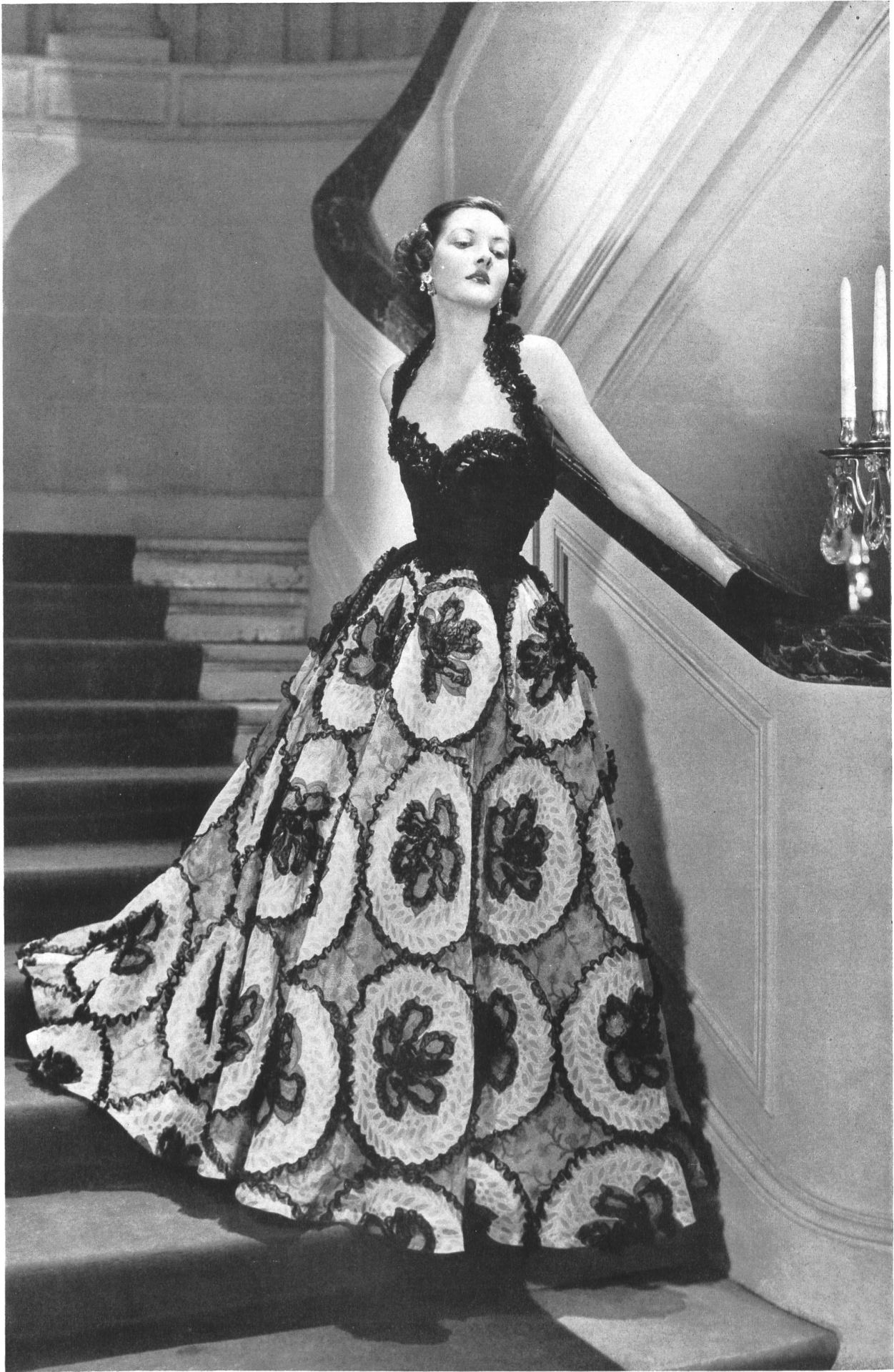
ROBERT PIGUET Reichenbach & Co., St-Gall