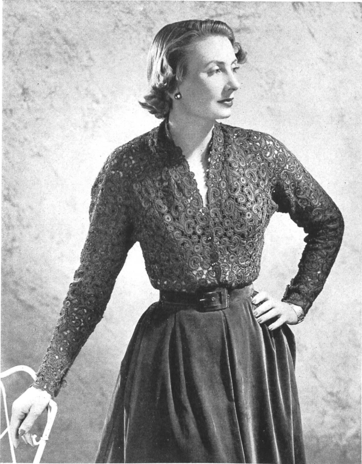
CALIXTE Walter Schrank & Cie, St-Gall THIÉBAUT-ADAM, PARIS