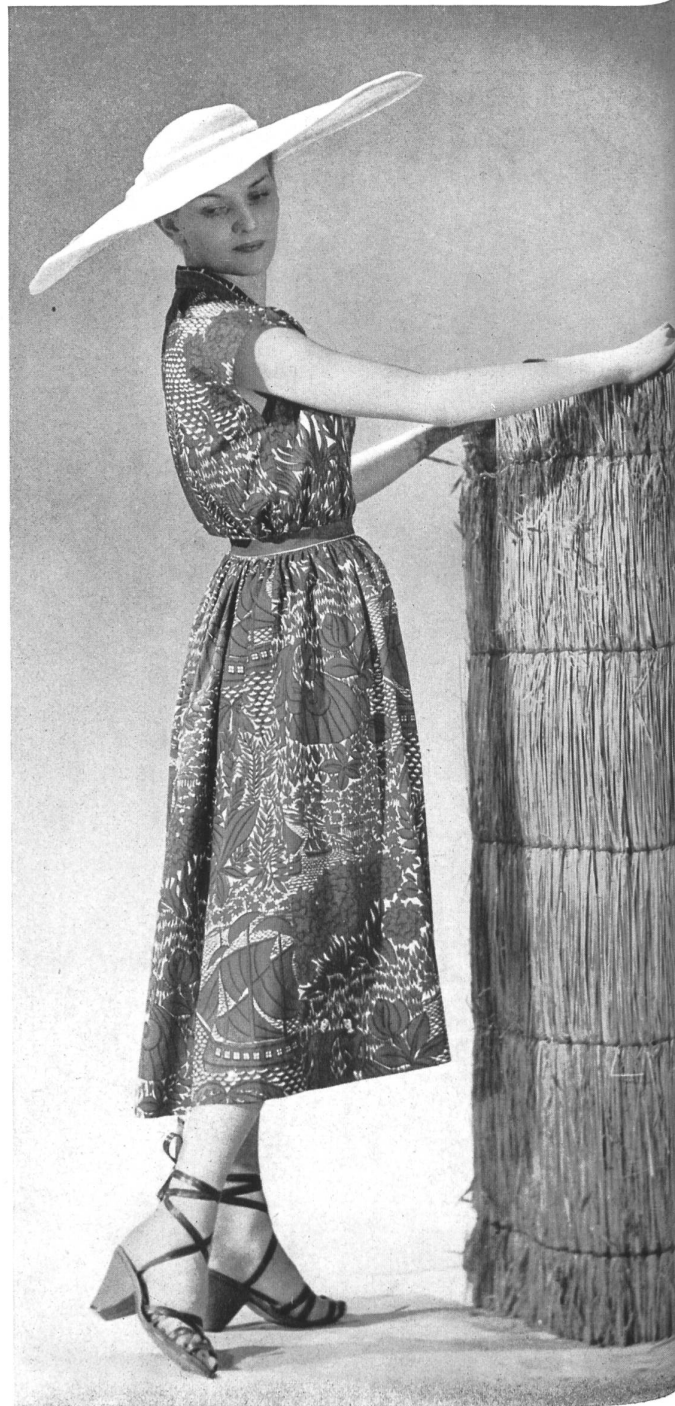
MOLYNEUX Rudolf Brauchbar & Cie, Zurich