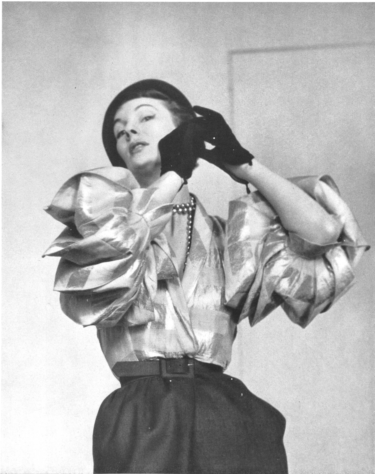
SCHIAPARELLI Heer & Co. S. A., Thalwil INAMO, ZURICH