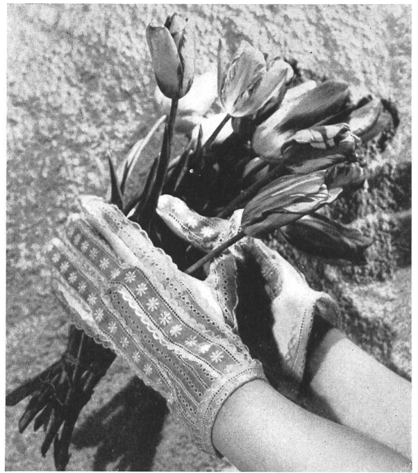
ILDA Union S. A., St-Gall PIERRE BRIVET FILS, PARIS