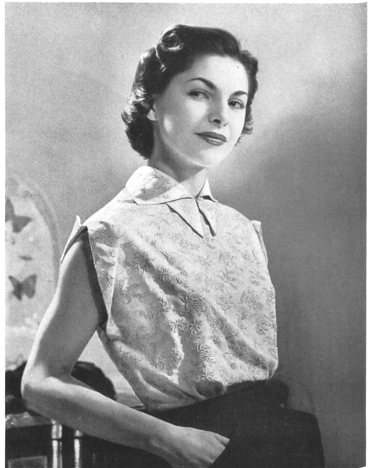
JEAN DESSÈS Walter Stark, St-Gall MONTEX, PARIS