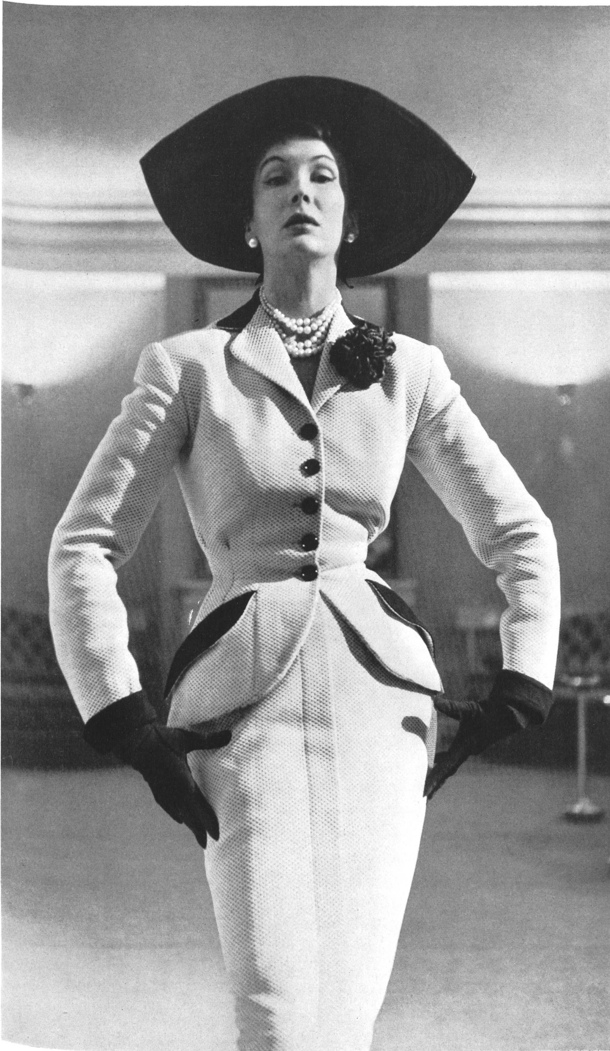
MARCEL ROCHAS Stoffel & Cie, St-Gall INAMO, ZURICH