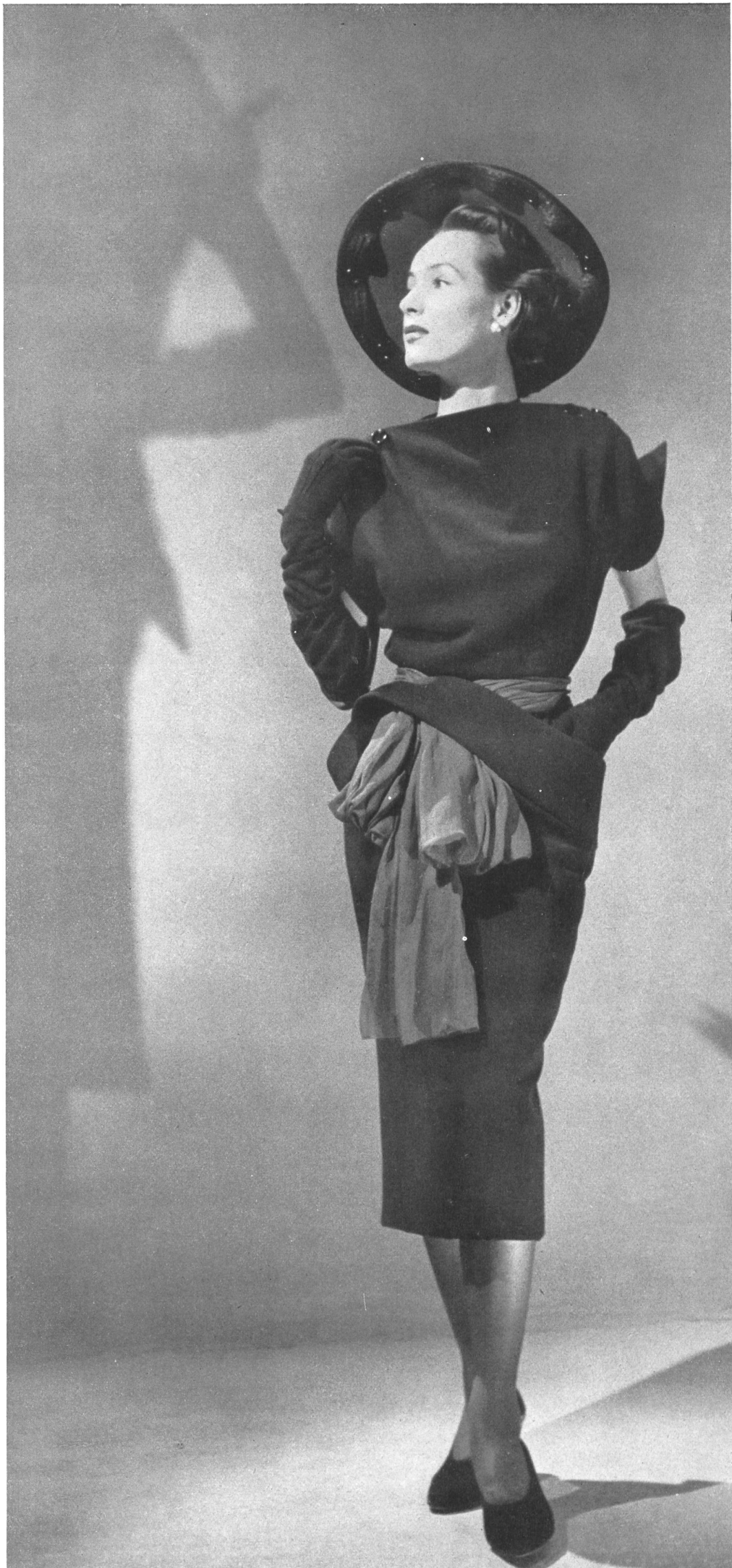
CHRISTIAN DIOR Emar S. A., Zurich INAMO, ZURICH