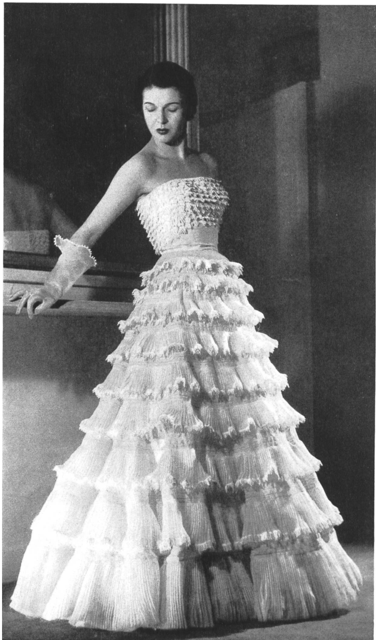
CARVEN Union S. A., St-Gall PIERRE BRIVET FILS, PARIS