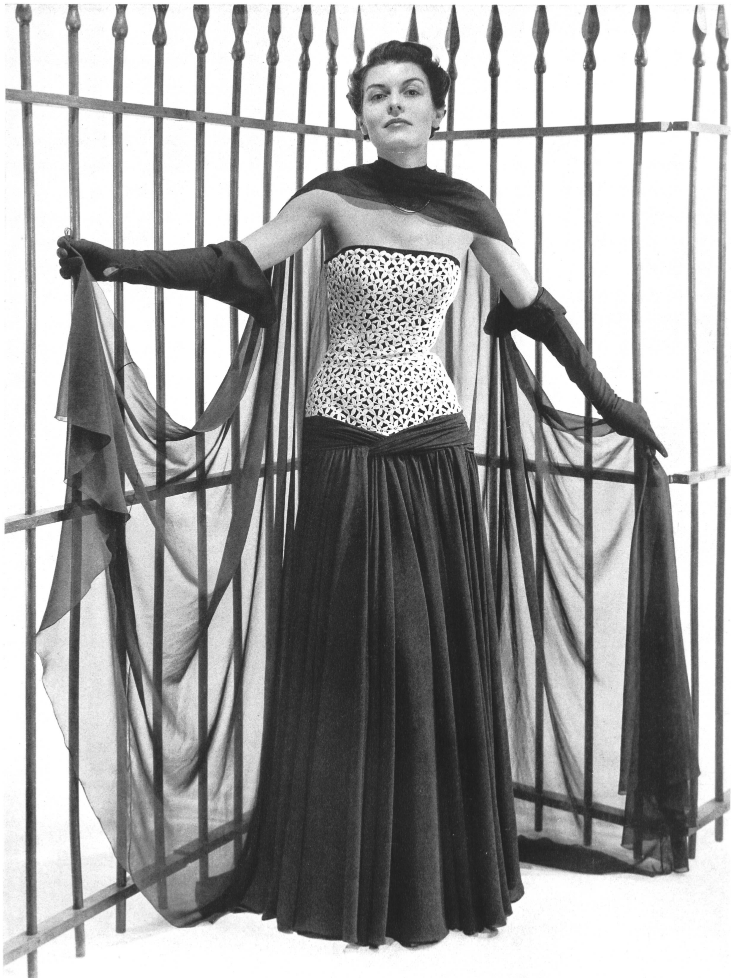
JEAN DESSES Bischoff Textiles S. A., St-Gall THIÉBAUT-ADAM, PARIS