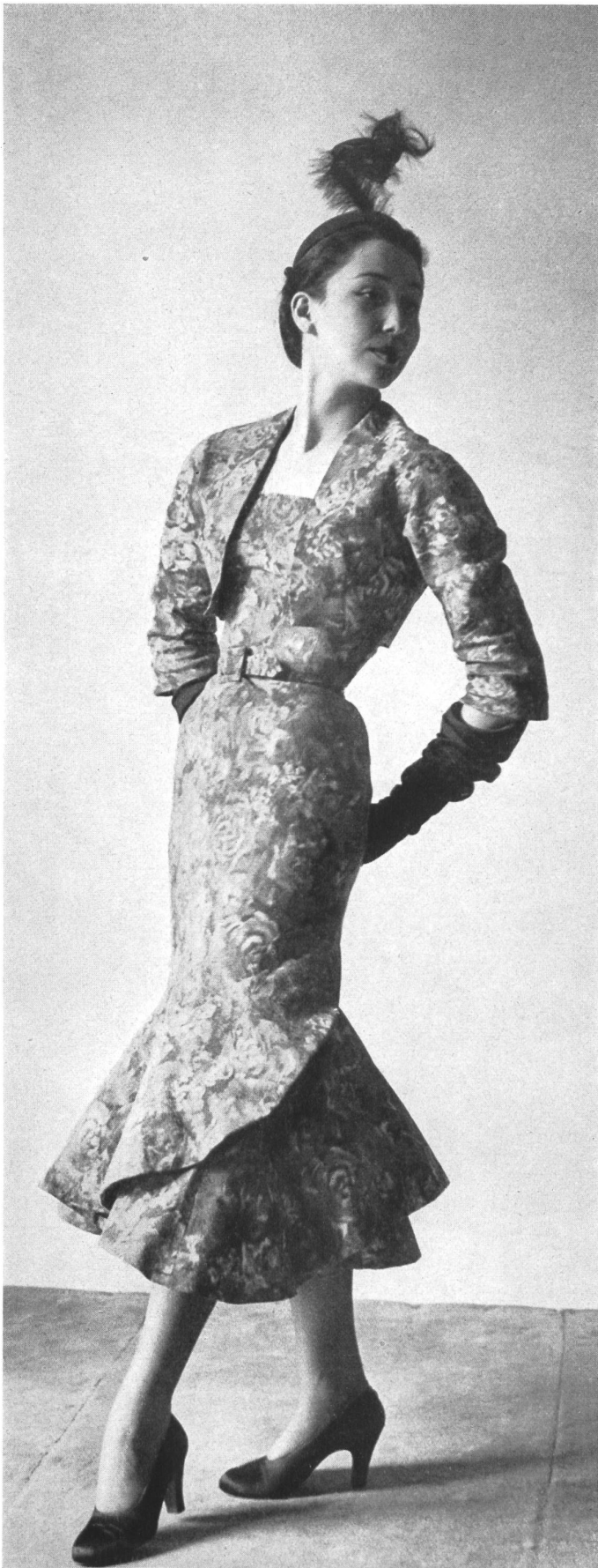
BALENCIAGA L. Abraham & Cie Soieries S. A., Zurich INAMO, ZURICH

CHRISTIAN DIOR → L. Abraham & Cie Soieries S. A., Zurich INAMO, ZURICH