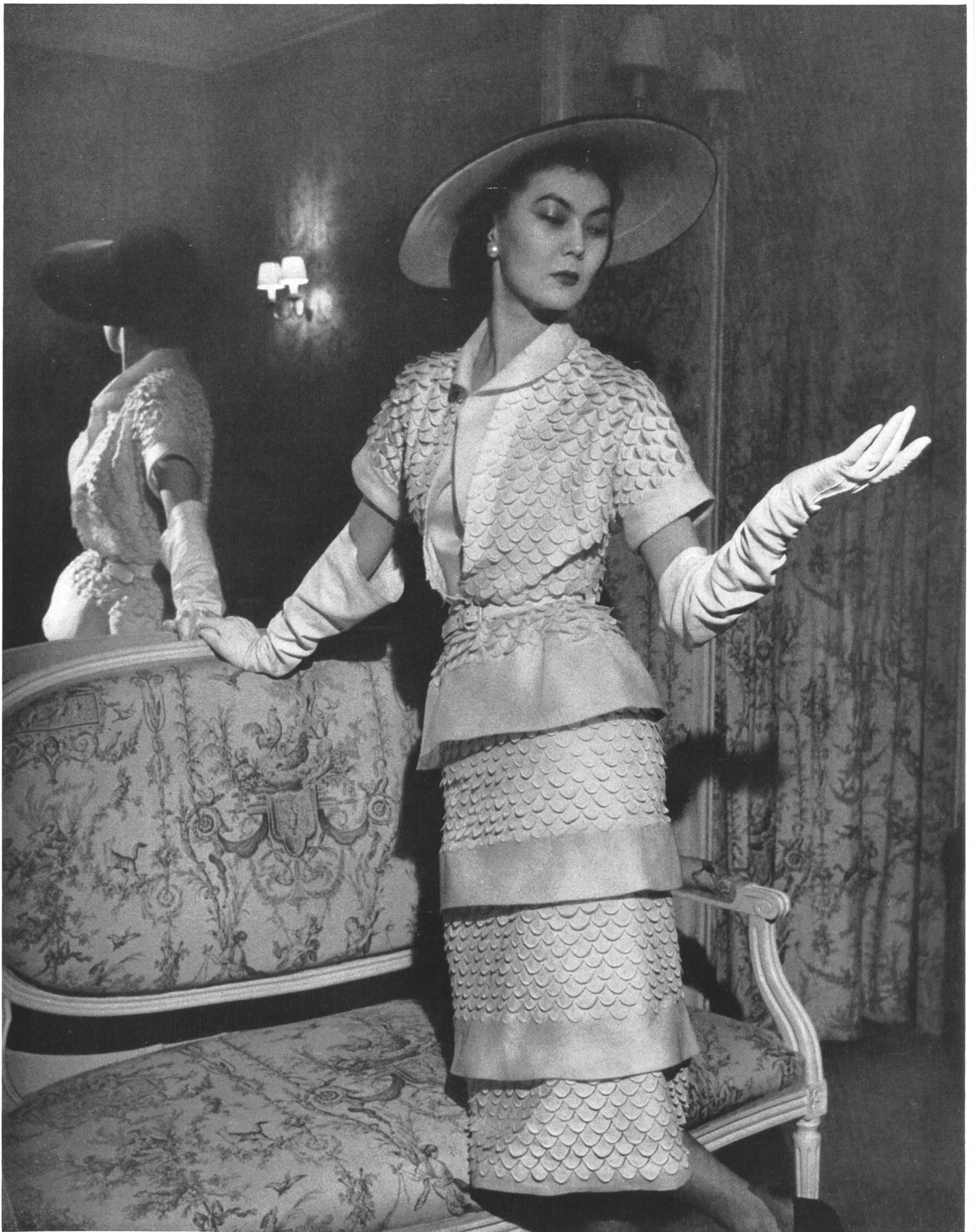
CHRISTIAN DIOR A. Naef & Cie, Flawil INAMO, ZURICH