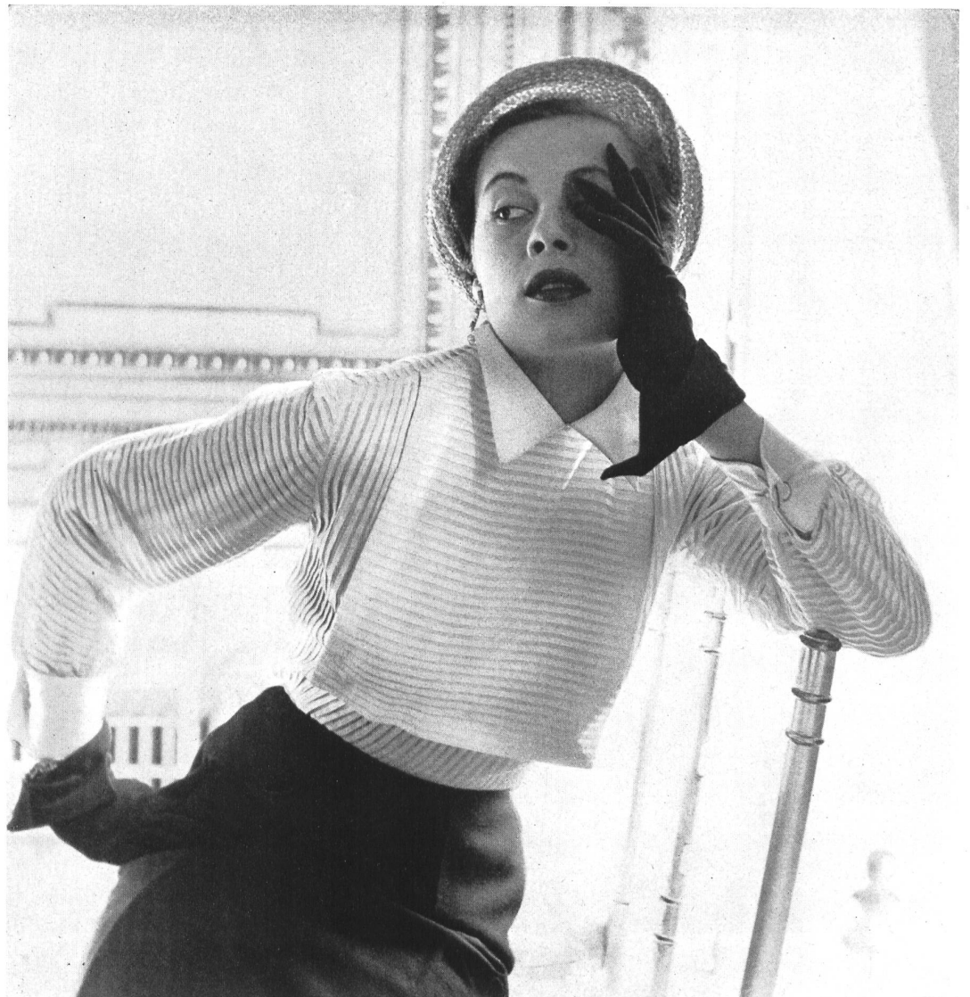
JEAN DESSÈS Stoffel & Cie, St-Gall INAMO, ZURICH