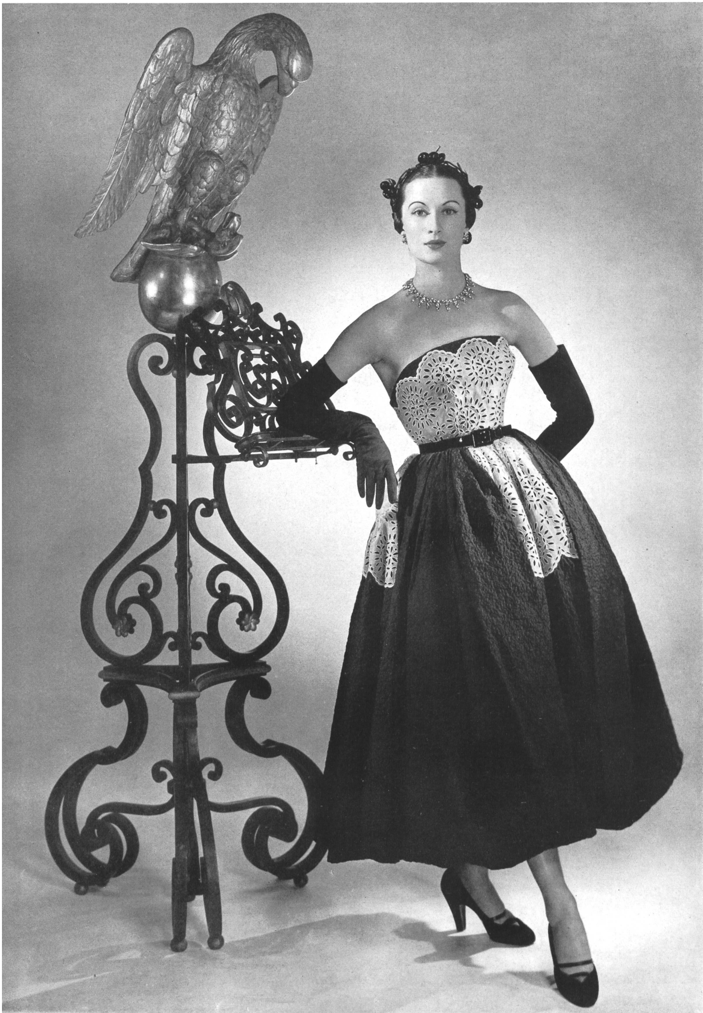
MOLYNEUX Union S. A., St-Gall THIÉBAUT-ADAM, PARIS