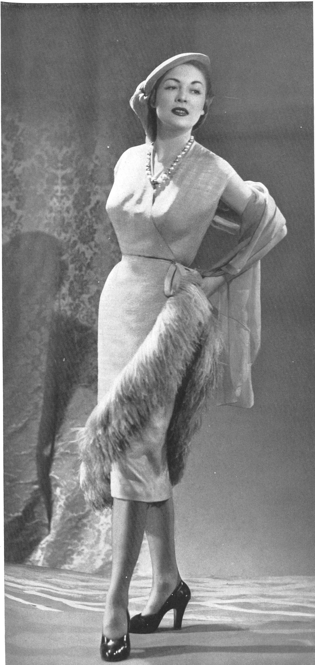
PIERRE BALMAIN Rudolf Brauchbar & Cie, Zurich