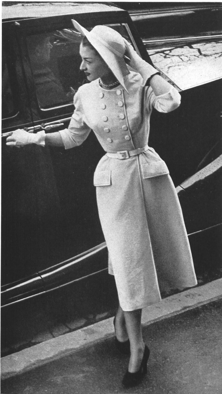
BALENCIAGA Stoffel & Cie, St-Gall INAMO, ZURICH