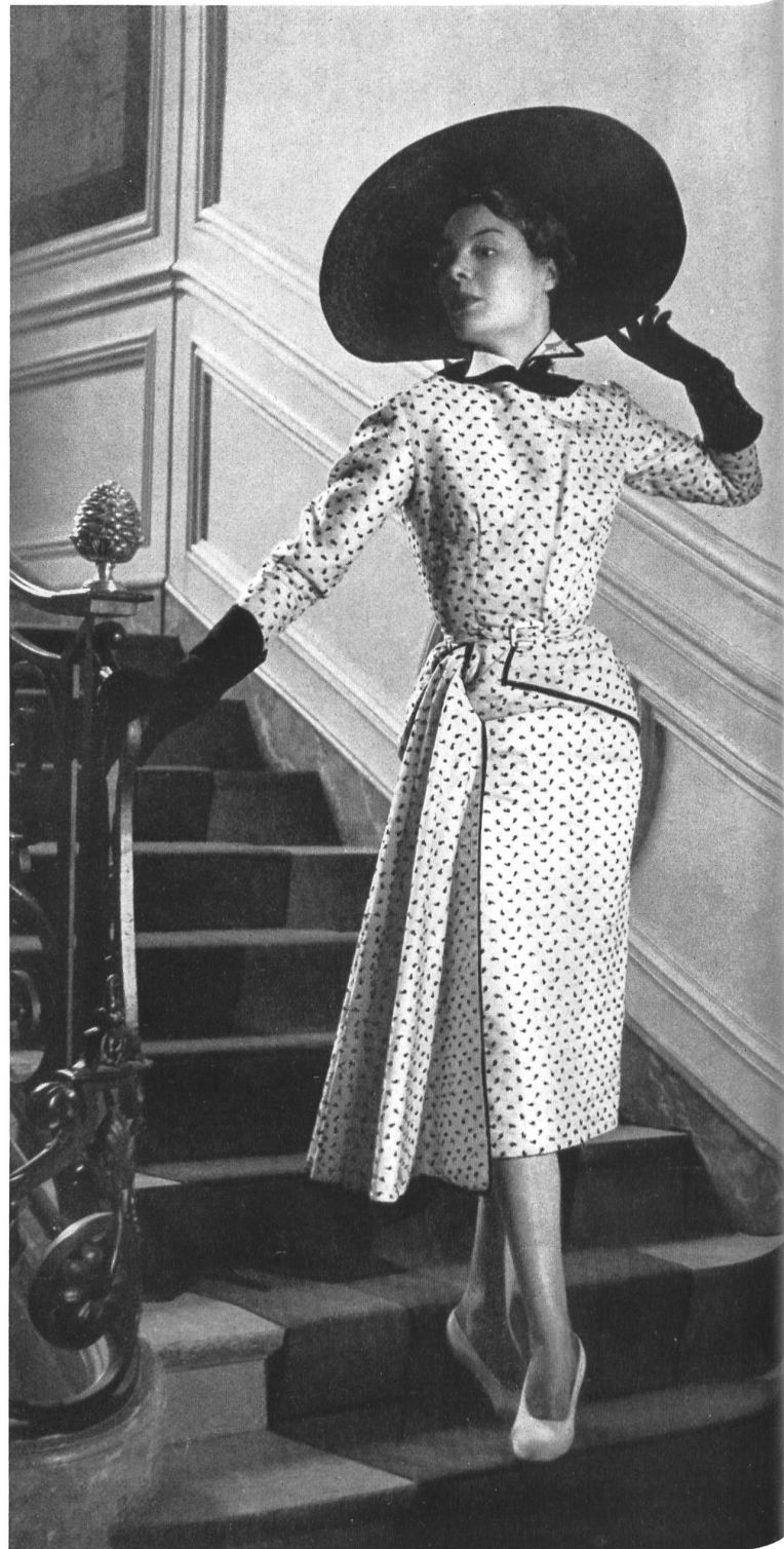
JACQUES FATH L. Abraham & Cie Soieries S. A., Zurich