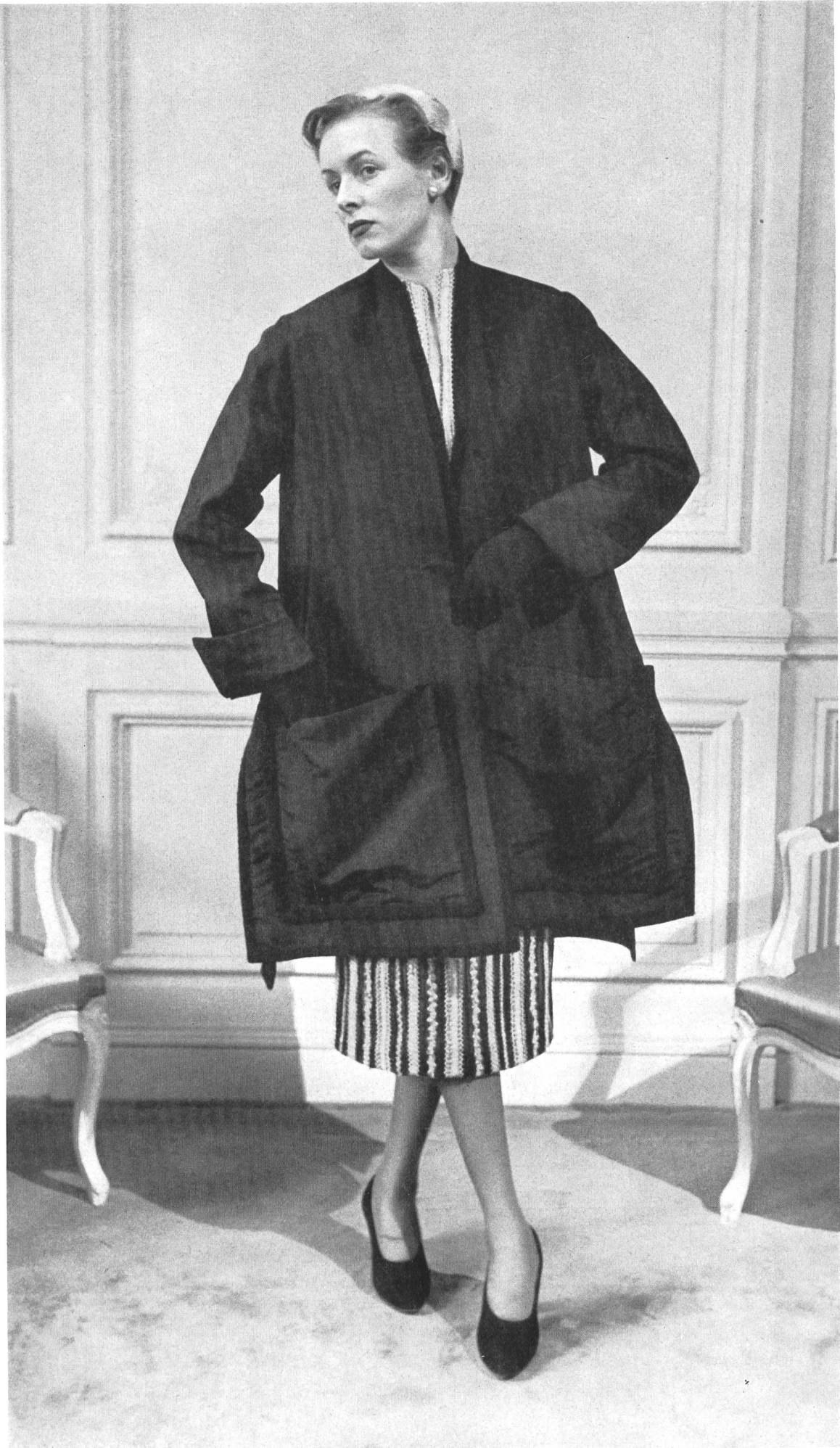
CHRISTIAN DIOR S. A. Stünzi Fils, Horgen