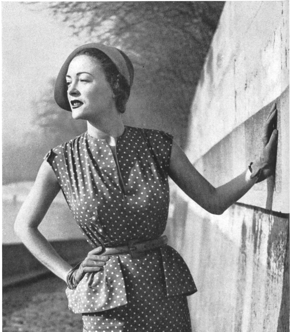
PIERRE BALMAIN L. Abraham & Cie Soieries S. A., Zurich