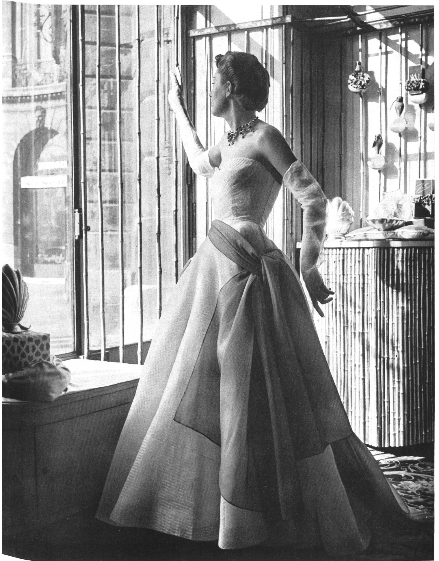
SCHIAPARELLI Stoffel & Cie, St-Gall INAMO, ZURICH