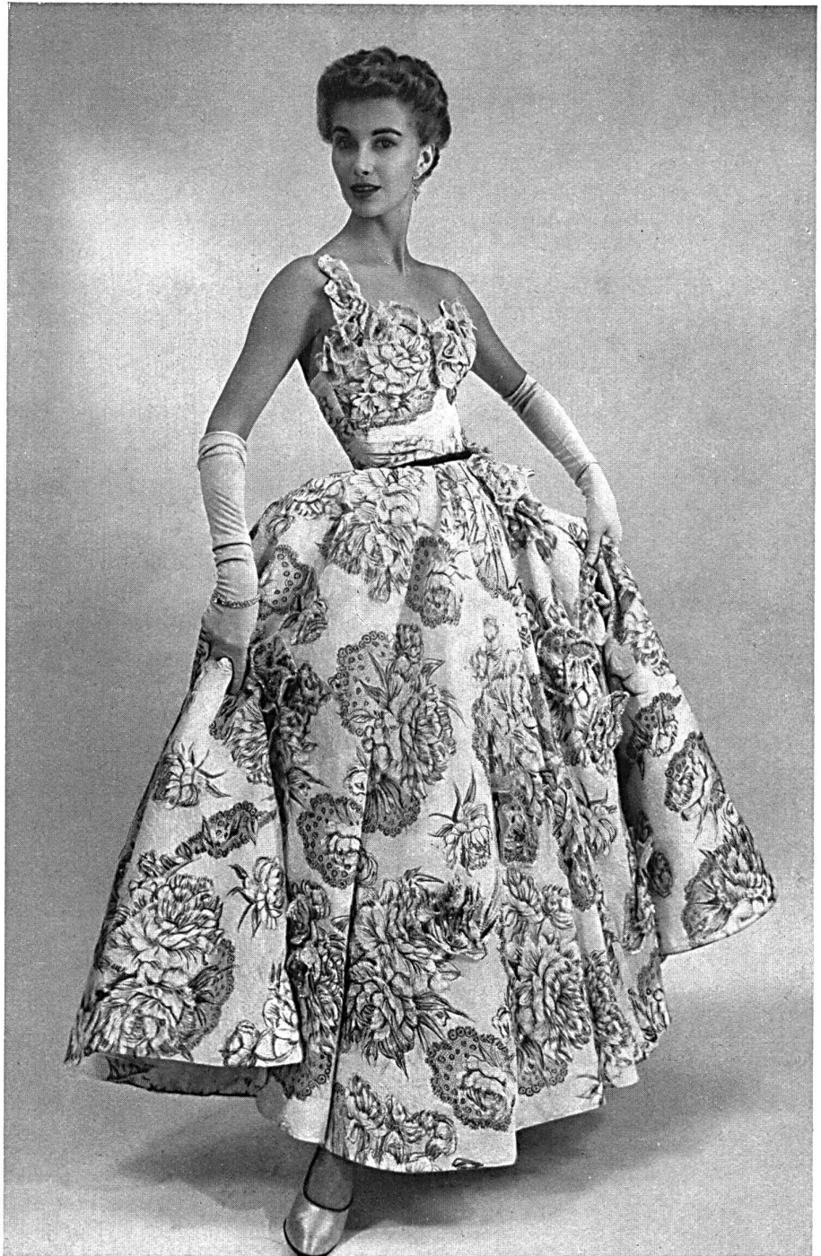
SWISS FABRIC GROUP, NEW YORK Multicoloured floral print on «Creperl» crinkled organdy.