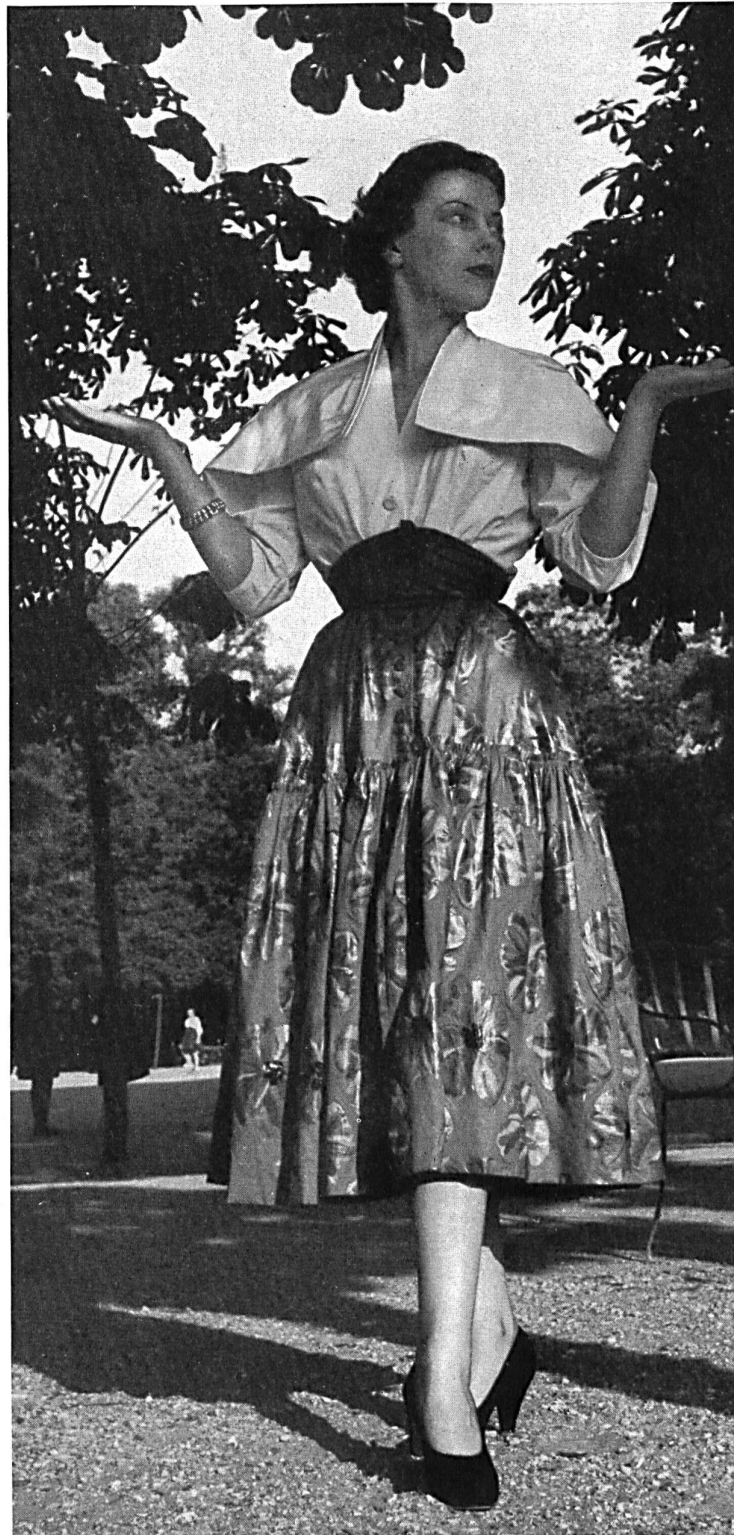
PAQUIN Percale crêpée de Stoffel & Co., St-Gall.