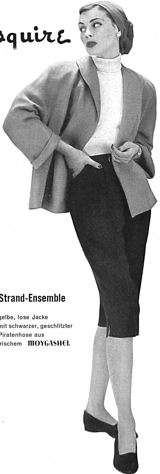
Moygashel is the trade mark and property of Messrs. Stevenson & Son. Ltd., Dungannon