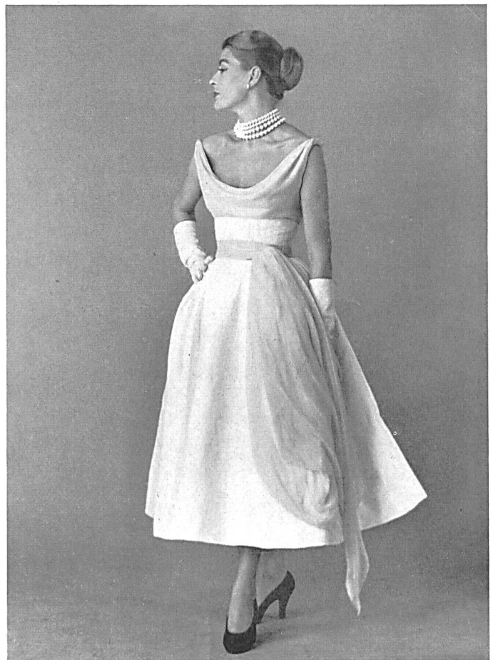
Coton jacquard blanc piqué fantaisie de Rudolf Brauchbar & Cie, Zurich distribué par Montex, Paris.