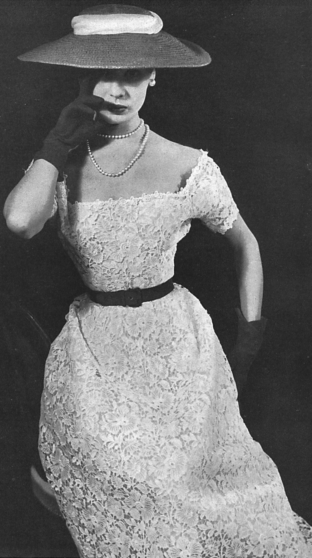
CHRISTIAN DIOR Dentelle de guipure de Forster Willi & Cie, St-Gall; grossiste à Paris : Pierre Brivet S. à r. l.