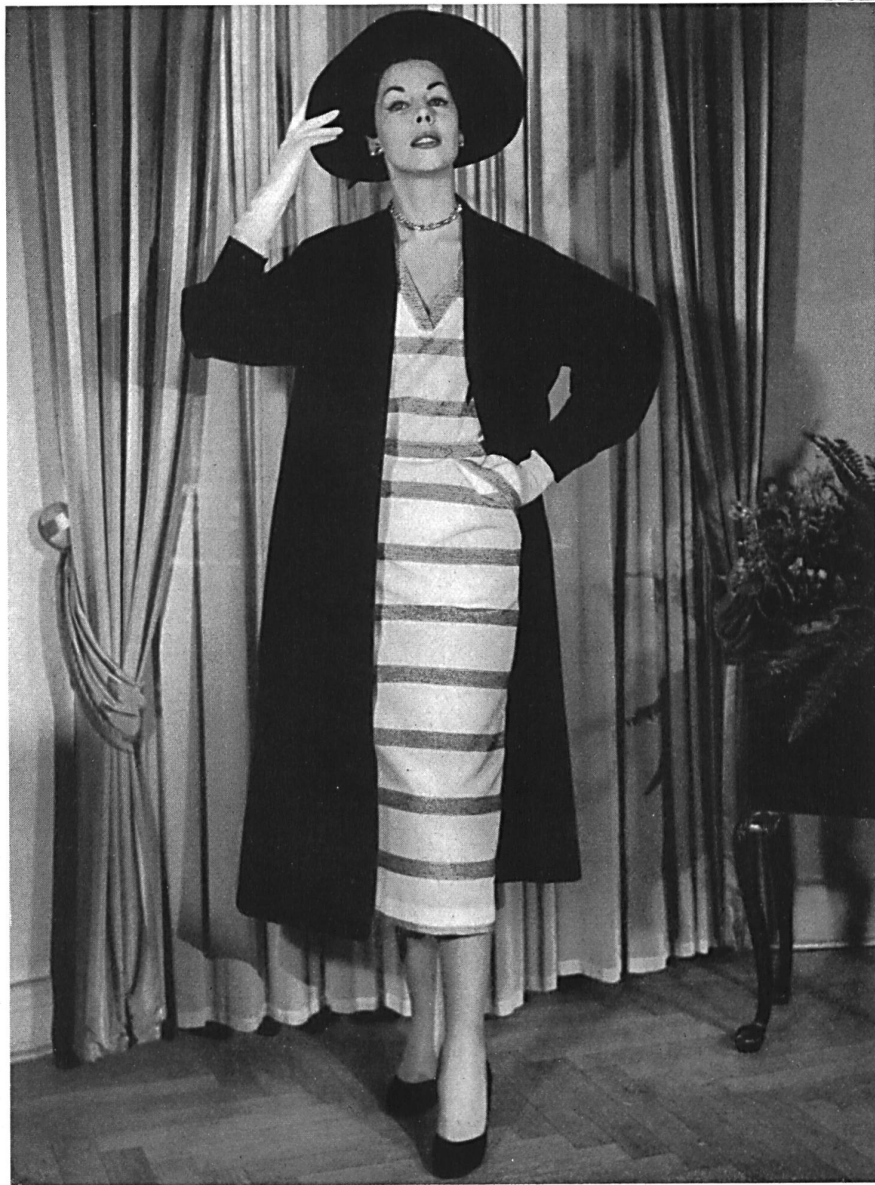
Bouclé Sport, 100 % rayonne. Modèle Bengtsons Konfektions A. B., Stockholm.