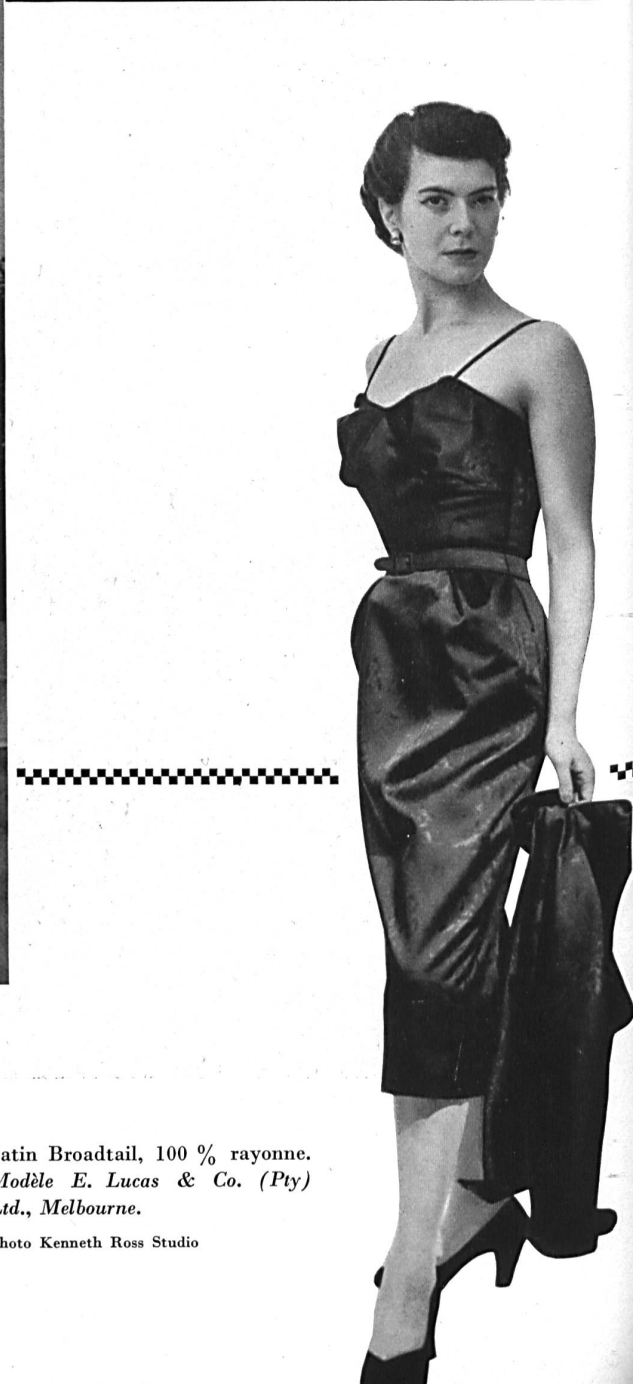
Satin Broadtail, 100 % rayonne. Modèle E. Lucas & Co. (Pty) Ltd., Melbourne.