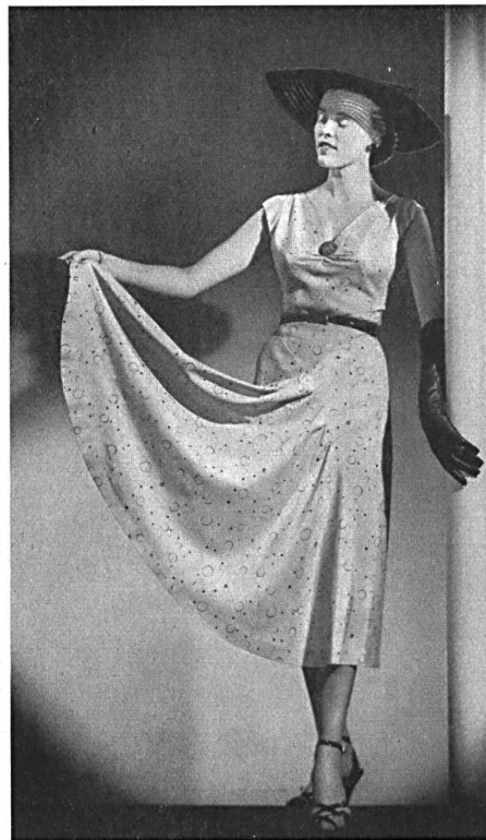
Kiang-Su imprimé. Modèle M. K. Manufacturers Ltd., Auckland.