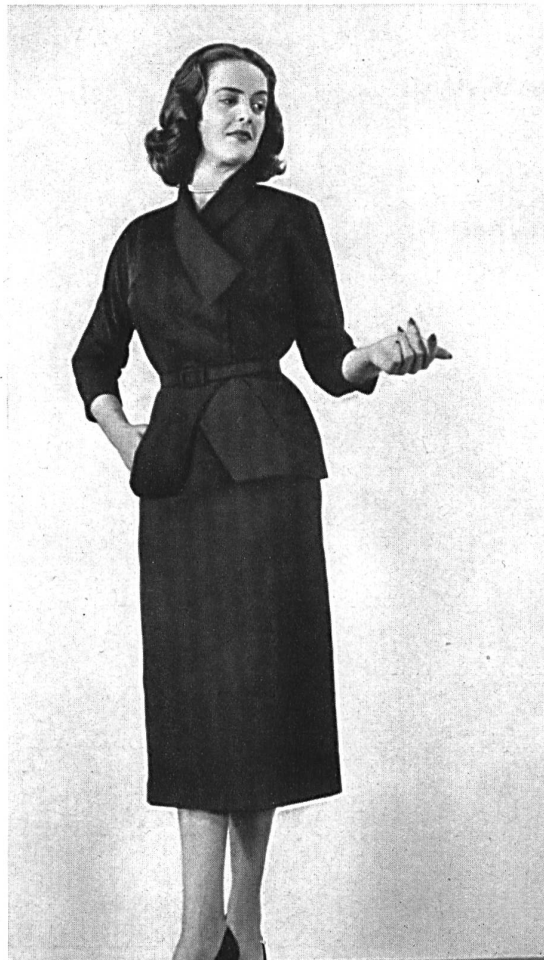
Grosgrain couture, rayonne et fibranne. Modèle Peggy Fashions (Pty) Ltd., Johannesburg.