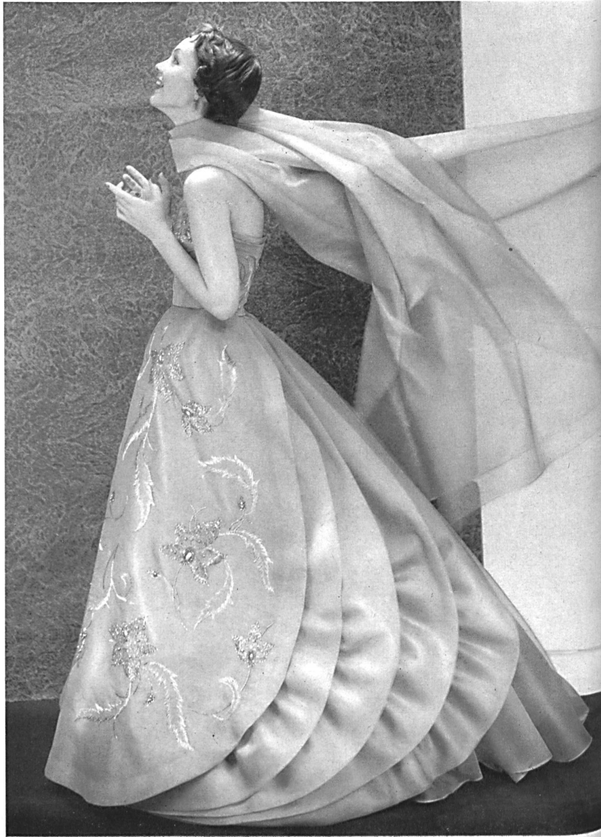
Organza pure soie. Modèle Marty & Cie, Zurich.