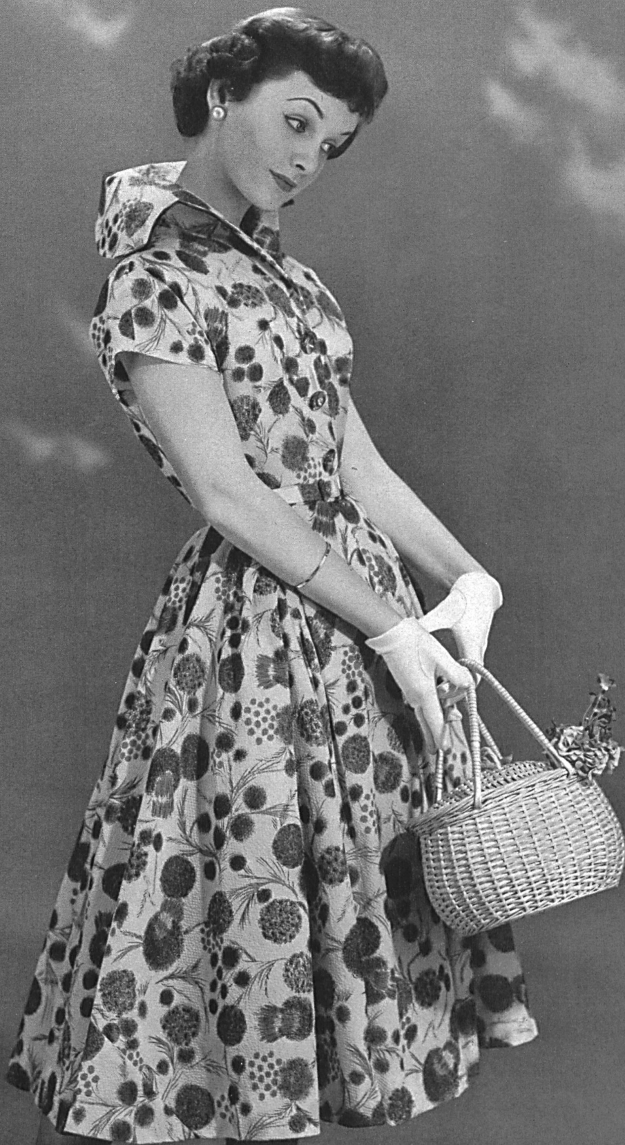
Nylon imprimé. Modèle Willy Meyer S. A., Zurich.