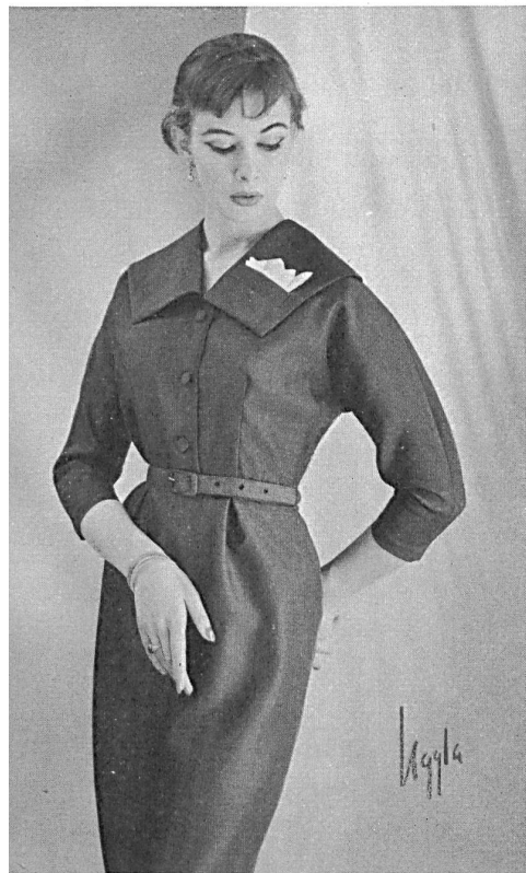
City Modeller, Stockholm

Belrobe (100 % fibranne) de : Heer & Cie S. A., Thalwil