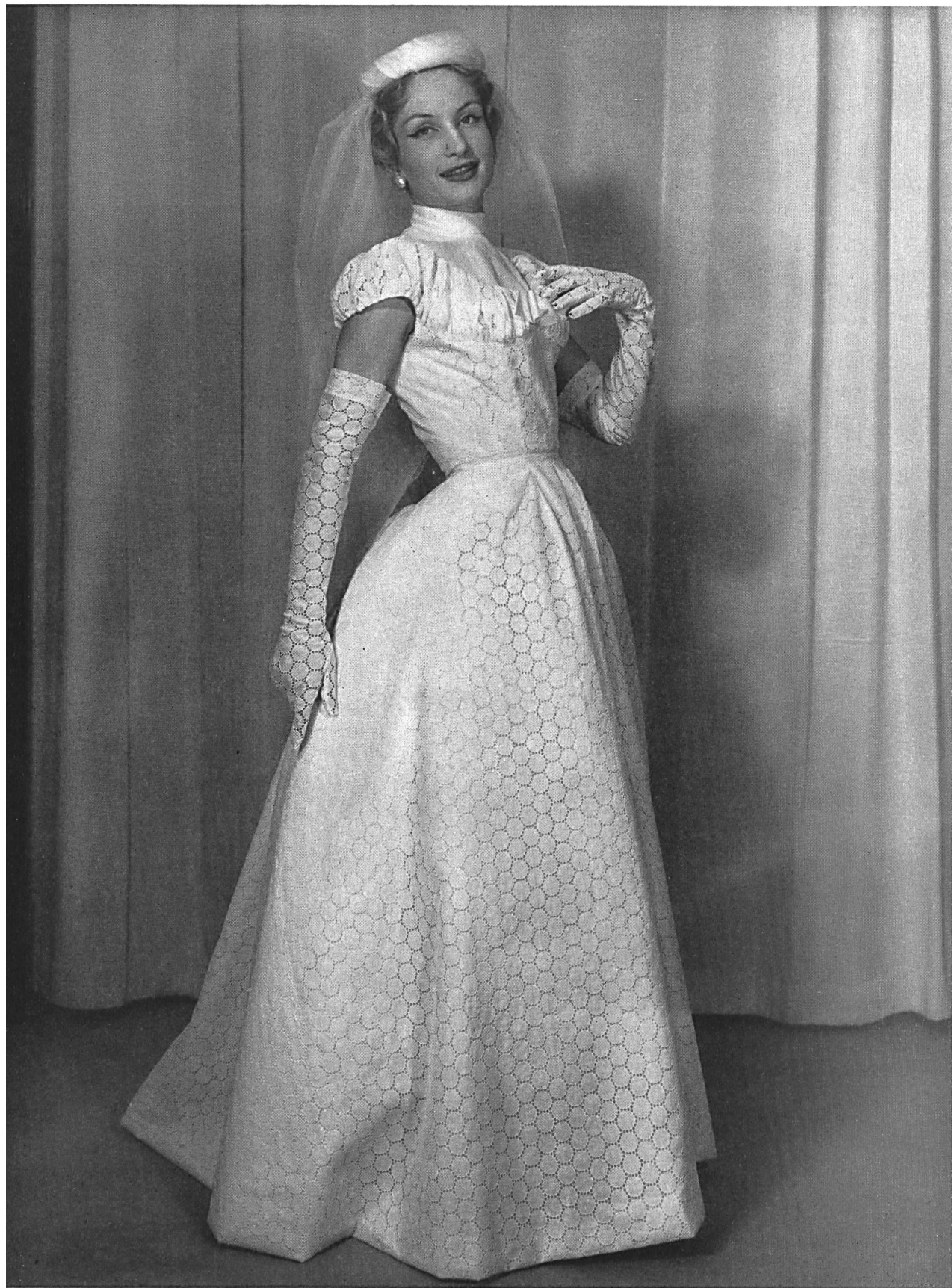
CHARLES MONTAIGNE Batiste brodée de Reichenbach & Co., Saint-Gall Montex, Paris