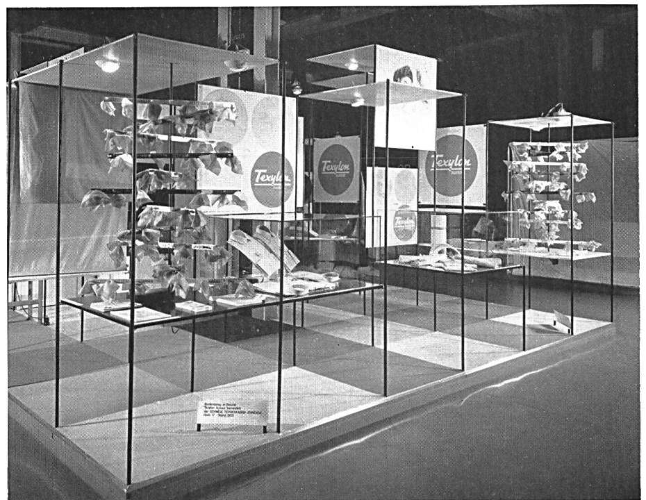
Le stand de la maison : Der Stand der Firma :

Seiten 89 (unten) und 90 : Einige Aspekte der Ausstellung verschiedener Branchen der Bekleidungsindustrien im Salon « Madame - Monsieur ».