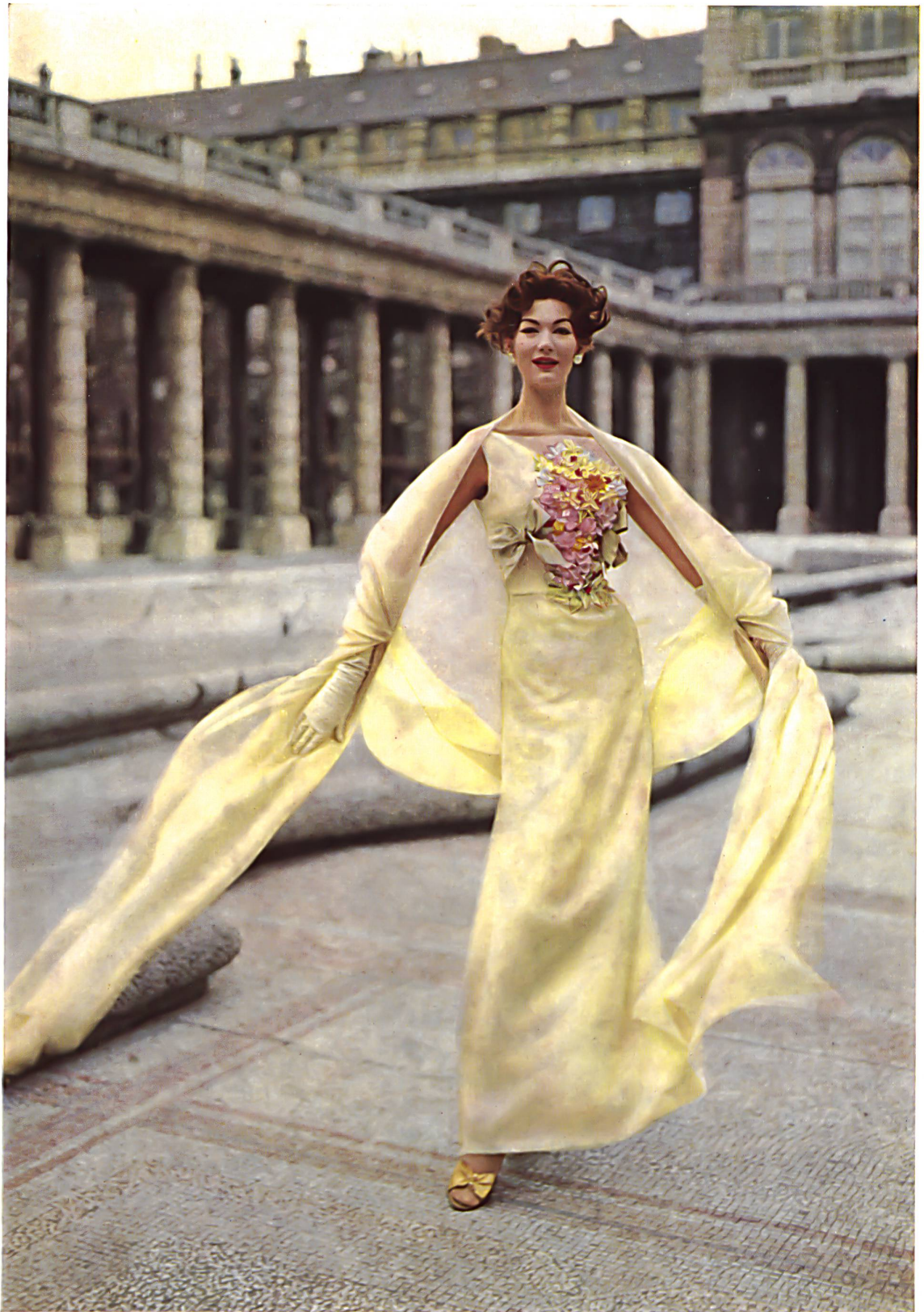
JEAN PATOU Dentelles appliquées de Forster Willi & Co., Saint-Gall Grossiste à Paris: Tisseurs B de M