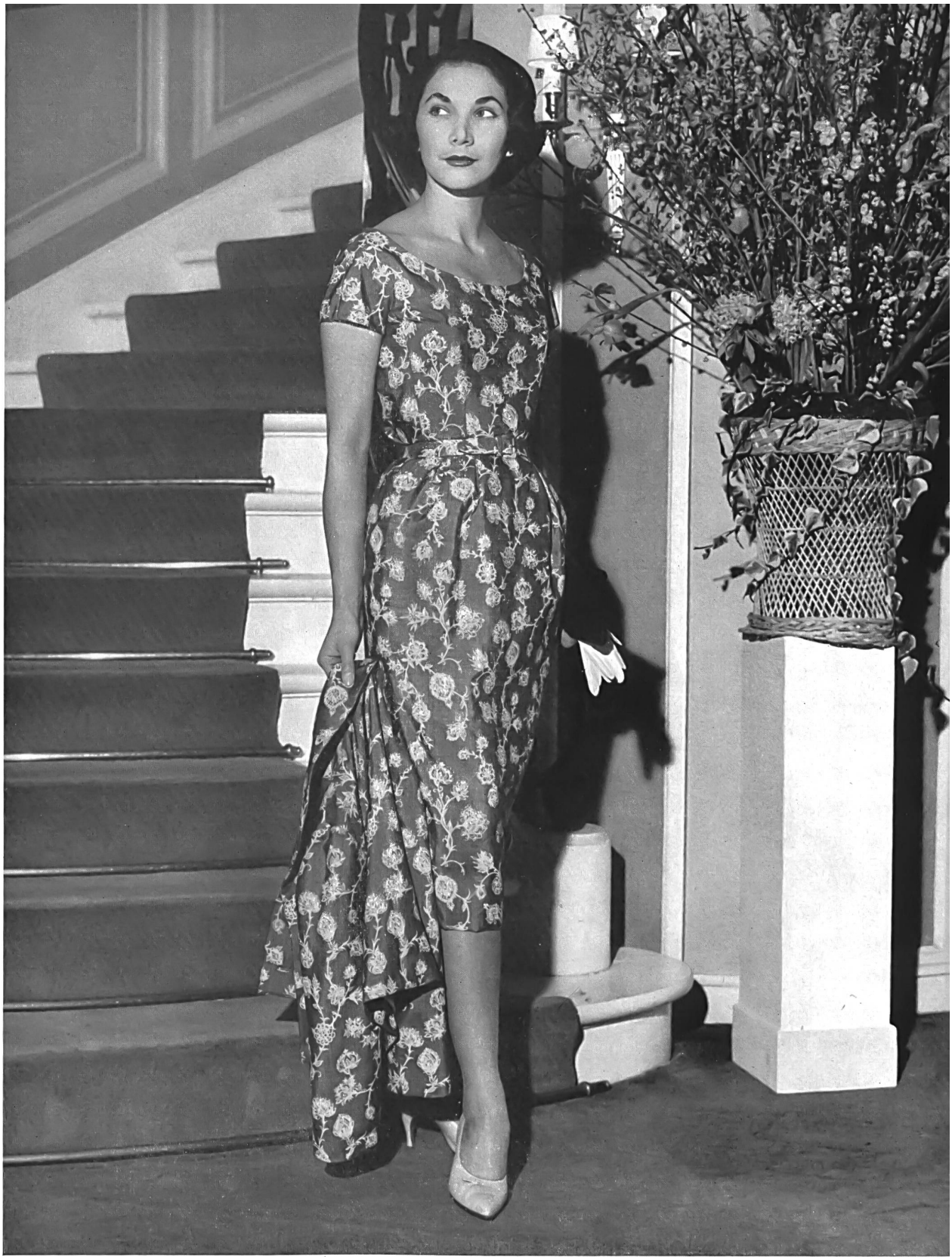
CHRISTIAN DIOR « Boutique » Honan imprimé de Rudolf Brauchbar & Cie, Zurich

Tous les documents de Paris reproduits dans ce numéro représentent des modèles réservés dont la reproduction est interdite