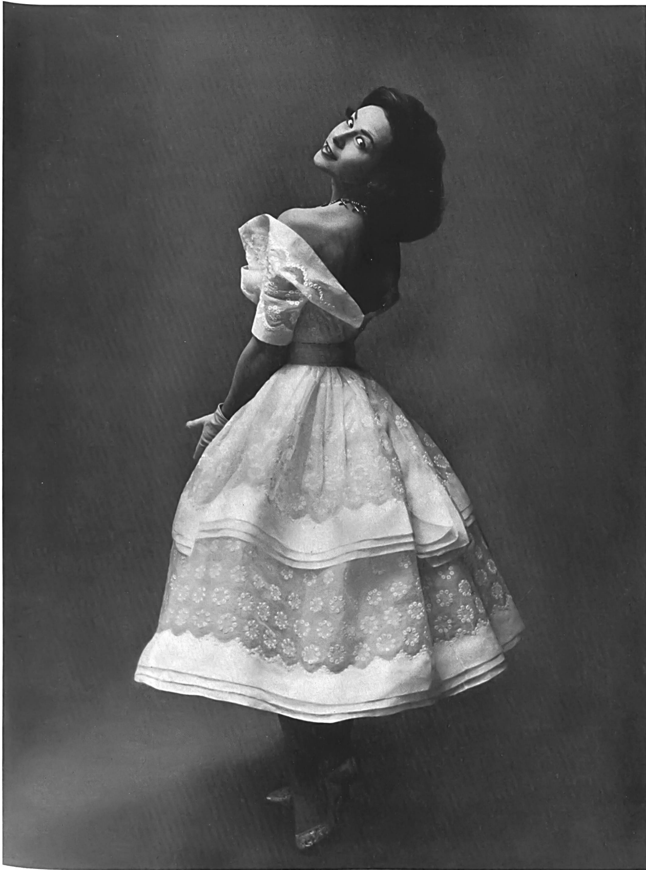
CARVEN Organdi blanc brodé de Reichenbach & Co., Saint-Gall Montex, Paris

Tous les documents de Paris reproduits dans ce numéro représentent des modèles réservés dont la reproduction est interdite