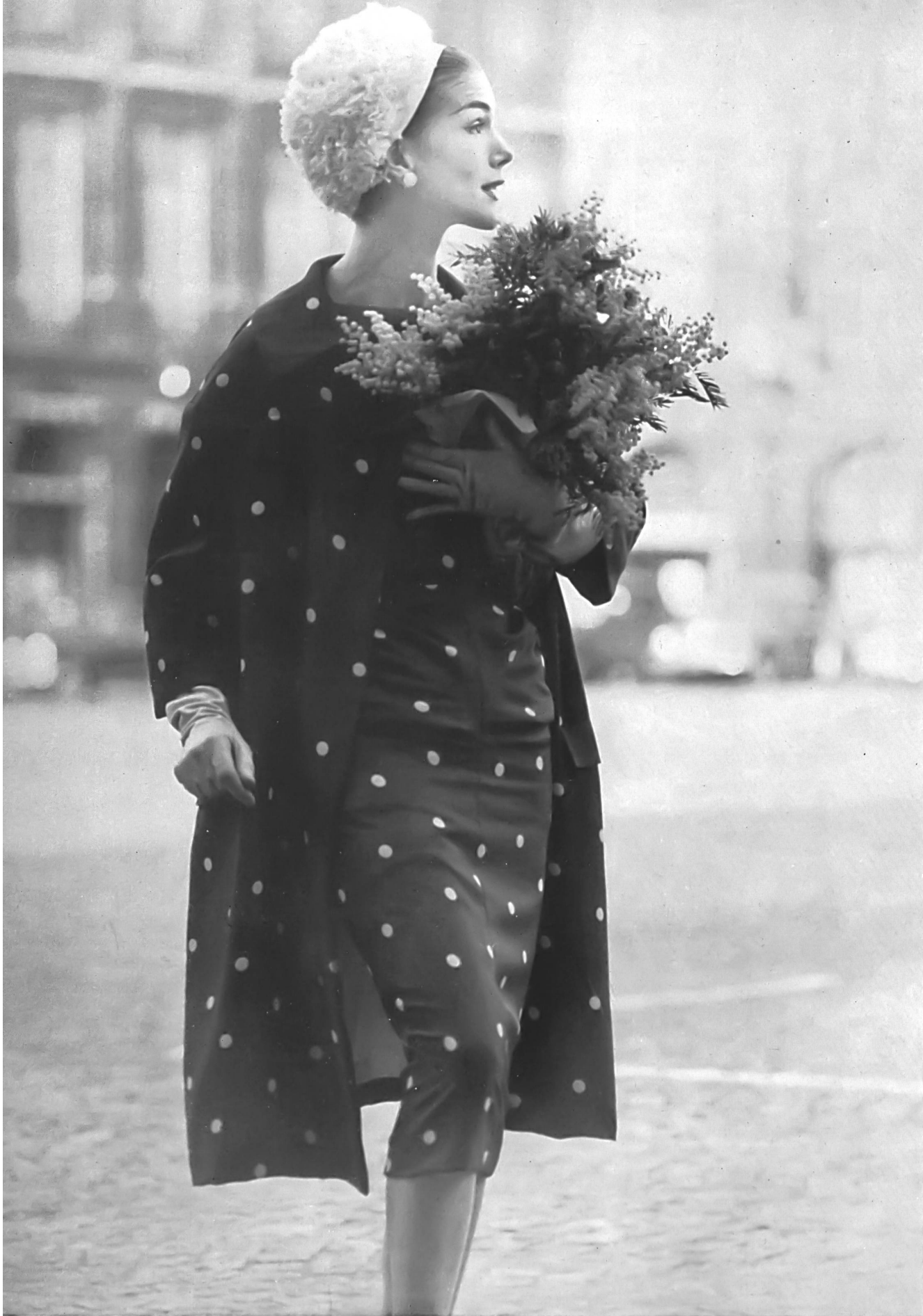
JEAN DESSÈS « Ramanza » imprimé de L. Abraham & Cie, Soieries S.A., Zurich