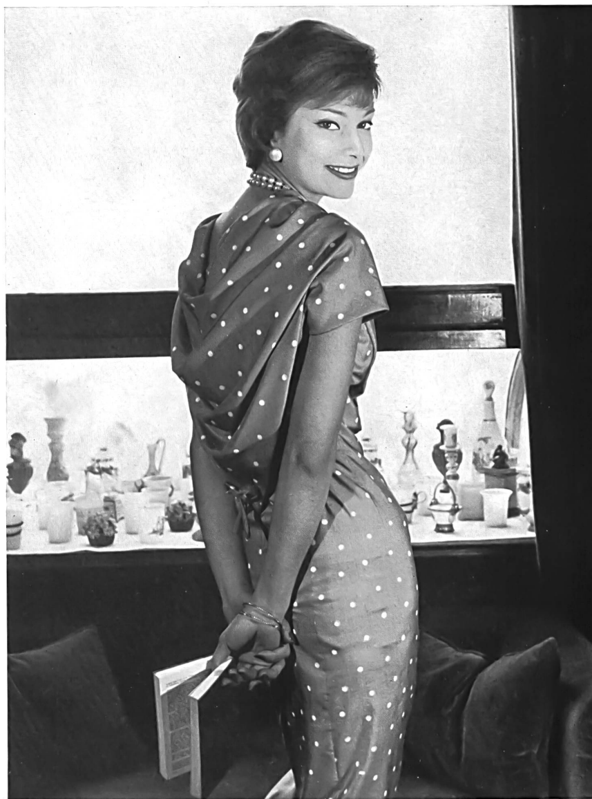
GUY LAROCHE « Super-Miyako » imprimé de L. Abraham & Cie, Soieries S.A., Zurich