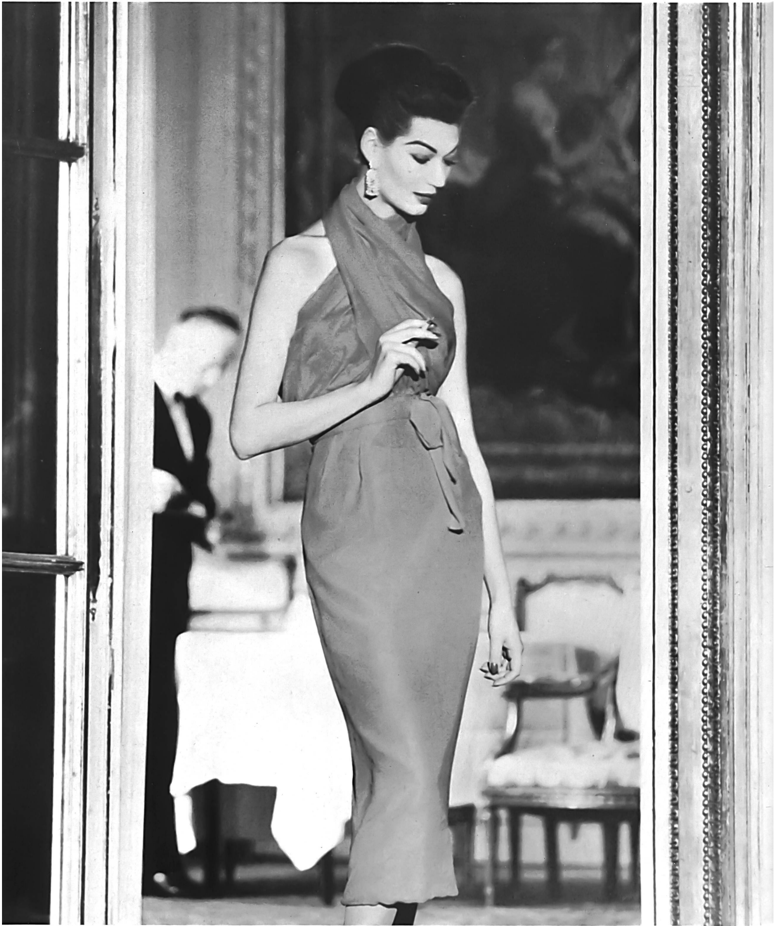
PIERRE BALMAIN Mousseline «Follette» de L. Abraham & Cie, Soieries S. A., Zurich