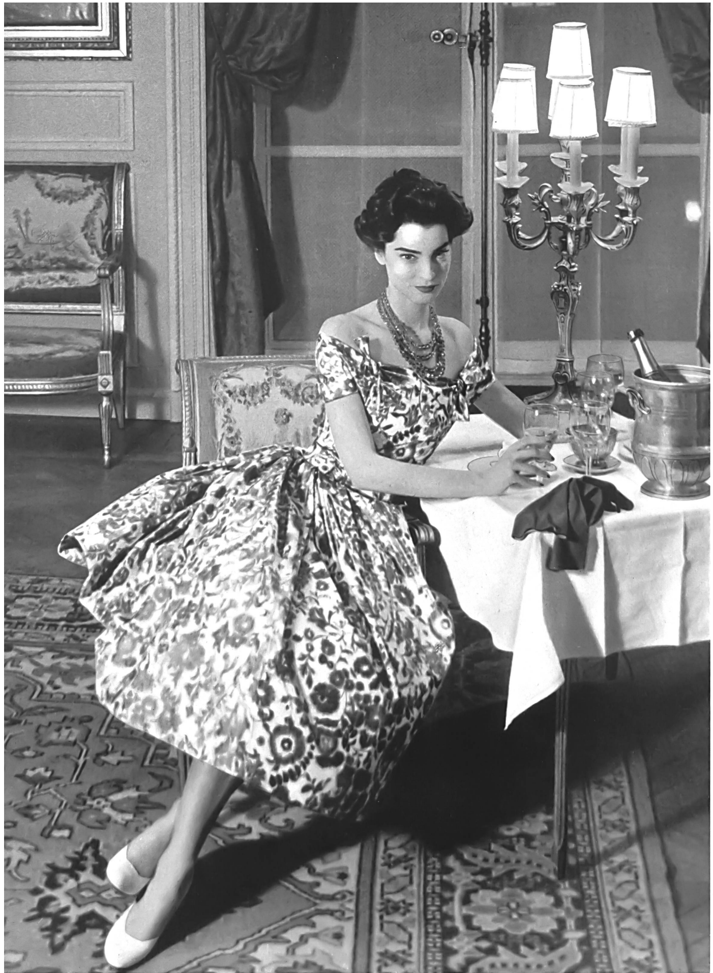
CHRISTIAN DIOR Taffetas chiné de L. Abraham & Cie, Soieries S. A., Zürich