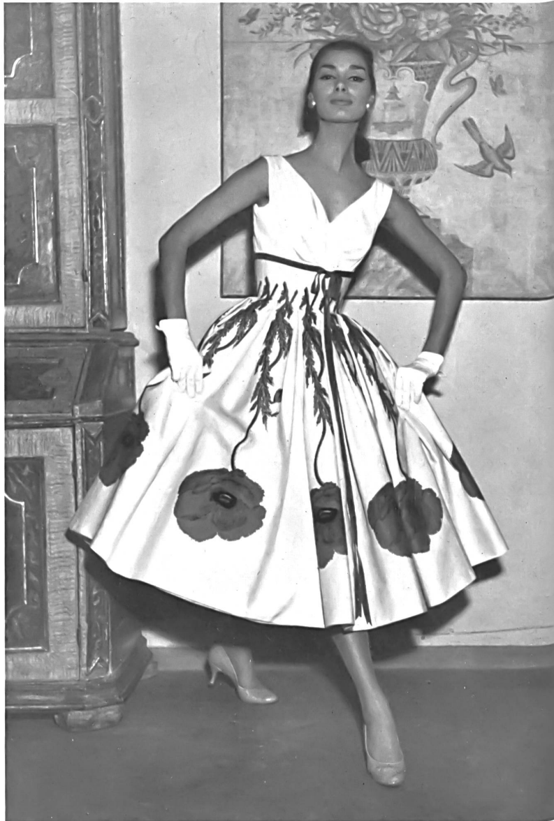
2 Pavots imprimés, rouge sur blanc. Papaveri stampati, rosso sopra bianco. Modèle: Veneziani, Milan