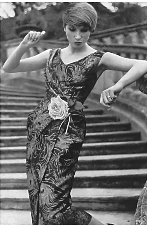
Robe de cocktail en satin de coton imprimé. Cocktail dress in printed cotton satin. Vestido de cóctel, de satén de algodón estampado. Cocktailkleid aus bedrucktem Baumwoll-Satin.