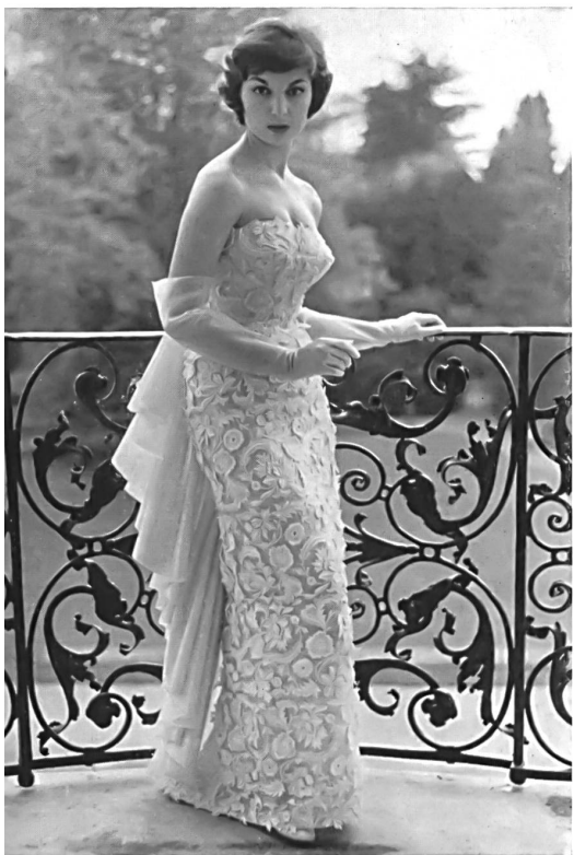
Très riche robe du soir en guipure lourde de Saint-Gall. Sumptuous evening dress in heavy St-Gall guipure. Suntuosísimo vestido de noche hecho de encaje de guipur de San Galo. Prunkvolle Abendrobe aus schwerer St. Galler Guipure-Spitze.