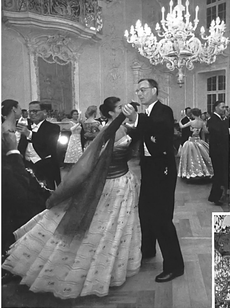
Le comte Lennart Bernadotte ouvre le bal. Count Lennart Bernadotte opens the ball. El conde Lennart Bernadotte abre el baile. Graf Lennart Bernadotte eröffnet den Ball.

The more than a hundred and fifty journalists from Switzerland and fourteen other European countries who were invited to Mainau to see this original and very elegant presentation also had the pleasure of seeing a ballet and a second fashion parade. Opposite we show a few photographs taken on this occasion.