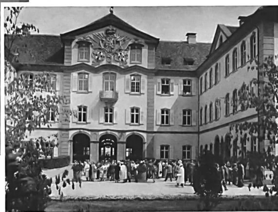
Arrivée des invités dans la cour d'honneur du château de Mainau. Arrival of the guests in the main court of Mainau castle. Llegada de los invitados al patio de honor del castillo de Mainau. Ankunft der Gäste in den Ehrenhof des Schlosses Mainau.