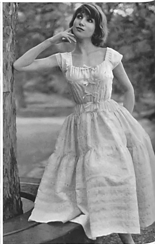
Robe de garden-party en broderie sur coton linette. Garden-party dress in embroidery on cotton fabric. Vestido para garden-party, de tela de algodón bordada. Garden-party Kleid aus besticktem Baumwollstoff.