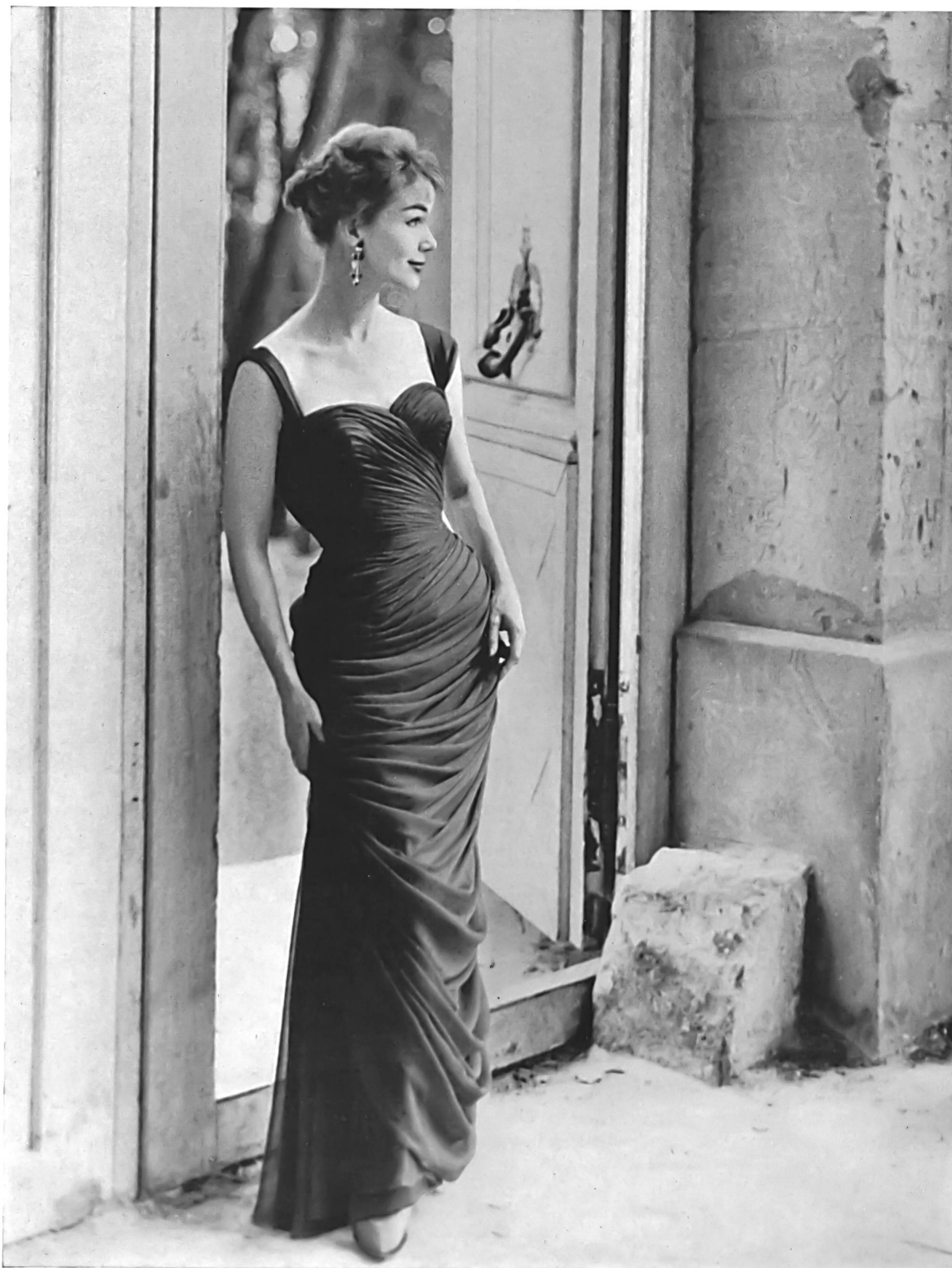
PIERRE BALMAIN Mousseline « Follette » de L. Abraham & Cie, Soieries S. A., Zurich