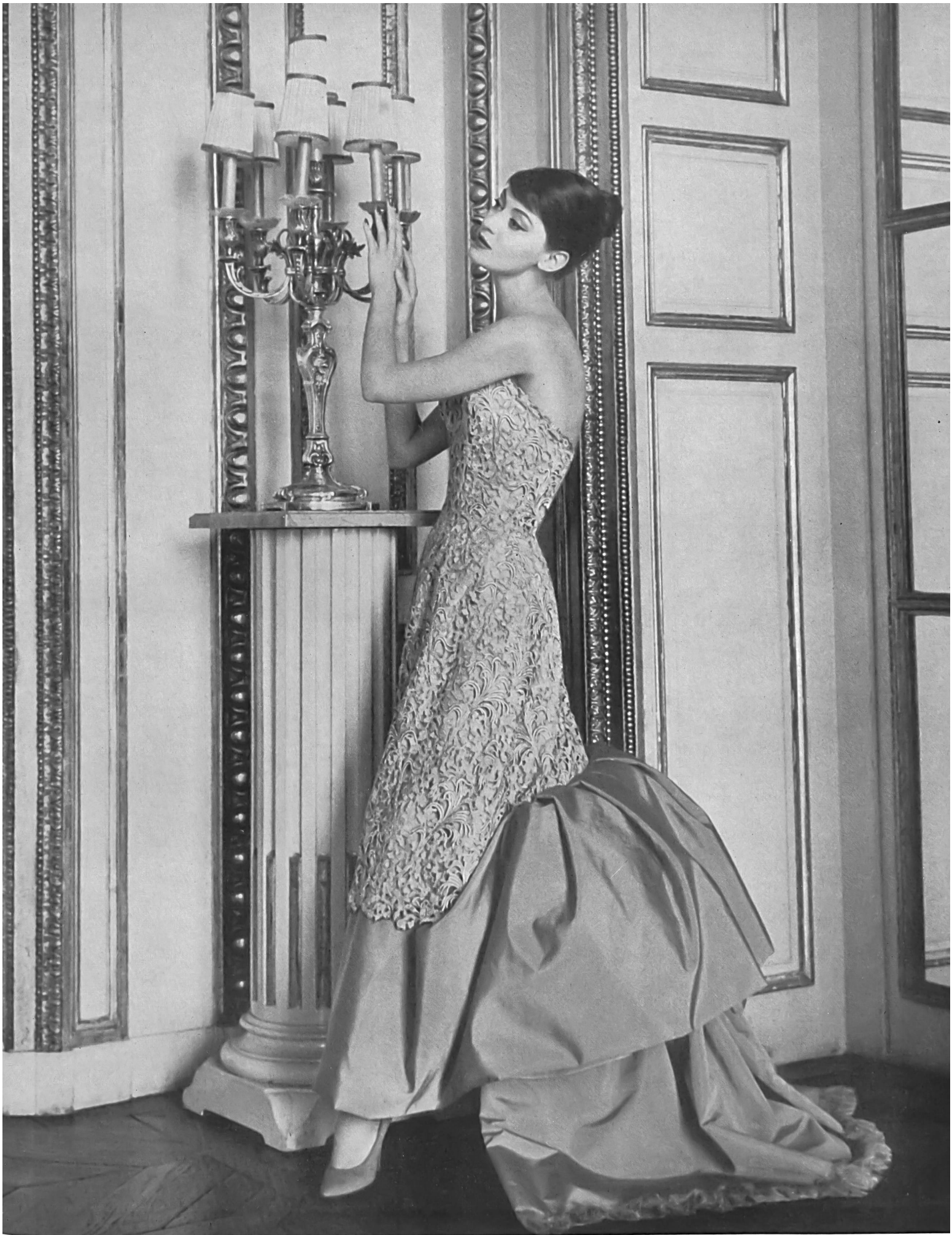
JEAN DESSES Guipure en lamé or de Forster Willi & Co., Saint-Gall Grossiste à Paris : Les Tisseurs B de M