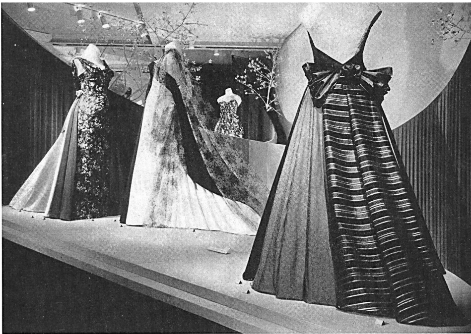
Exposition de l'industrie suisse de la soierie : pure soie, tulle, nylon. Display of the Swiss silk industry : pure silk, net, nylon. Exposición de la industria sedería suiza : seda pura, tul, nylon. Ausstellung der Schweiz. Seidenindustrie : reine Seide, Tüll, Nylon.