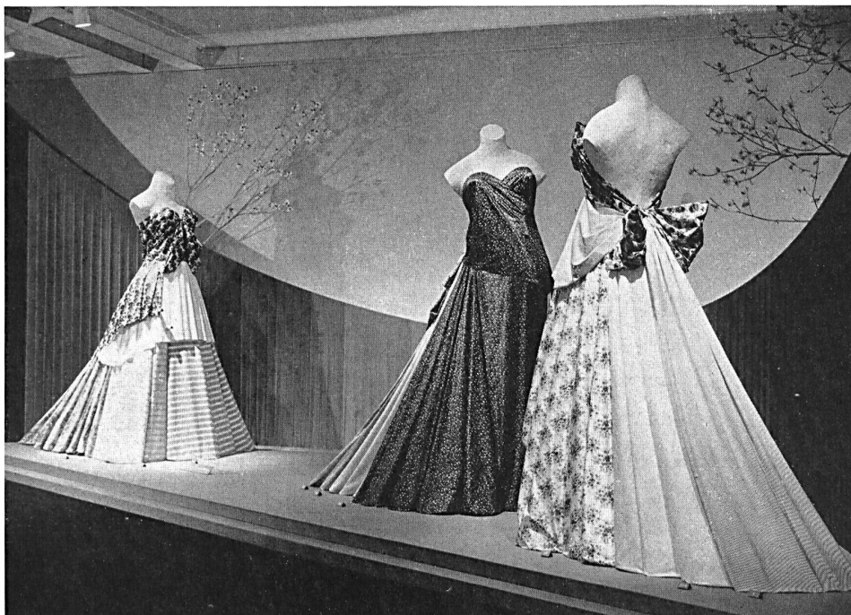
Exposition de l'industrie suisse du coton : tissus tissés en couleurs et imprimés. Display of the Swiss cotton industry : colour woven and printed fabrics. Exposición de la industria algodonera suiza : tejidos en colores y estampados. Ausstellung der Schweiz. Baumwollindustrie : Buntgewebe und Druckstoffe.