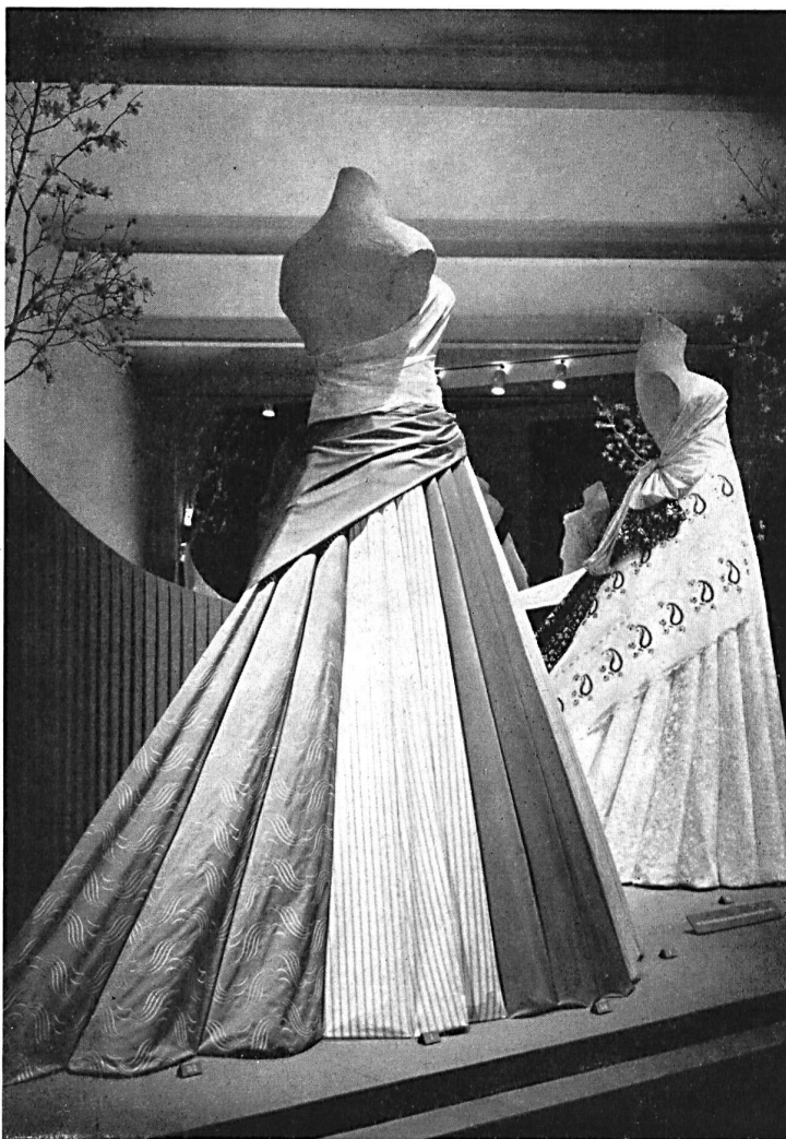
Vue partielle de l'exposition des broderies de Saint-Gall. Part view of the St-Gall embroideries' display. Vista parcial de la exposición de bordados de San Galo. Teilansicht der Sankt-Galler Stickerei-Ausstellung.

This year, this always very popular exhibition showed over 150 different fabrics as well as 14 showcases of footwear and finished articles such as lace blouses, printed and embroidered handkerchiefs, little girls' frocks, scarves, embroidered galloons and ribbons. It was the greatest credit to the organisers, the Zurich Association of the Silk Industry, the Publicity Centre of the Swiss Cotton and Embroidery Industry, the Association of Swiss Cloth Manufacturers, the Association of Swiss Worsted Mills and the Bally's Shoe Factories Ltd.