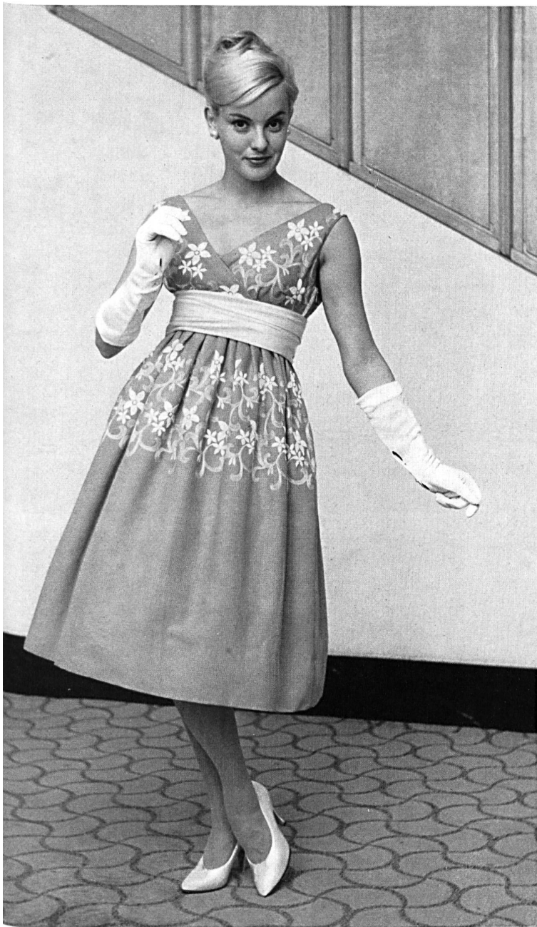
JACOB ROHNER S. A., REBSTEIN

Natté coton brodé. Embroidered basket-weave cotton.