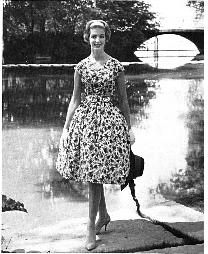
Summer dress in a printed Helanca knitwear material. MODÈLE «ISA», JOS. SALLMANN & CO., AMRISWILL