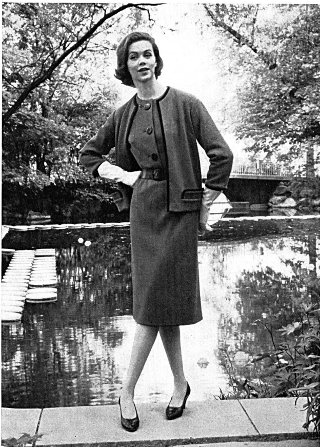
Two-piece outfit in mixed Helanca and wool knitted herring-bone material. MODÈLE VOLLMÖELLER S. A., USTER