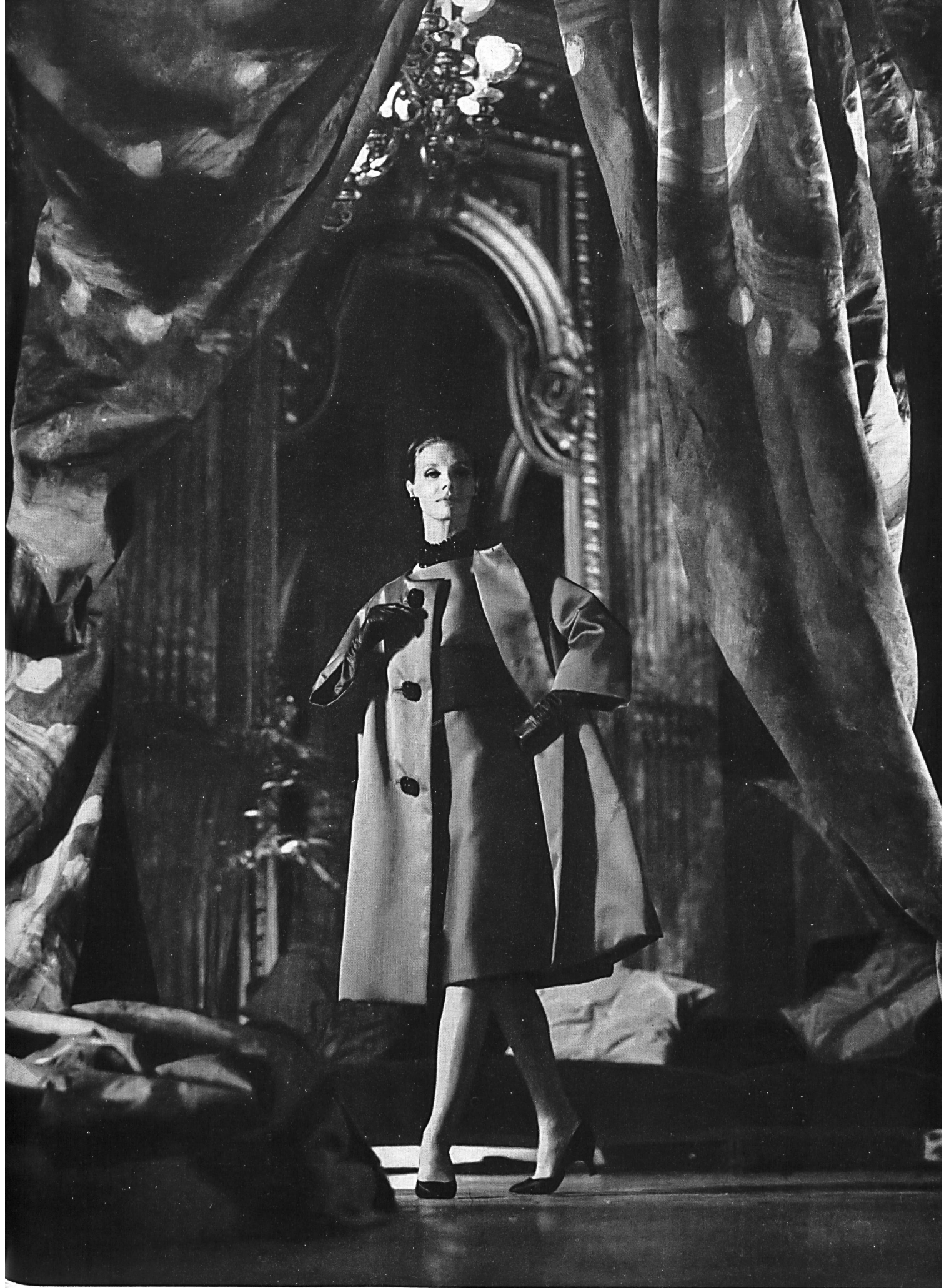
CHRISTIAN DIOR Robe et manteau en Satin double-face de L. Abraham & Cie, Soieries S. A., Zurich