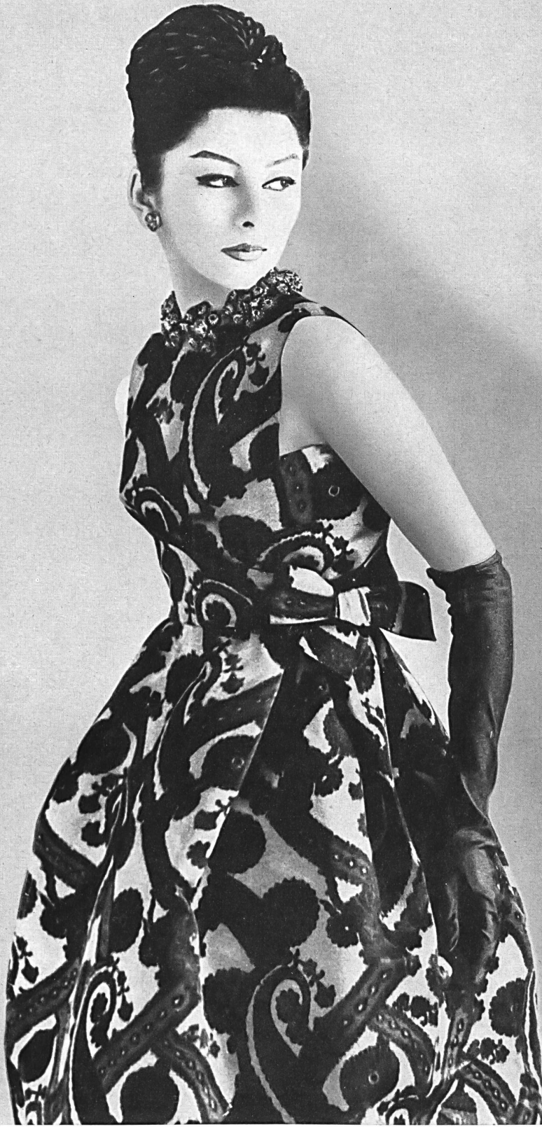
HUBERT DE GIVENCHY