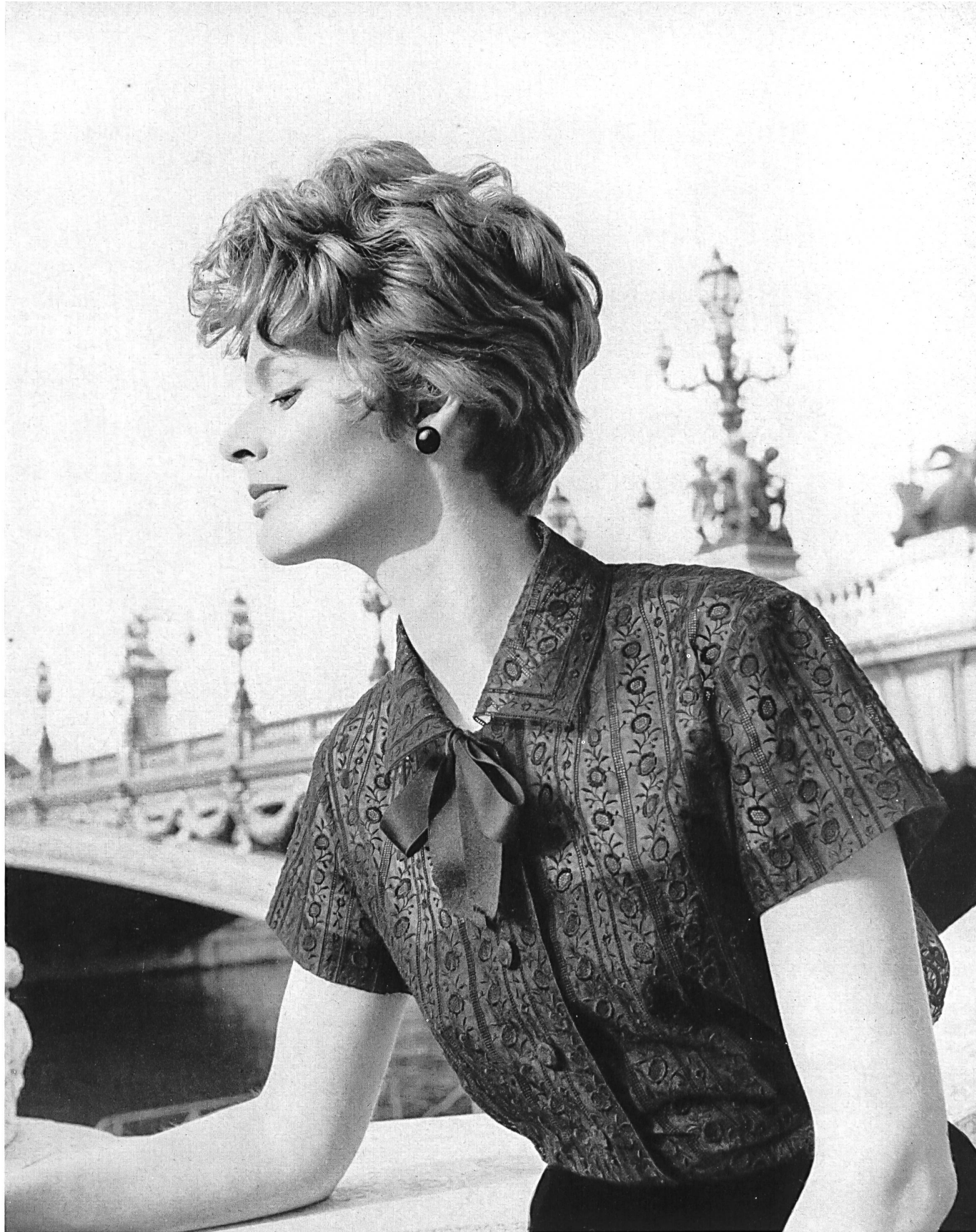
CHRISTIAN DIOR (Boutique) Organdi de soie noir brodé de Union S. A., Saint-Gall