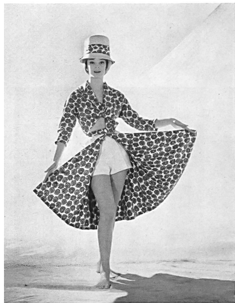
A. BLUM & CO, ZURICH

Beach outfit Tissu / fabric / tejido / Gewebe : Schweiz. Decken- & Tuch- fabriken Pfungen-Turben- thal A.-G., Pfungen