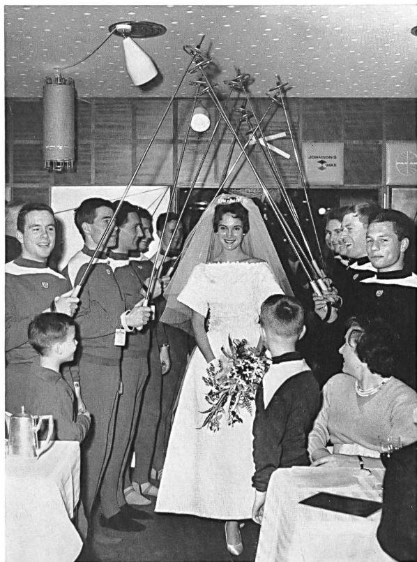
MISS AMERICA 1960: LINDA LEE MEAD