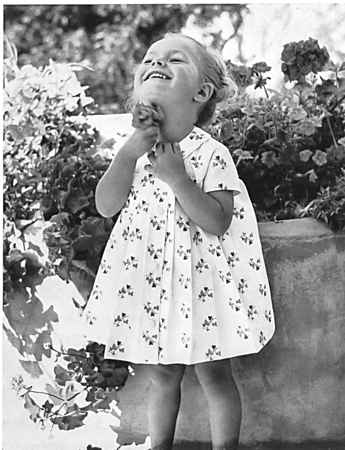
JACOB ROHNER S. A., REBSTEIN