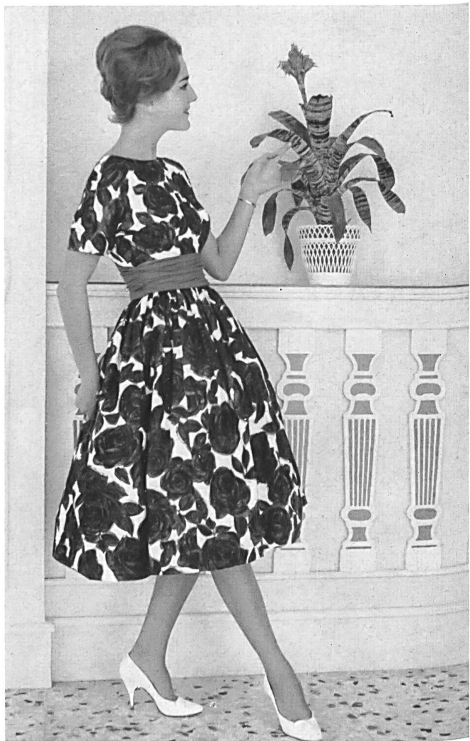
HEER & CIE S. A., THALWIL « Sarabande », coton imprimé Grossiste à Paris: Robert Burg & Cie Modèle Y. Dubois, Nice