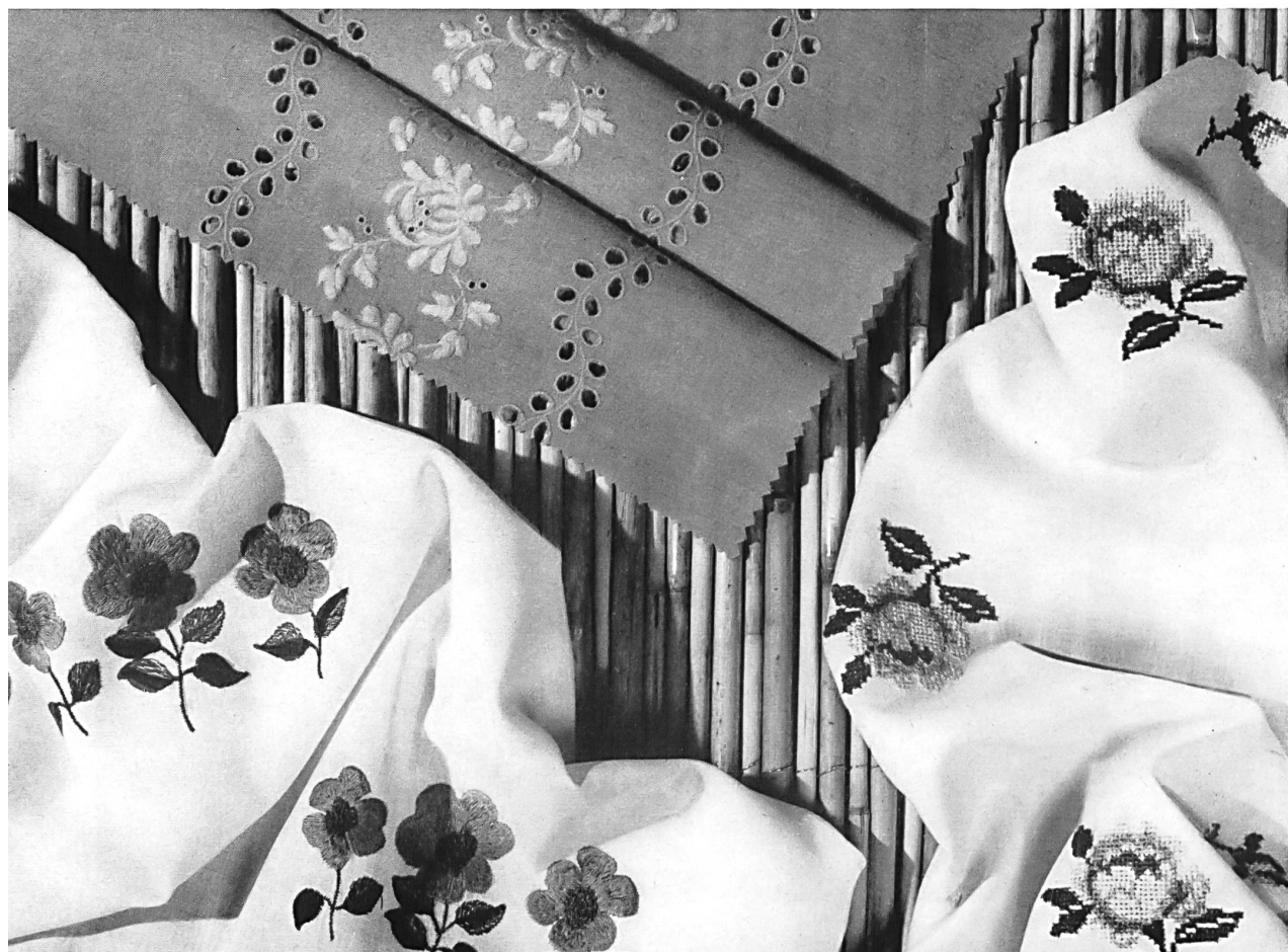
JAKOB SCHLAEPFER, SAINT-GALL

Tissu de dralon avec broderie dralon de même teinte. — Tissus dralon avec broderie multicolore en coton Dralon fabric with dralon embroidery in the same shade. — Dralon fabrics with multicoloured cotton embroidery Tejido de dralón bordado con dralón en el mismo color. — Tejidos de dralón con bordados multicolor de algodón Dralongewebe mit Dralonstickerei in derselben Farbe. — Bunte Baumwollstickereien auf Dralongeweben