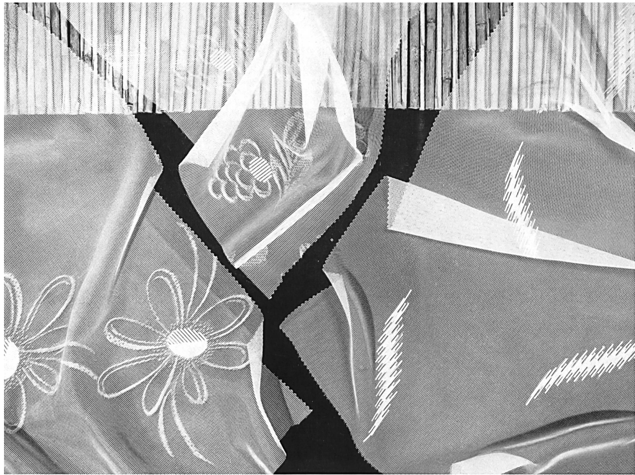
FILTEX S. A., SAINT-GALL

Marquiseite fantaisie nouveauté en térylène avec effets de fils coupés Fashionable terylene fancy marquiseite with clip-cord effects Marquiseita fantasía de novedad en terylene con efectos de vainica Neuartige Terylene-Fantasia-Marquiseite mit Scherli-Effekt