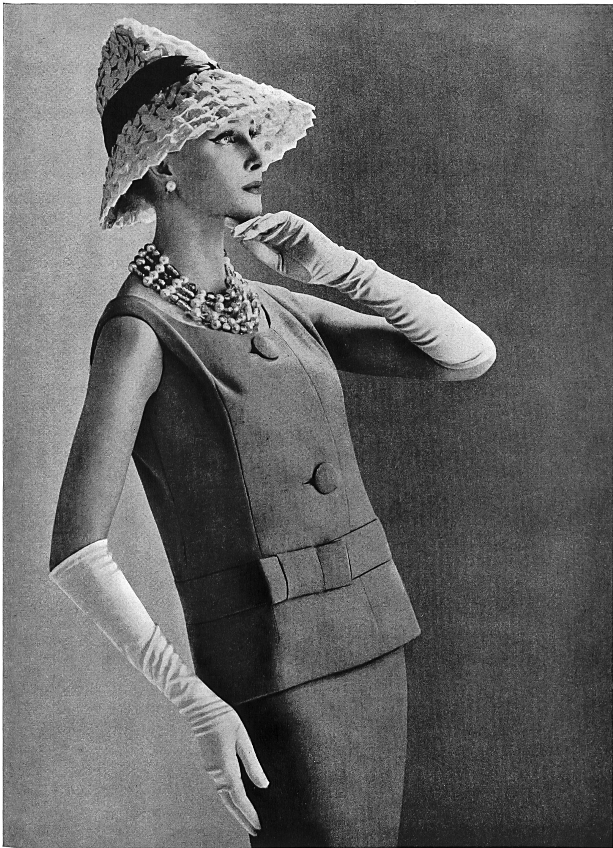
PIERRE CARDIN Tissu « Lascara » de Weisbrod-Zurrer Fils, Hausen s. A.

Pour certains de nos lecteurs, nous reproduisons sur ces pages encore quelques modèles des collections d'été 1960