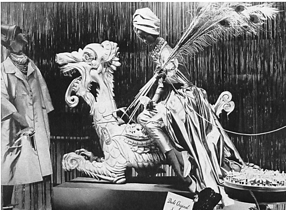
La vitrine du magasin de Lilly Daché à New York The window display of the Lilly Daché shop in New York