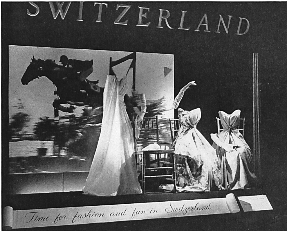
Office National Suisse du Tourisme La vitrine du bureau des Chemins de fer suisses à New York Swiss National Tourist Office The window display at the Swiss Federal Railroads Office in New York

From left to right, the three long evening gowns are