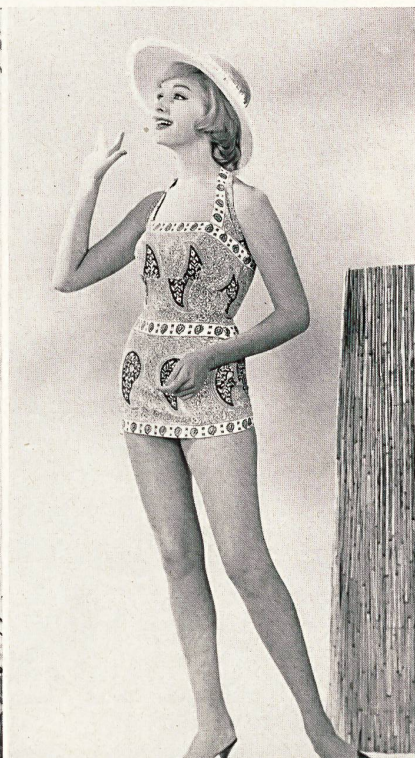
MYLORD S. A., CHATEL-SAINT-DENIS

Ensemble de loisirs en orlon « Hélanca »