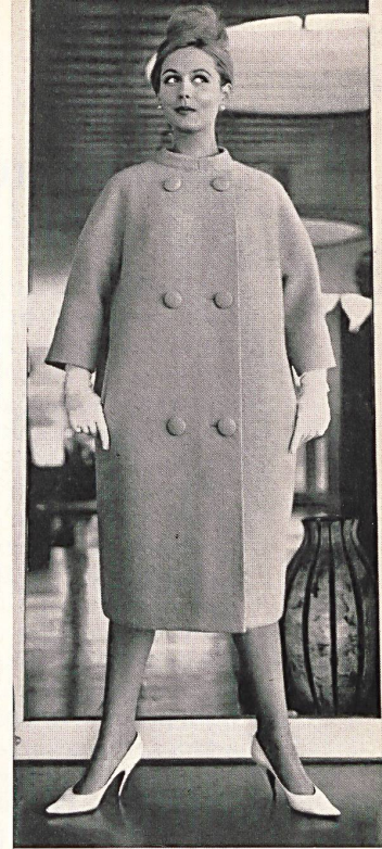
SCHMID A.G., GATTIKON Orlon/laine Modèle : Arthur Schibli S. A., Genève

Orlon/rayonne Modèle : Brüllmann & Co., Zurich