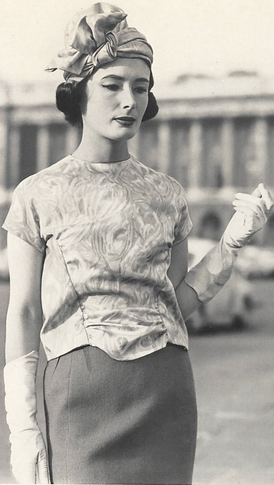
CARVEN « Aquarelle » twill pure soie de Bégé S. A., Zurich, succ. de Berthold Guggenheim Fils & Cie