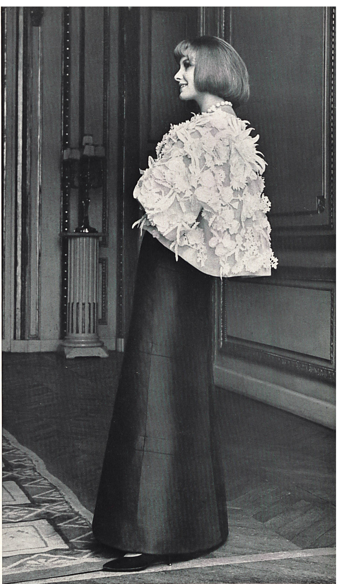
CHRISTIAN DIOR Cape en broderie superposée de A. Naef & Cie S. A., Flawil