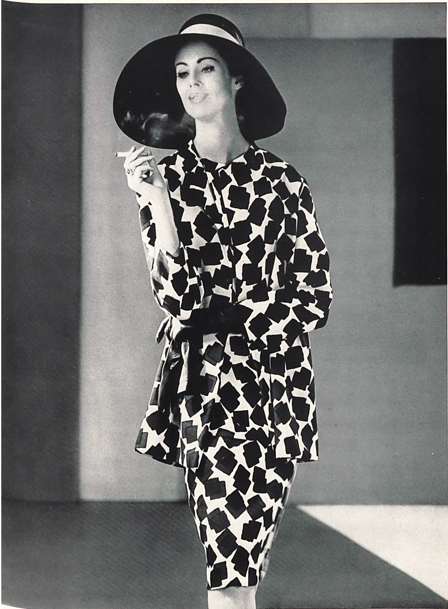
NINA RICCI Crêpe « Corico » imprimé de L. Abraham & Cie, Soieries S. A., Zurich