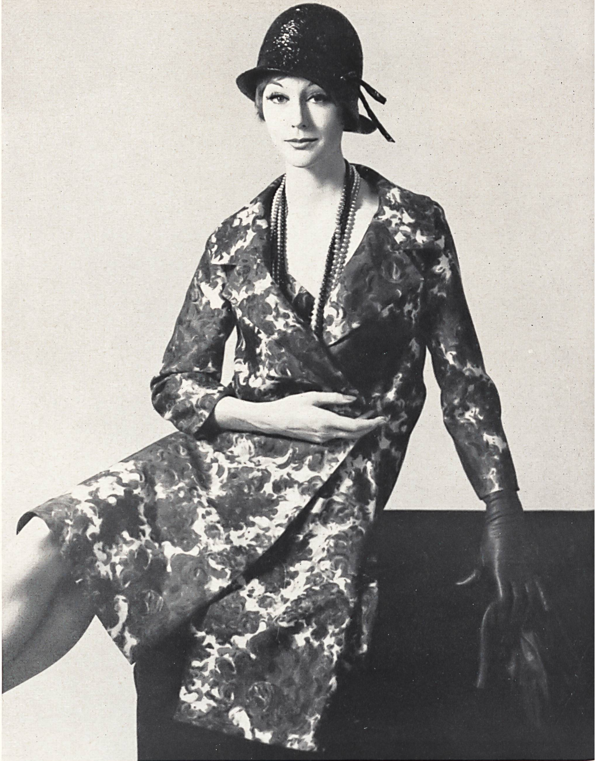
NINA RICCI Impression main sur soie « Manina » de Robt. Schwarzenbach & Co., Thalwil