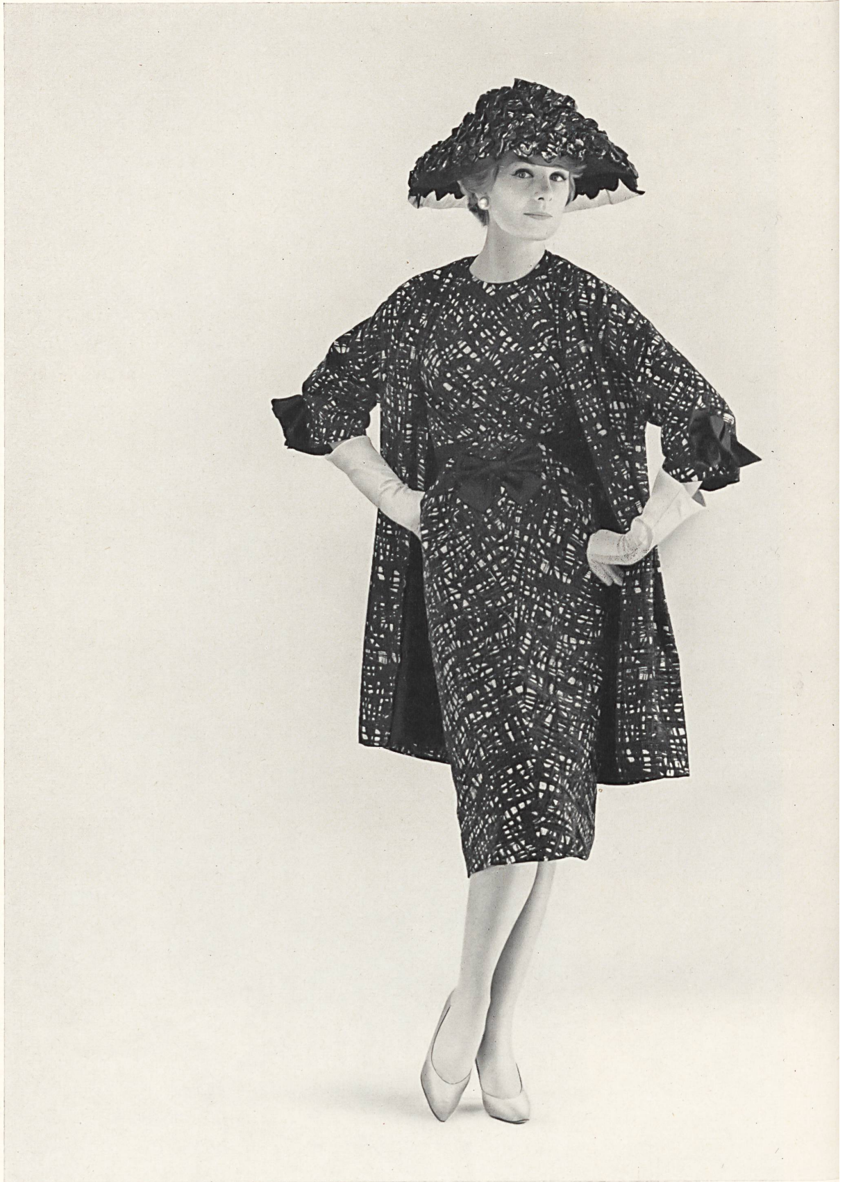
PIERRE BALMAIN Crêpe suprême imprimé de Rudolf Brauchbar & Cie S.A., Zurich Distribué par Montex, Paris