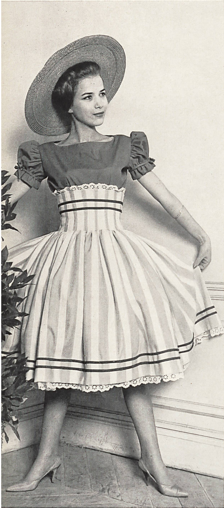
JACQUES ESTEREL «Recosablé» Minicare de Reichenbach & Co., Saint-Gall Distribué par Montex, Paris