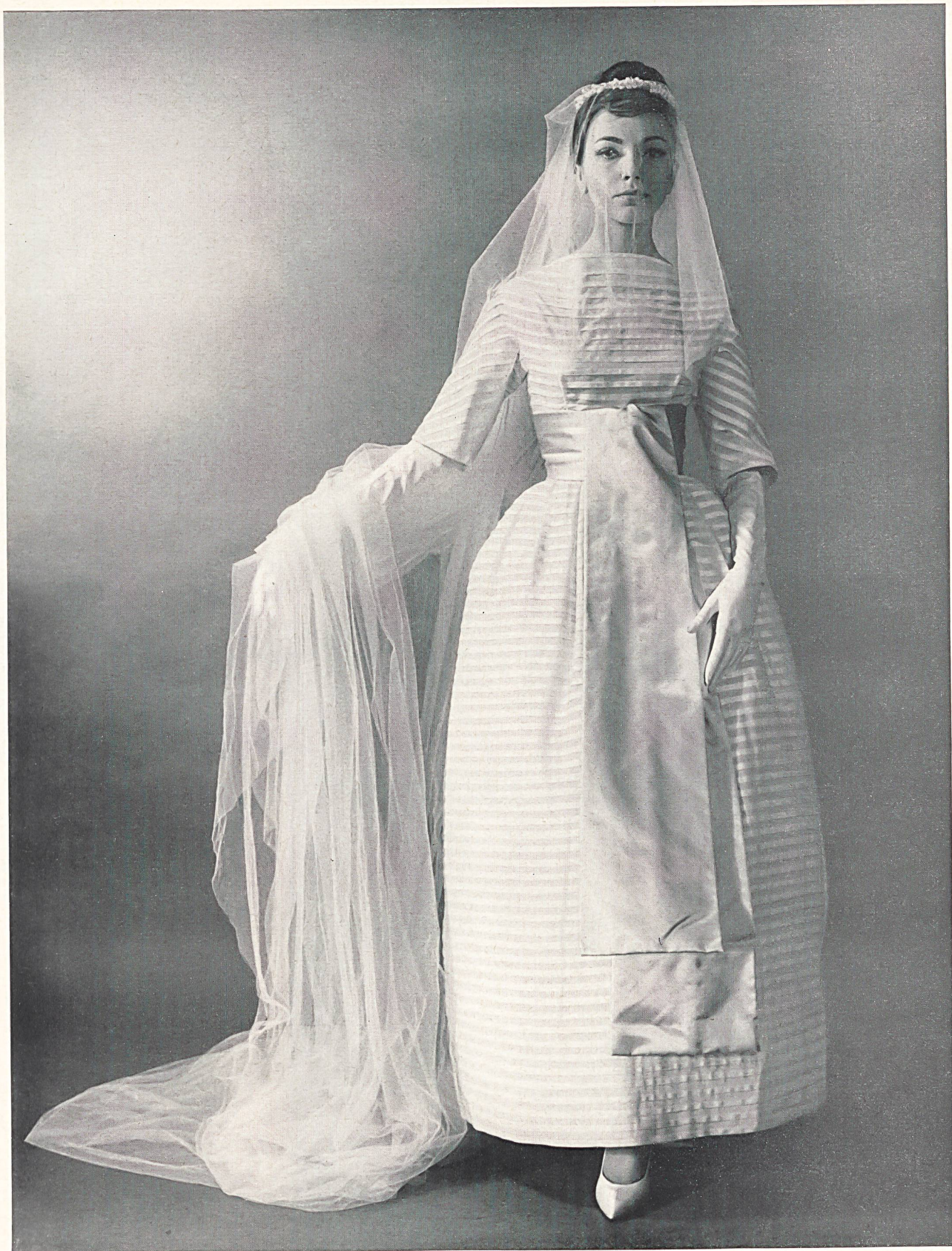
JACQUES HEIM Batiste plissée de Reichenbach & Co., Saint-Gall Distribué par Montex, Paris