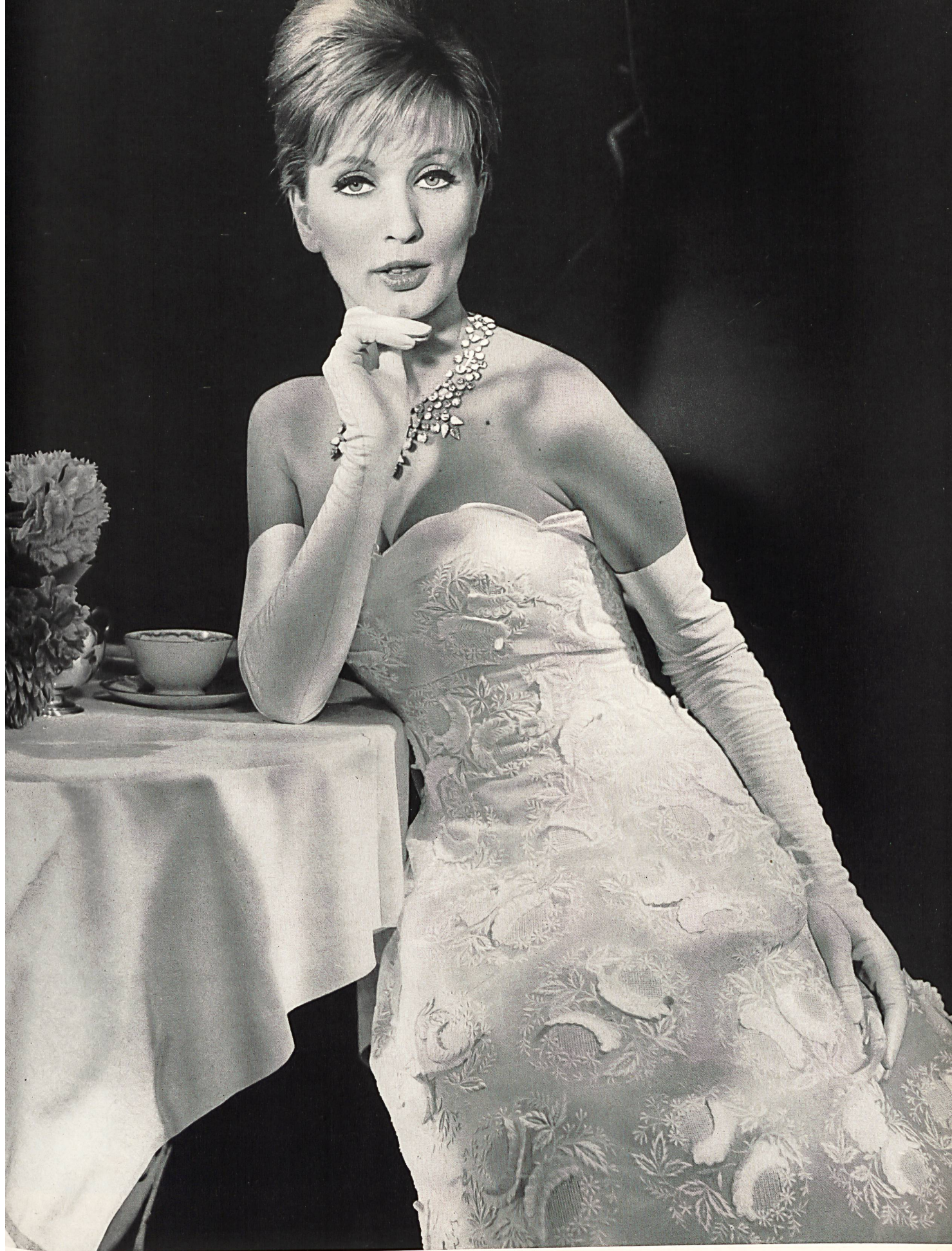
CARVEN Broderie appliquée sur organdi «Nelo» de J. G. Nef & Co. S. A., Herisau Grossiste à Paris: Robert Burg & Cie