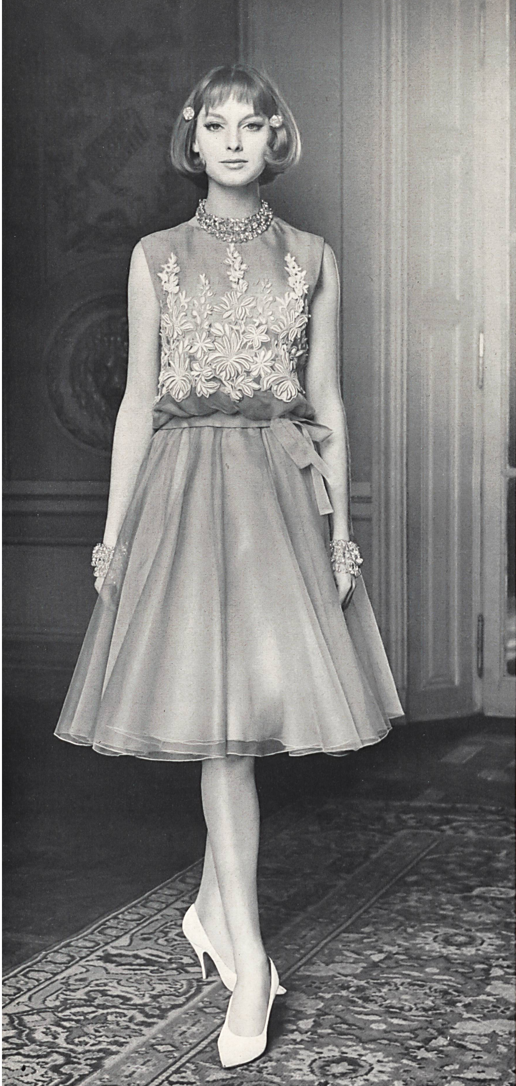
CHRISTIAN DIOR Laize de piqué avec fleurs détachées de Forster Willi & Co., Saint-Gall