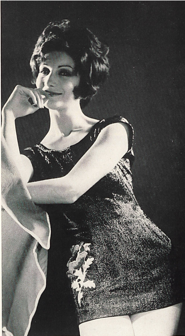
PIERRE CARDIN Motif brodé multicolore de Union S.A., Saint-Gall Grossiste à Paris: Robert Burg & Cie