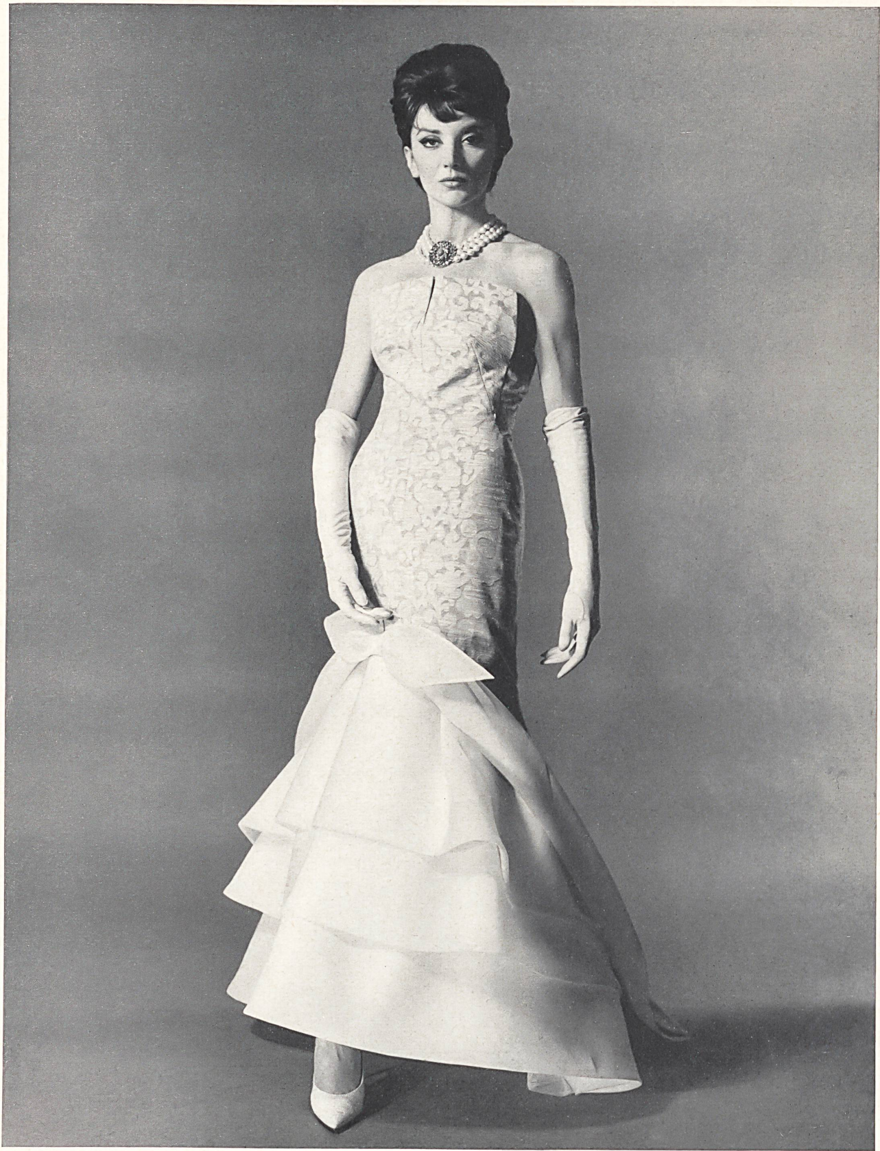
CARVEN Jacquard piqué de Reichenbach & Co., Saint-Gall Distribué par Montex, Paris