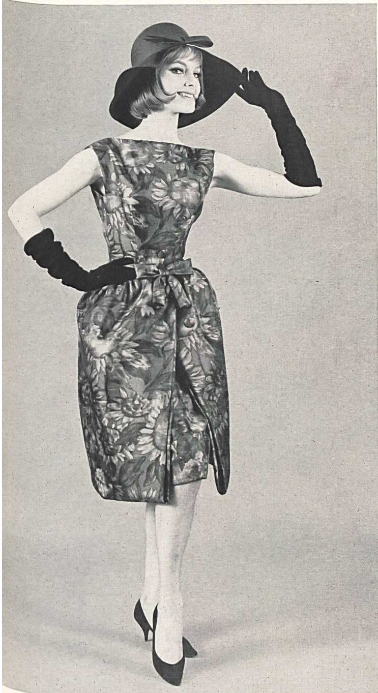
BOB BUGNAND « Olympic » pure soie de Rudolf Brauchbar & Cie S. A., Zurich Distribué par Montex, Paris