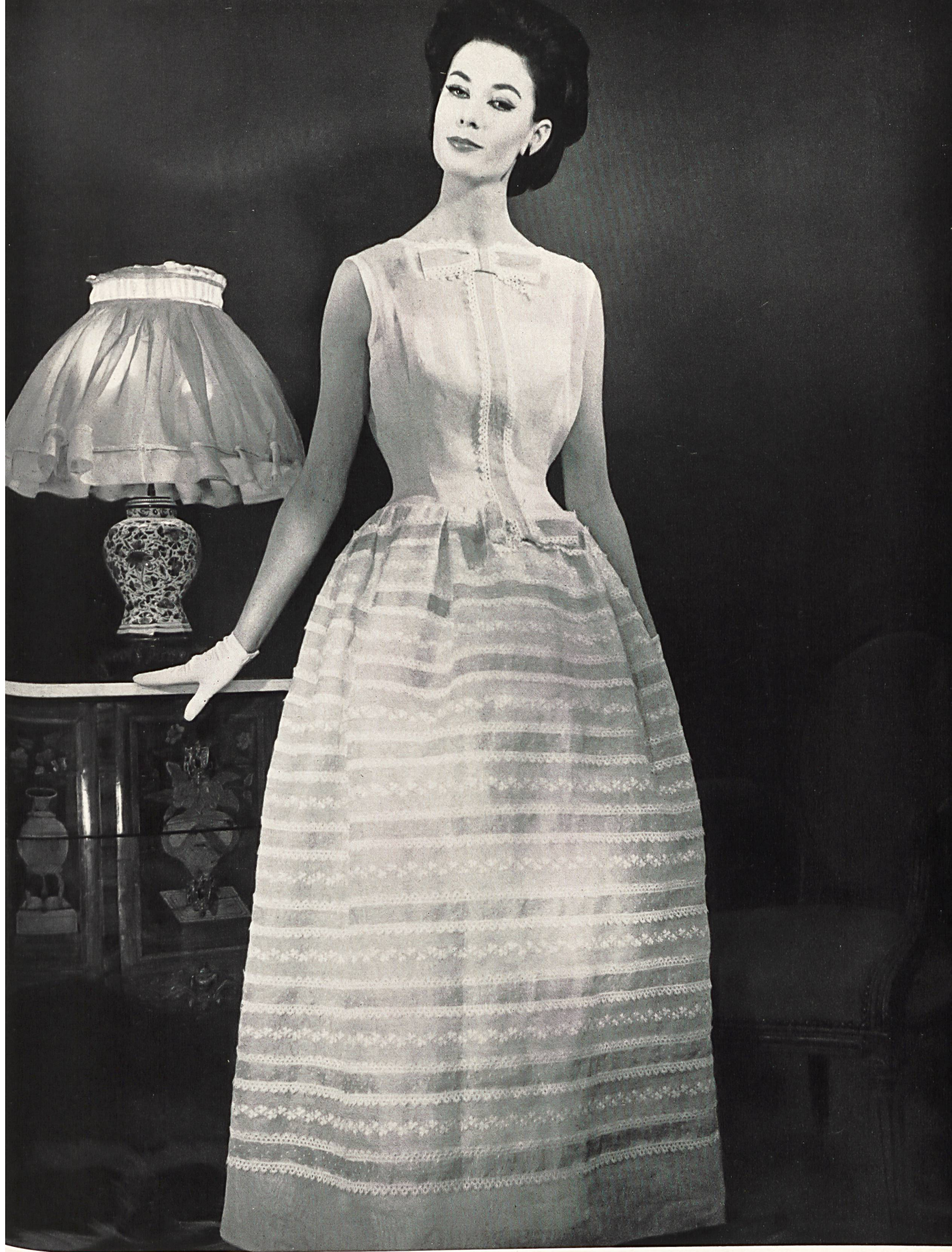
JEAN PATOU Organdi brodé avec guipure de Forster Willi & Co., Saint-Gall Grossiste à Paris: Robert Burg & Cie