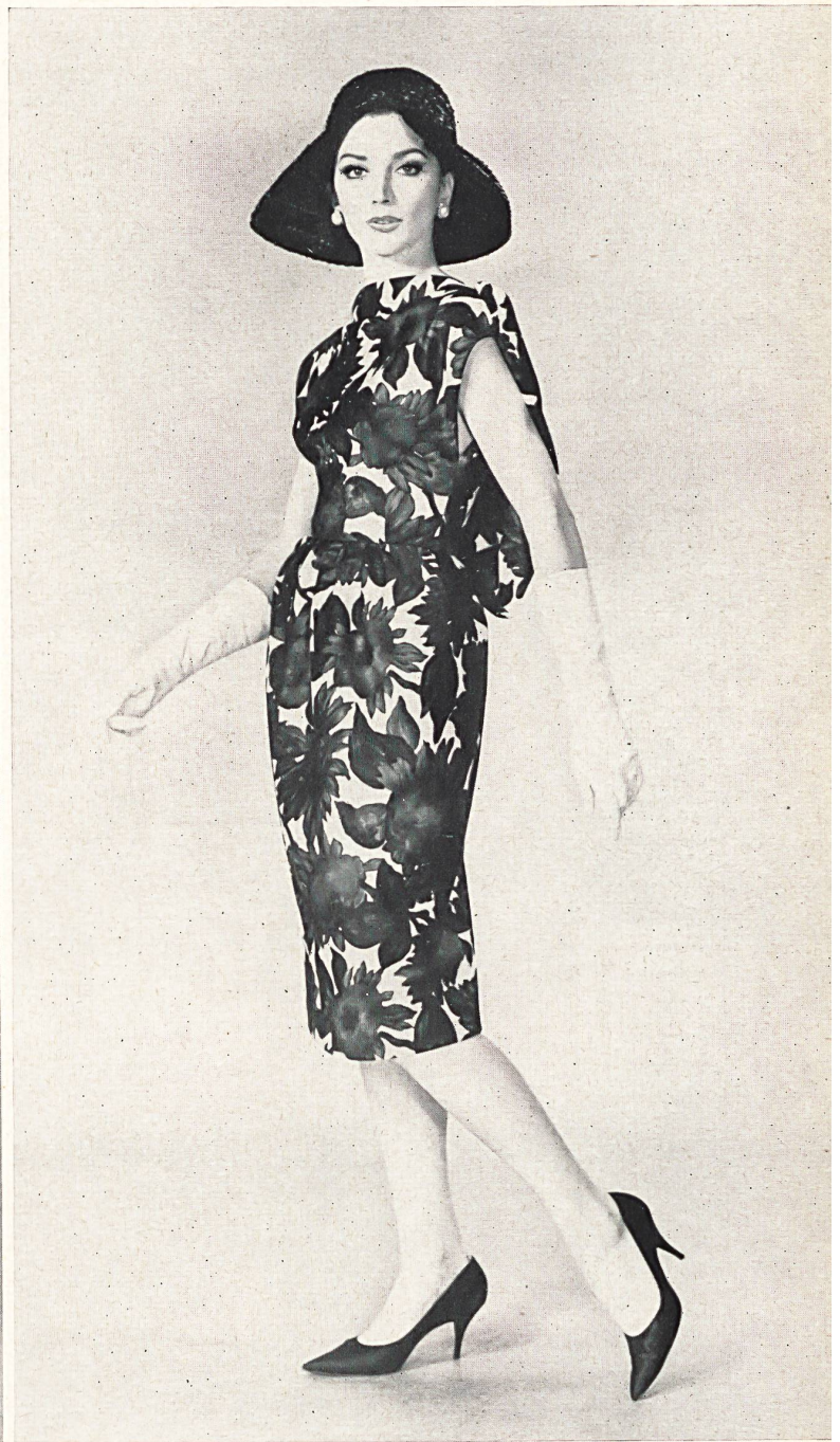
BOB BUGNAND « Corniche » imprimé de Rudolf Brauchbar & Cie S. A., Zurich Distribué par Montex, Paris