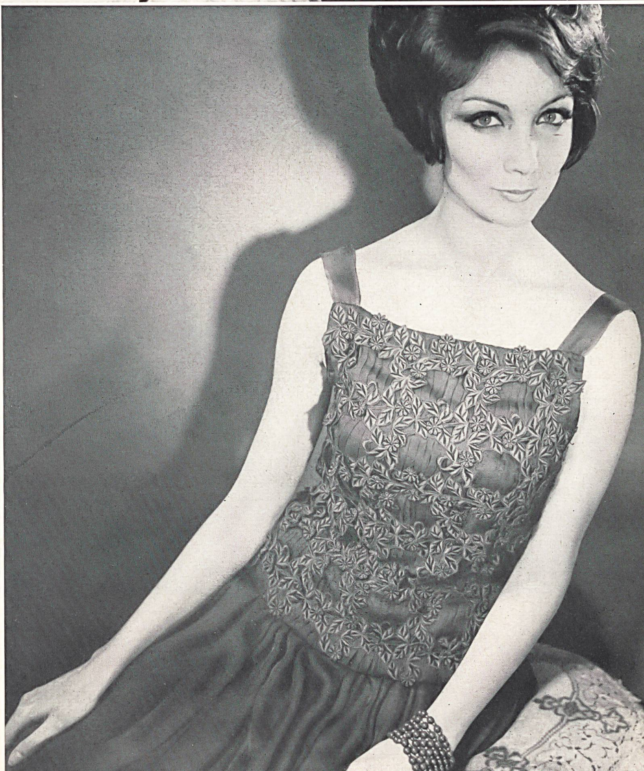
BERNARD SAGARDOY Dentelle gros relief avec fleurs superposées de Walter Schrank & Co. S.A., Saint-Gall Grossiste à Paris : Robert Burg & Cie