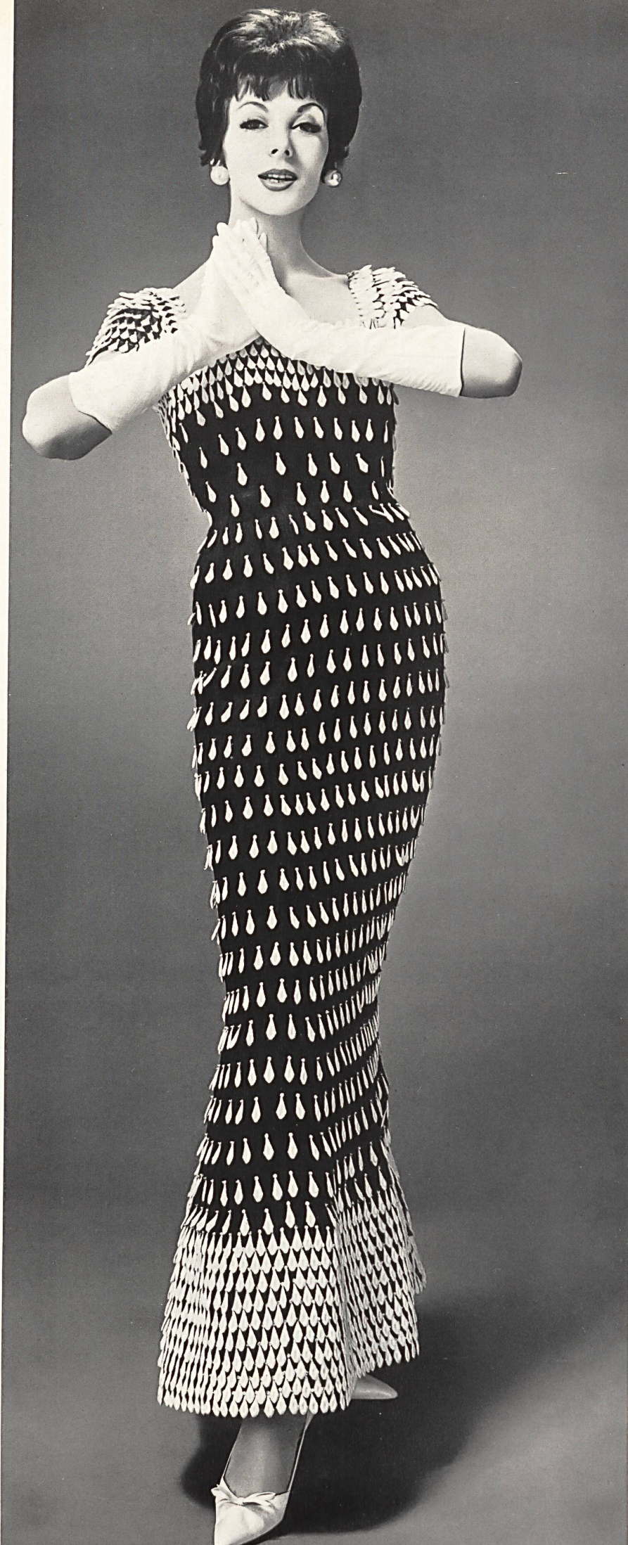
LANVIN CASTILLO