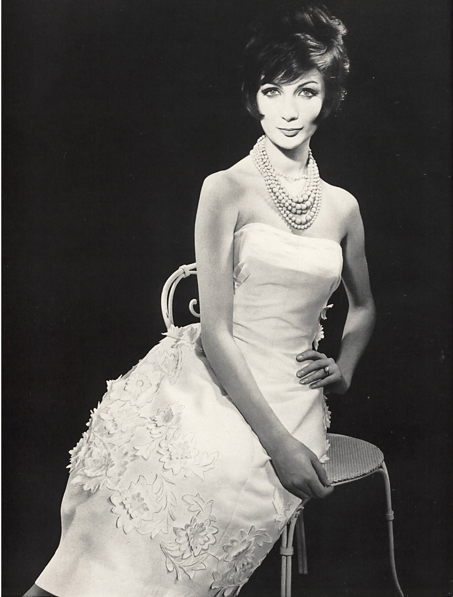
CARVEN Broderie appliquée sur piqué «Nelo» de J.G. Nef & Co. S.A., Herisau Grossiste à Paris: Robert Burg & Cie