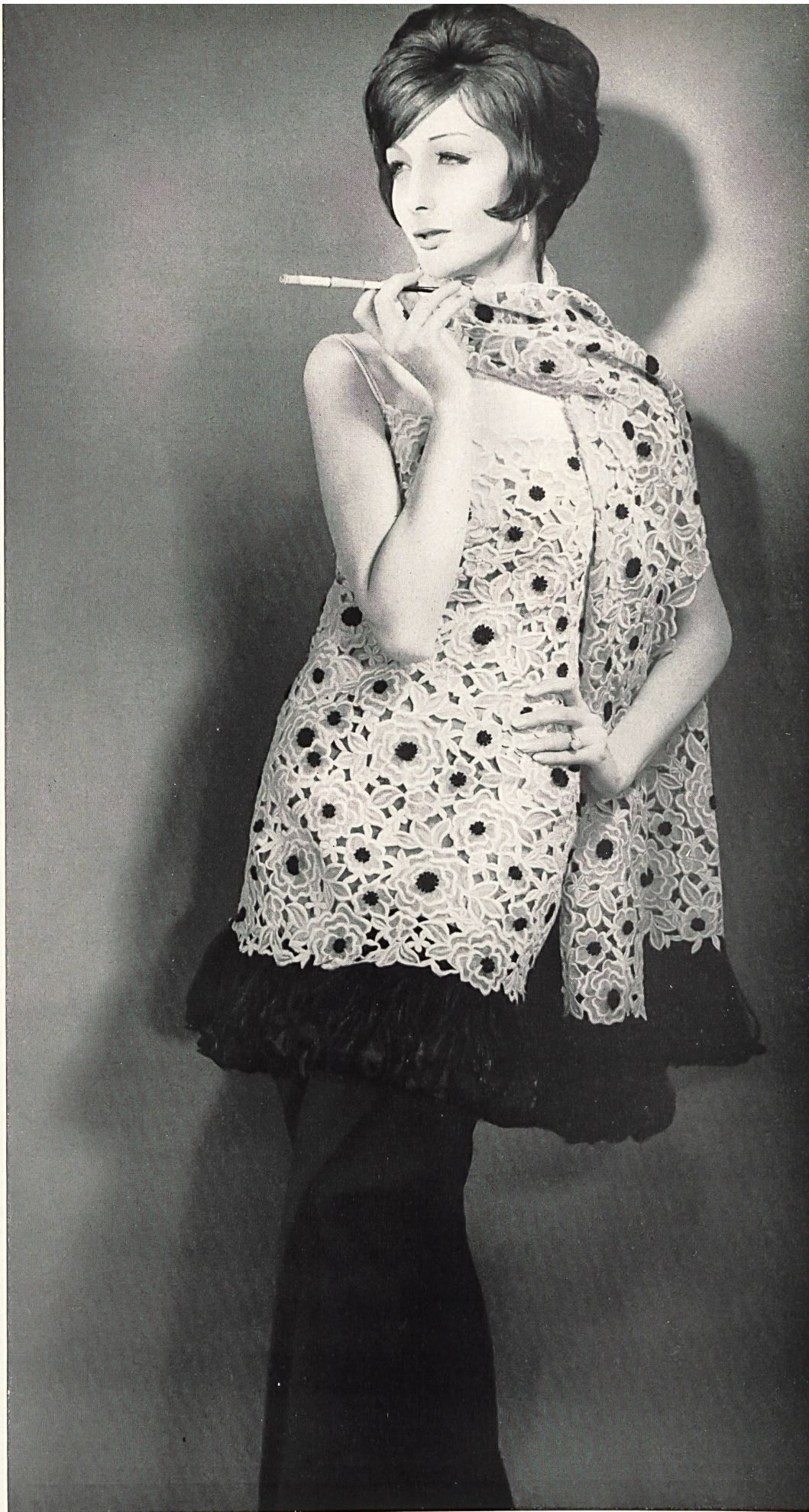
NINA RICCI Laize d'organdi brodé à motifs superposés de Union S.A., Saint-Gall Grossiste à Paris: Robert Burg & Cie