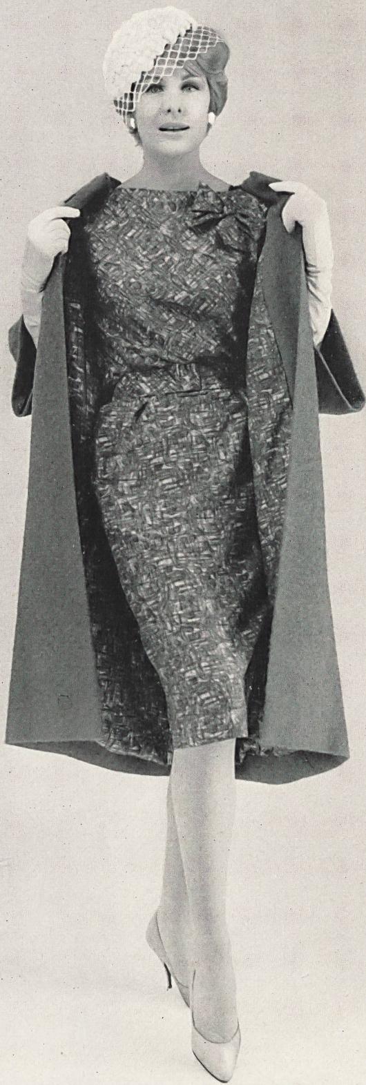
PIERRE BALMAIN « Luanda » imprimé de Rudolf Brauchbar & Cie S. A., Zurich Distribué par Montex, Paris