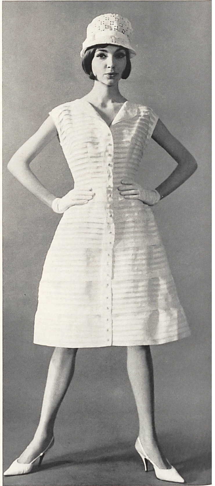
CARVEN Percalé plissé de Reichenbach & Co., Saint-Gall Distribué par Montex, Paris