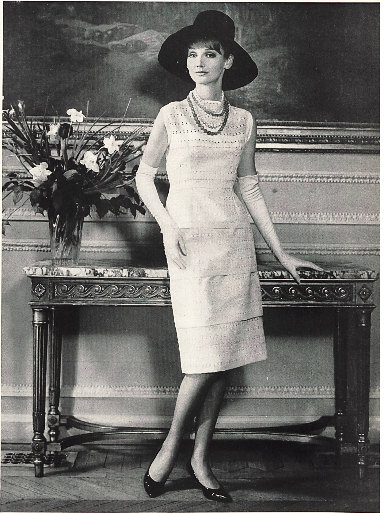
CARVEN Batiste Minicare de Reichenbach & Co., Saint-Gall Distribué par Montex, Paris