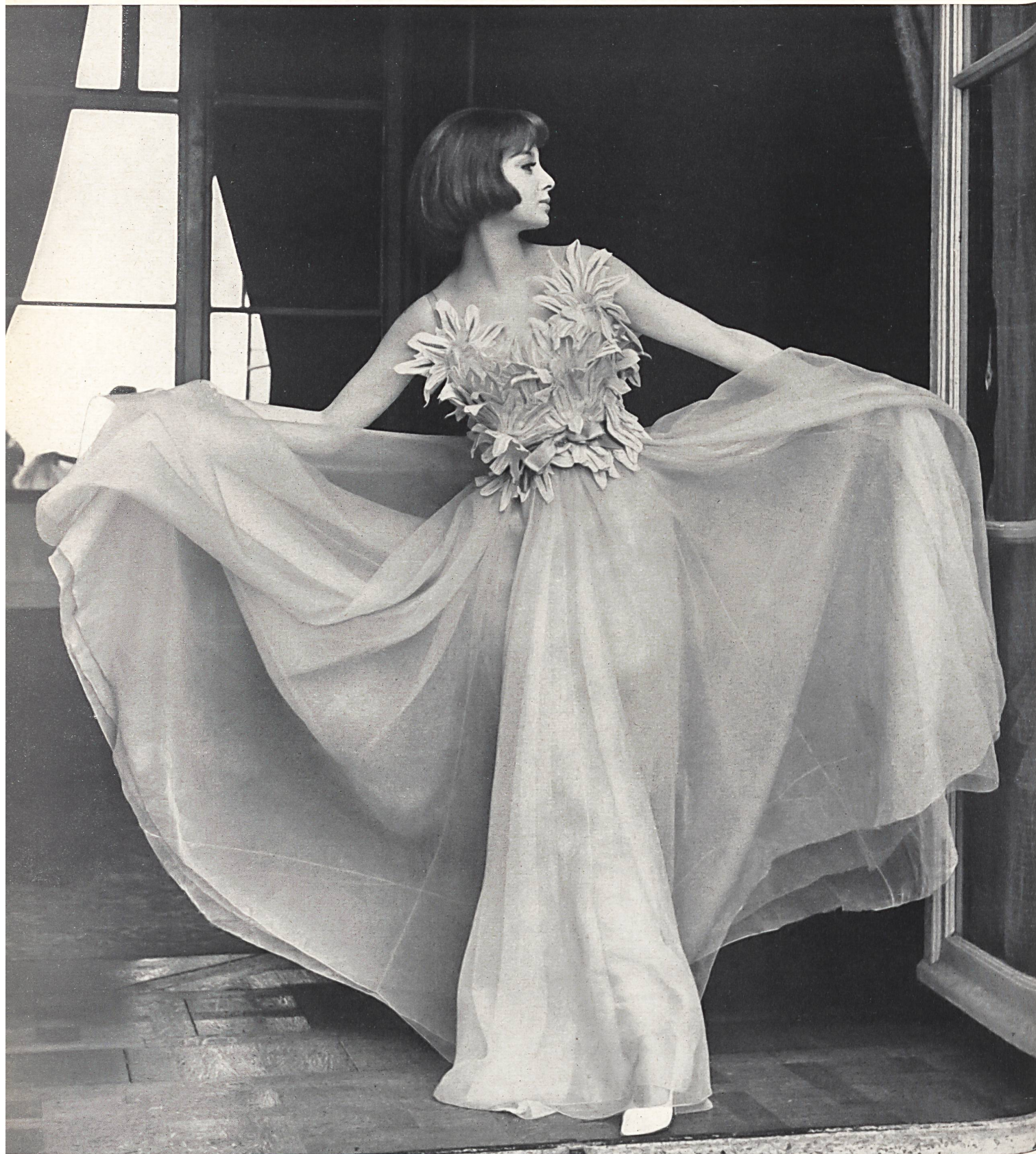
CHRISTIAN DIOR Guipure riche de A. Naef & Cie S.A., Flawil

MODÈLES EXCLUSIFS — REPRODUCTION INTERDITE