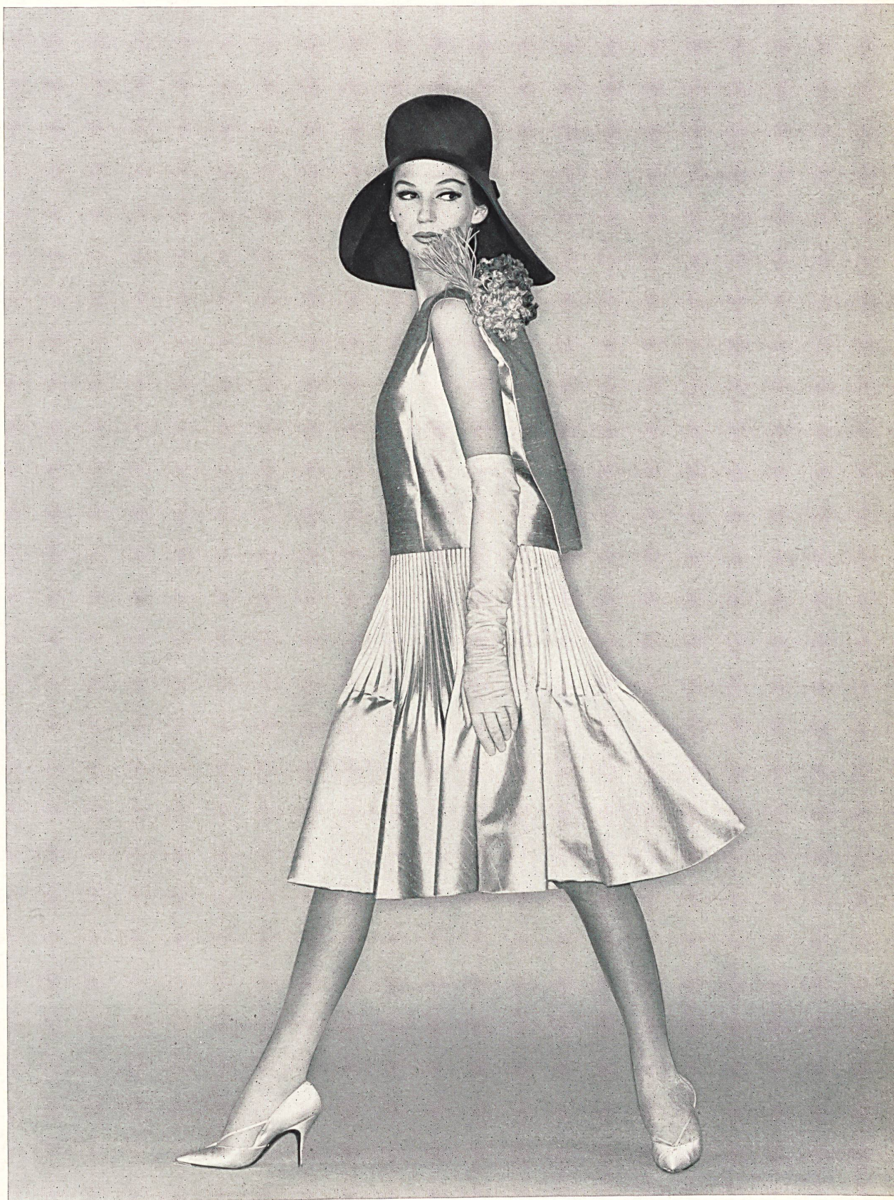
PIERRE CARDIN Shantung pure soie « Tivoli » de Robt. Schwarzenbach & Co., Thalwil