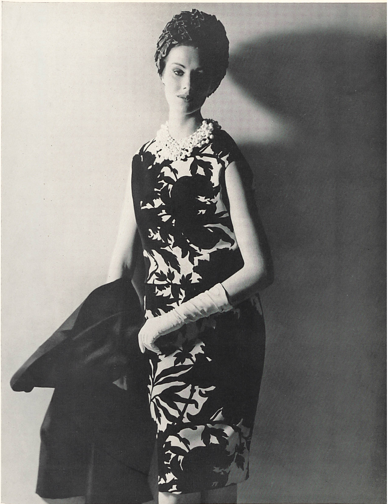
CHRISTIAN DIOR Crêpe « Corico » imprimé de L. Abraham & Cie, Soieries S. A., Zurich