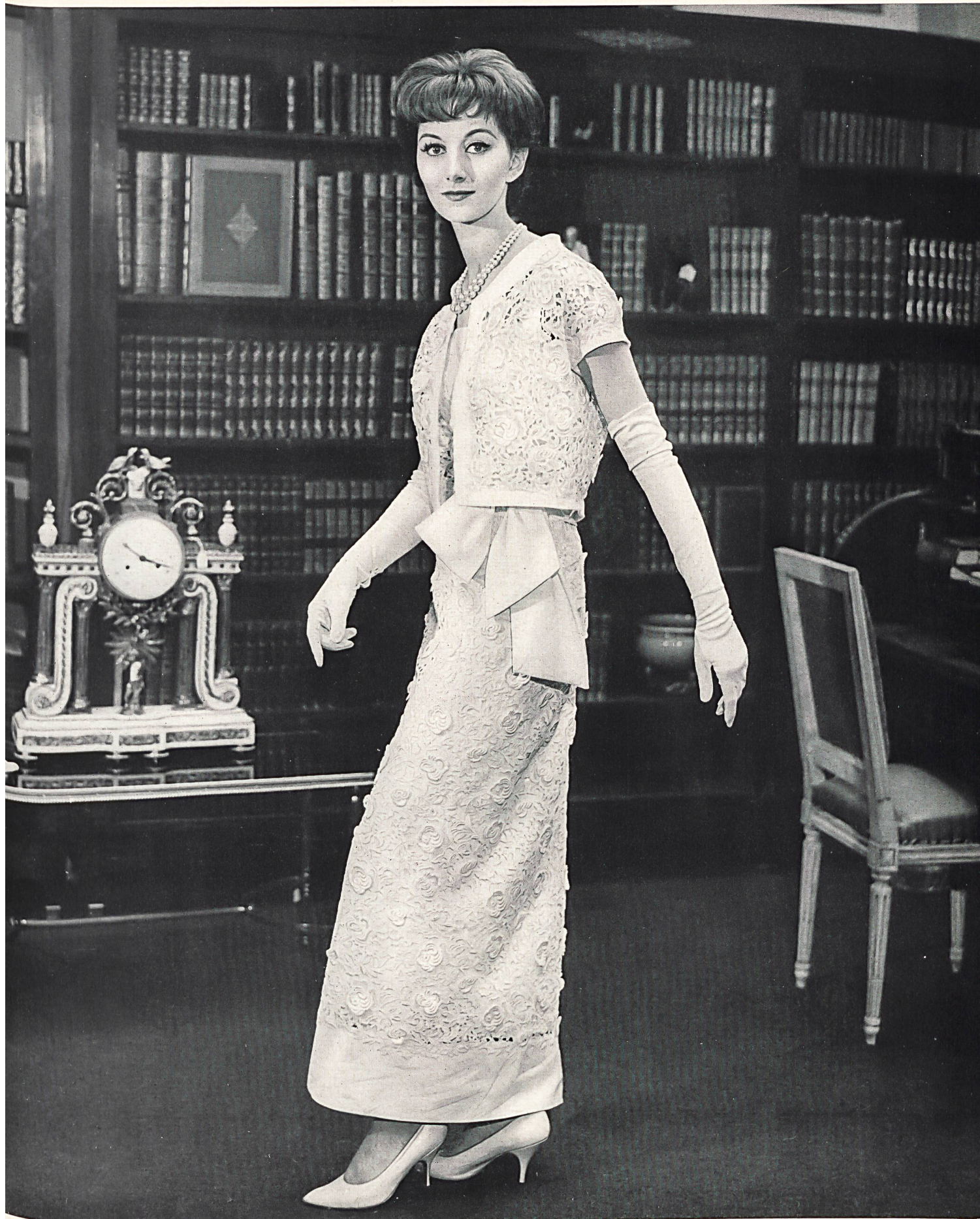
PIERRE BALMAIN Guipure riche de Forster Willi & Co., Saint-Gall Grossiste à Paris: Pierre Brivet S. à r. l.