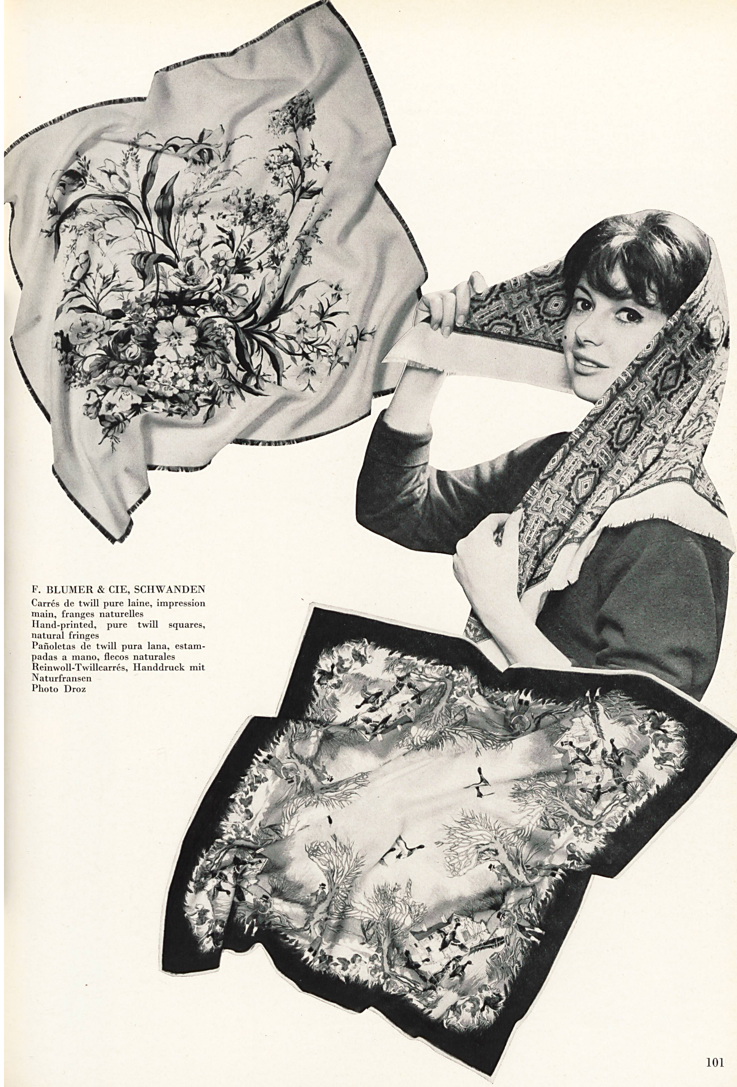
F. BLUMER & CIE, SCHWANDEN Carrés de twill pure laine, impression main, franges naturelles Hand-printed, pure twill squares, natural fringes Pañoletas de twill pura lana, estam- padas a mano, flecos naturales Reinwooll-Twillcarrés, Handdruck mit Naturfransen