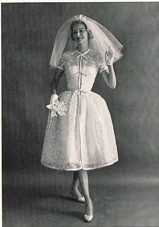
Page 124: Cette robe est en broderie d'UNION S.A. SAINT-GALL et non de Forster Willi & Co. Saint-Gall.