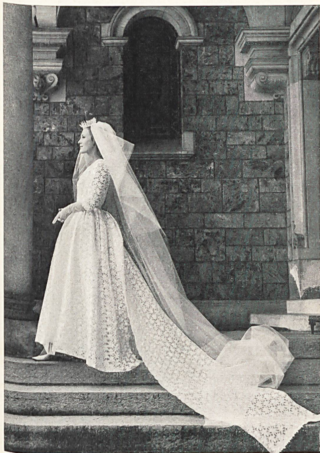
Page 93: Cette robe en « BAN-LON »-Nylsuisse est en broderie de JACOB ROHNER S.A. REB-STEIN et non de Forster Willi & Co. Saint-Gall.