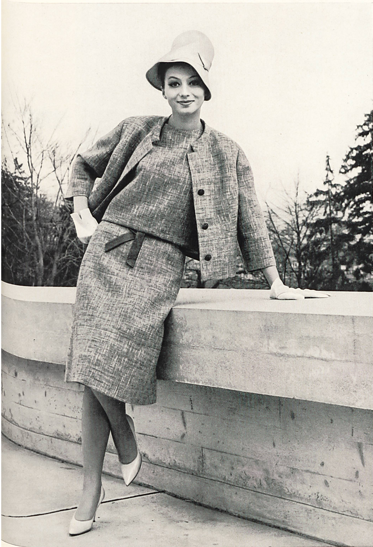
BEBLO S.A., BALE Photo Tenca