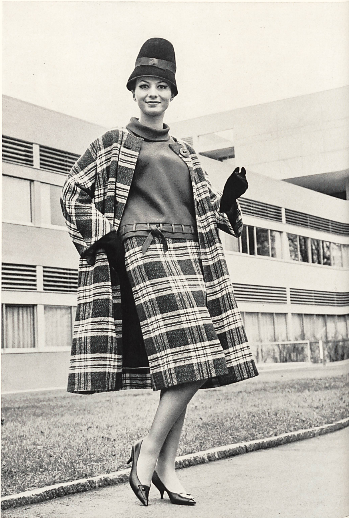
BEBLO S.A., BALE Photo Tenca