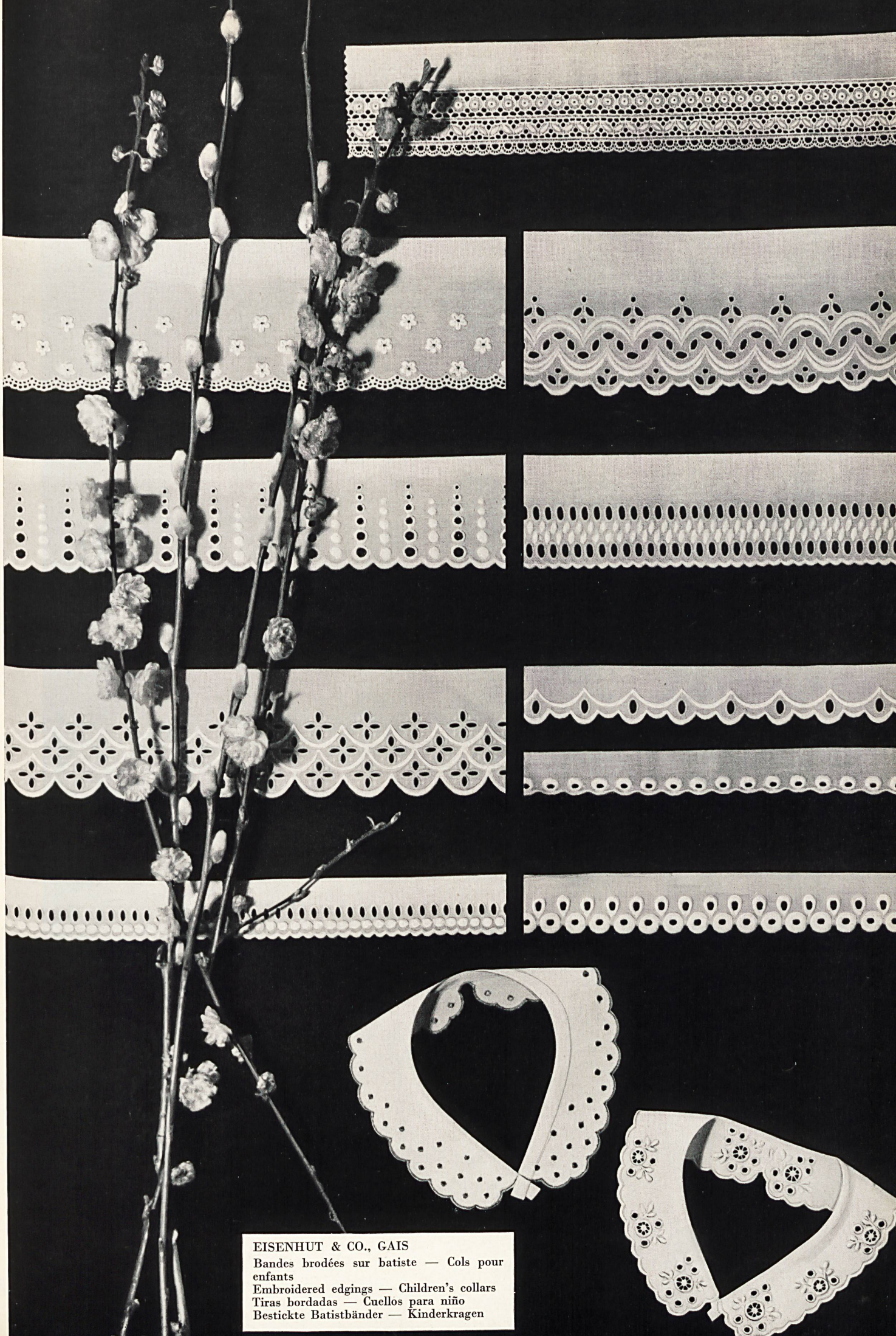
EISENHUT & CO., GAIS Bandes brodées sur batiste — Cols pour enfants Embroidered edgings — Children's collars Tiras bordadas — Cuellos para niño Bestickte Batistbänder — Kinderkragen