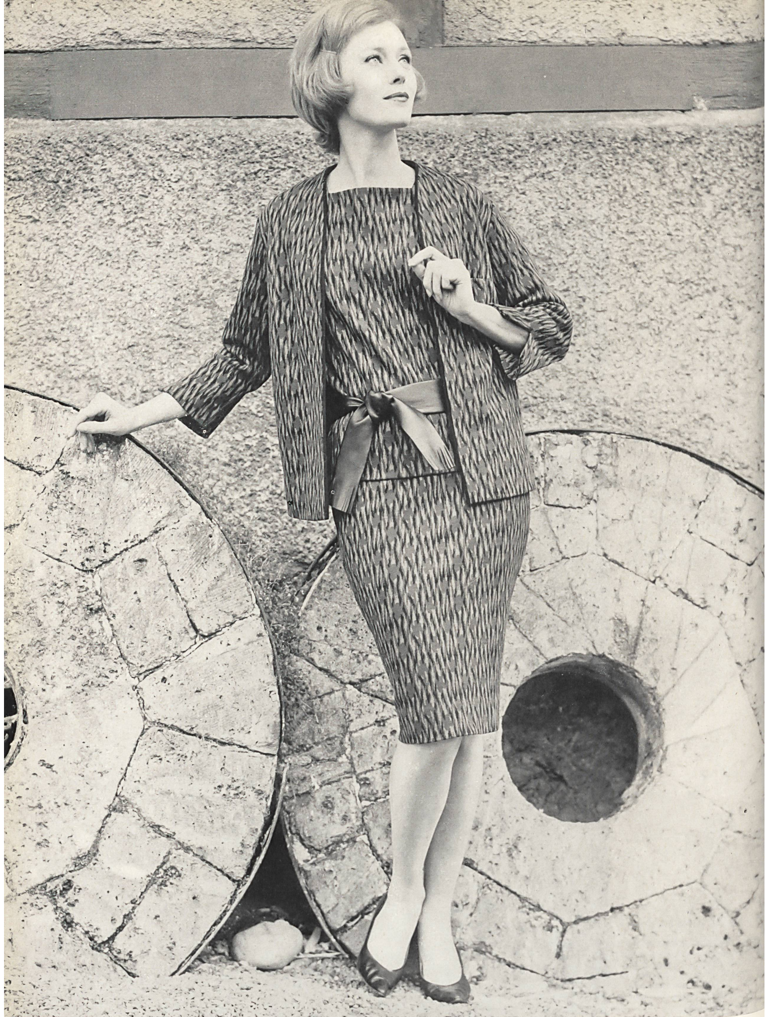
« STREBA », JOHANN MULLER S. A., WOHLLEN

Trois pièces en wevenit jacquard nouveau semblable à un imprimé sur soie; la ceinture de cuir nouée souligne la sobriété de l'ensemble • New Jacquard wevenit three-piece outfit, resembling a printed silk; the tied leather belt emphasizes the quite effect of the whole • Trois-pièces aus neuartigem Jacquard-Wevenit, der an bunten Seidendruck erinnert; der geschlungene Ledergürtel erhöht die betonte Schlichtheit des Ensembles