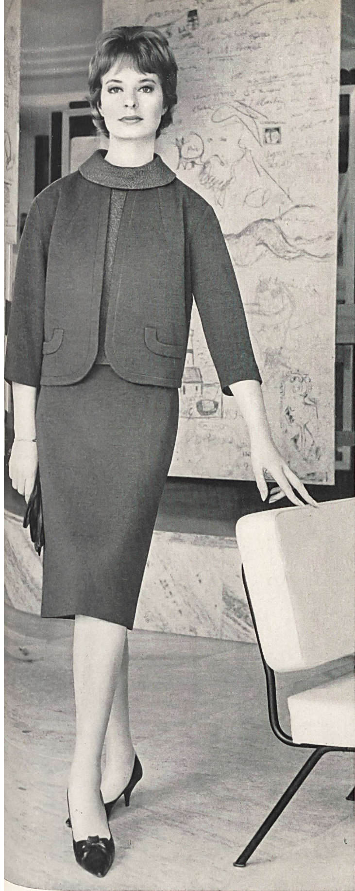
« HISCO », HIS & CO. S. A., MURGENTHAL

Trois-pièces juvénile en tricot de laine; pullover à dessin jacquard et col se portant par-dessus l'encolure de la jaquette droite • Youthful knitted woollen three-piece outfit; pullover with Jacquard design, the collar being worn over the neck of the straight jacket • Jungdliches Trois-pièces aus Wolltrikot mit gerader Jacke, Pullover im attraktiven Jacquard-Muster mit rundem Kragen über Jacke