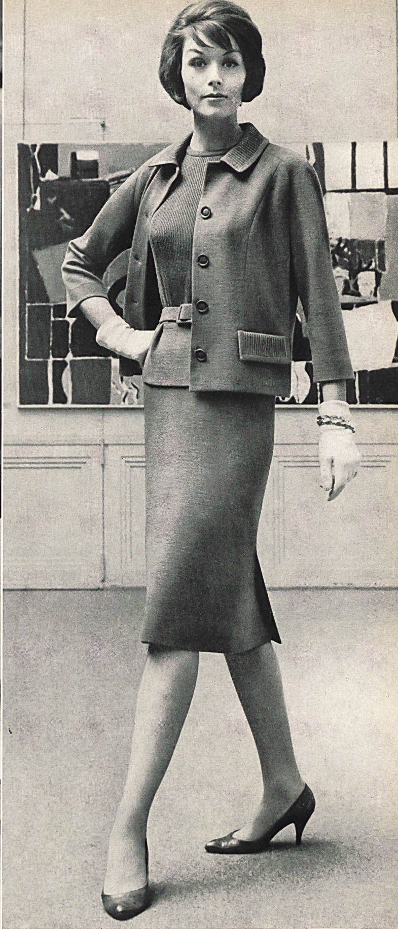
« HISCO », HIS & CO. S. A., MURGENTHAL

Trois-pièces juvénile en tricot de laine; pullover à dessin jacquard et col se portant par-dessus l'encolure de la jaquette droite • Youthful knitted woollen three-piece outfit; pullover with Jacquard design, the collar being worn over the neck of the straight jacket • Jungdliches Trois-pièces aus Wolltrikot mit gerader Jacke, Pullover im attraktiven Jacquard-Muster mit rundem Kragen über Jacke