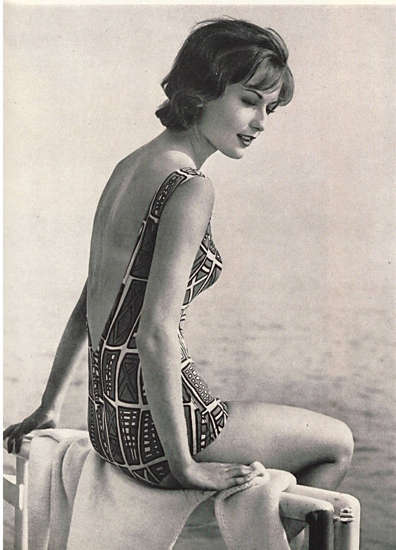
Maillot de bain en « Hélanca » profondément échancré en V dans le dos, avec soutien-gorge nylon incorporé « Hélanca » swimsuit with a low V back and built-in nylon brassiere Bañador de « Hélanca » muy escotado en forma de V en la espalda, con sostén de nylon fijo « Hélanca »-Badeanzug mit tiefem Rückendécolleté in V-Form und Nylon-Büsteneinlage