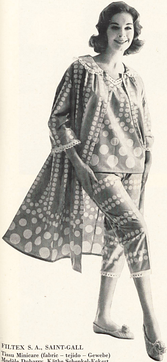
FILTEX S. A., SAINT-GALL Tissu Minicare (fabric - tejido - Gewebe) Modèle Dubarry, Käthe Schenkel-Eckert, Horn (Joseph Bancroft & Sons Co. A. G., Zurich)