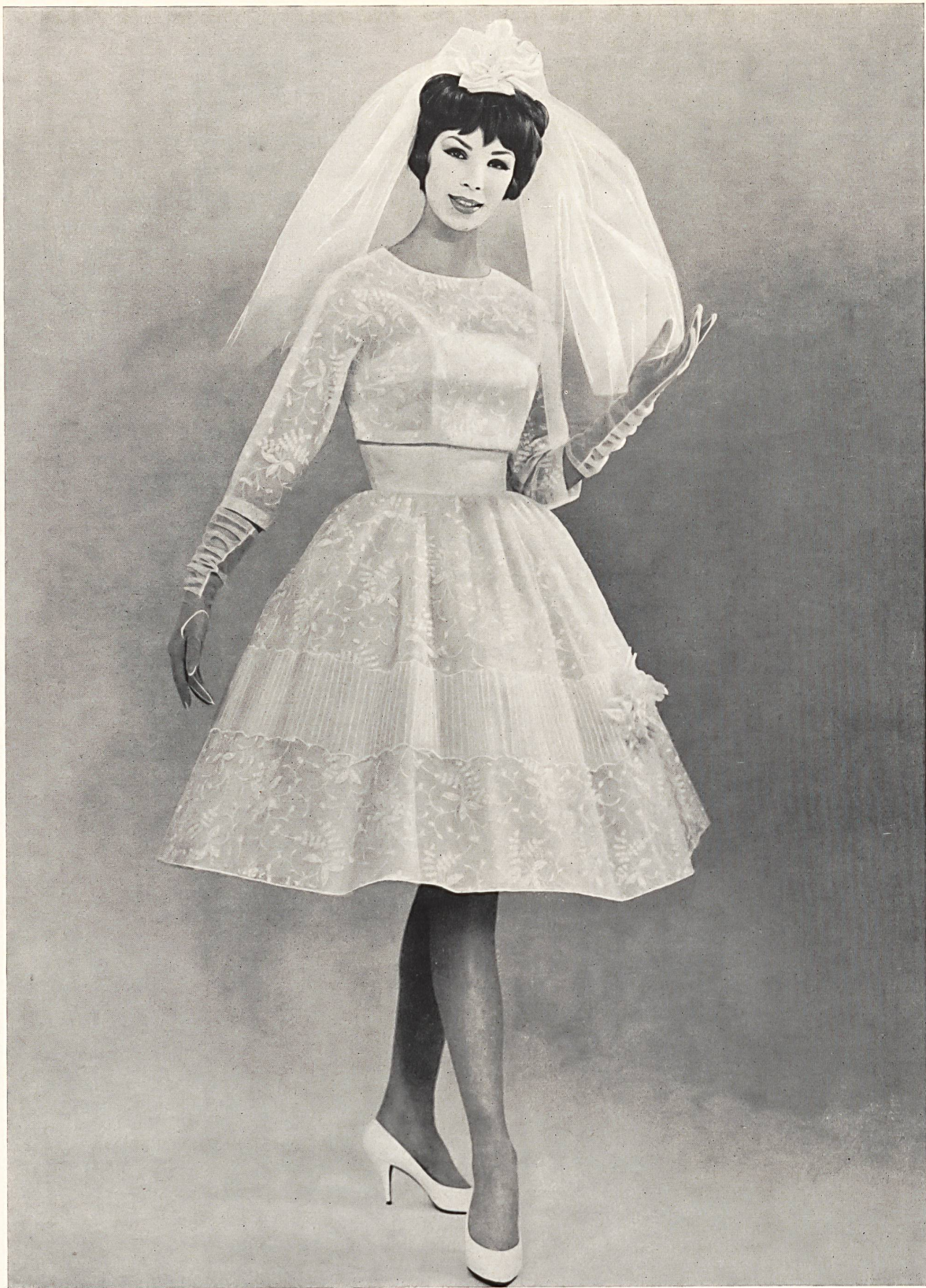
THEODOR LOCHER & CO., SAINT-GALL Tulle richement brodé Richly embroidered net Tul profusamente bordado Reichbestickter Tüll Modèle Maison Lis, Zurich