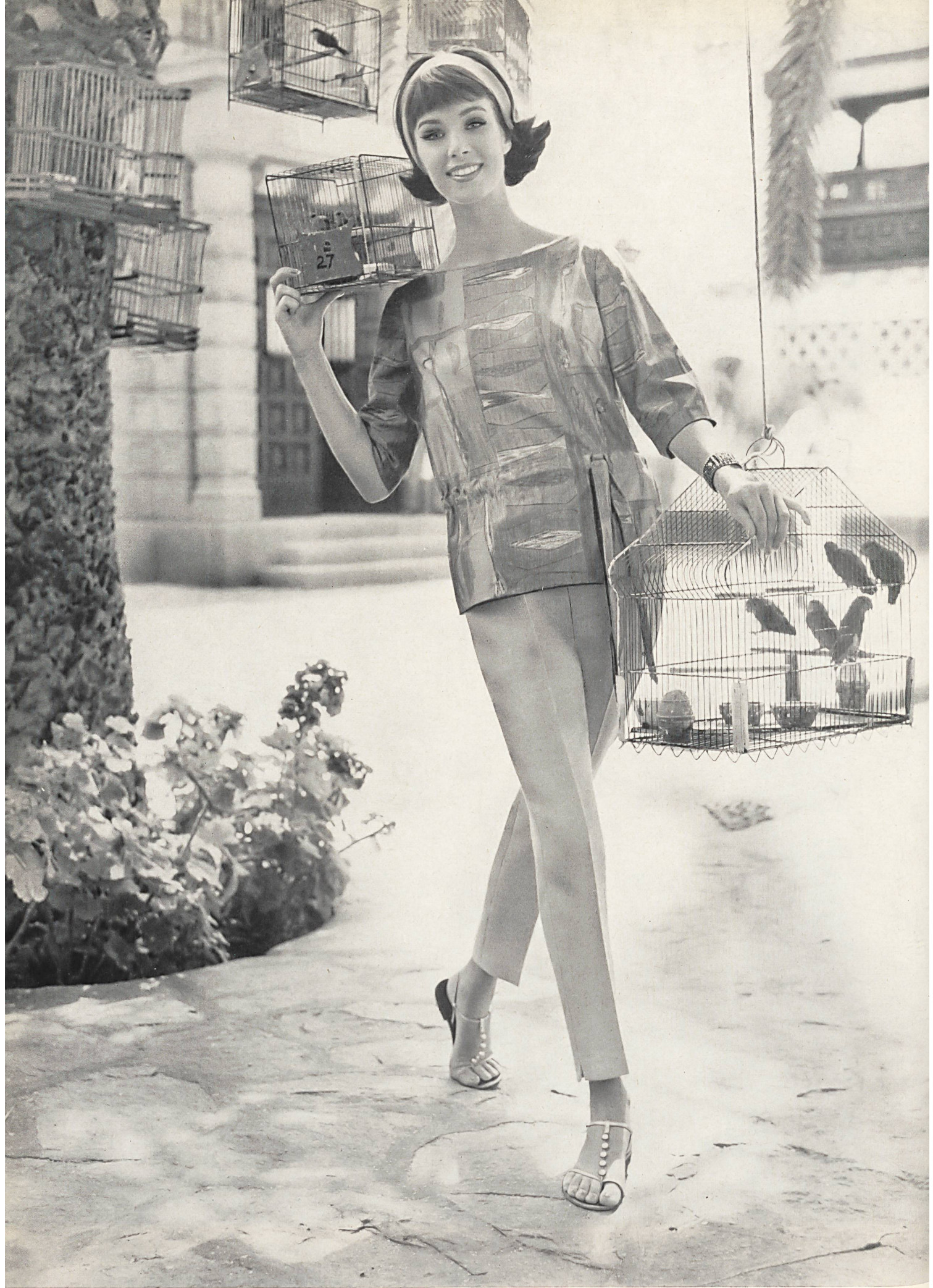
« abc », A. BLUM & CO., ZURICH Ensemble de plage: blouse en satin de coton imprimé, pantalon uni genre lin • Beachset: printed cotton satin blouse and plain linen type slacks • Strandensemble: Bluse aus bedrucktem Baumwoll-Satin, uni Hose in Leinencharakter • Photo Schmutz