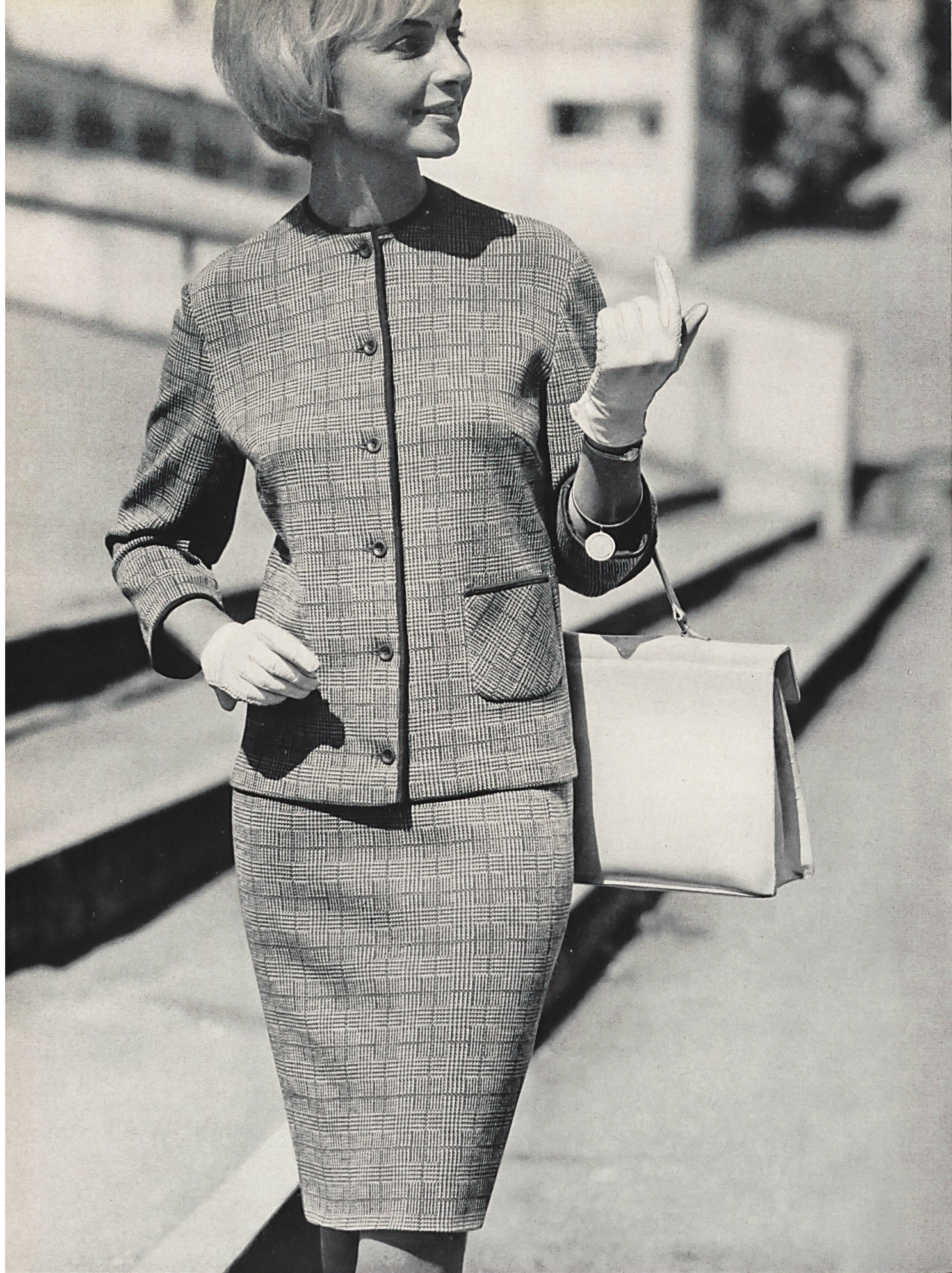
« SAWACO », W. ACHTNICH & CO. S. A., WINTERTHOUR Nouveautés en tricot • Knitwear novelties • Gestricke Neuheiten