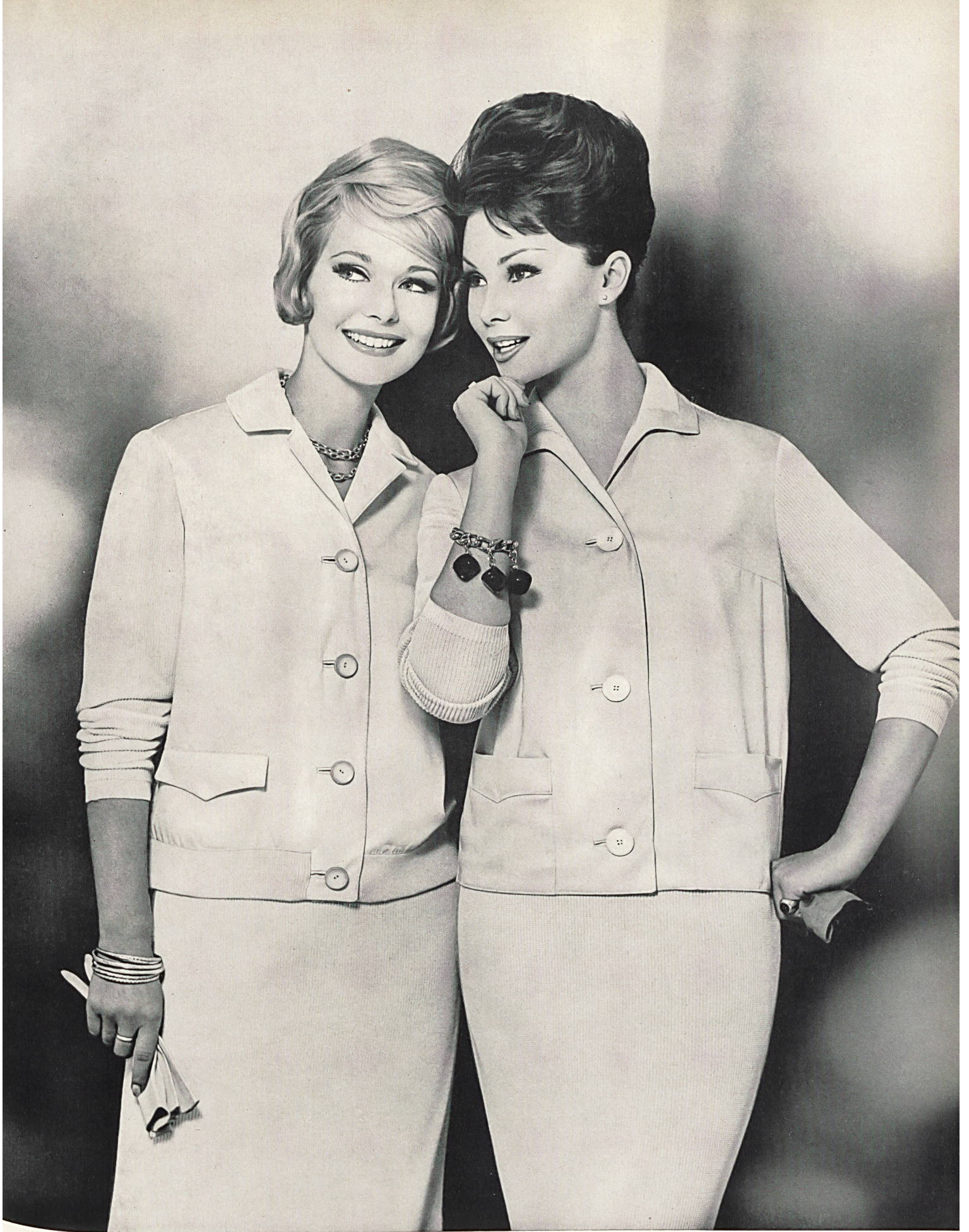
«CAMP», HUMBERT ENTRESS S. A., AADORF

Deux deux-pièces estivaux en tricot de coton et gabardine • Two summery two-piece outfits in knitted cotton and gabardine • Zwei sommerliche Deux-pièces aus Baumwoll-Trikot mit Gabardine