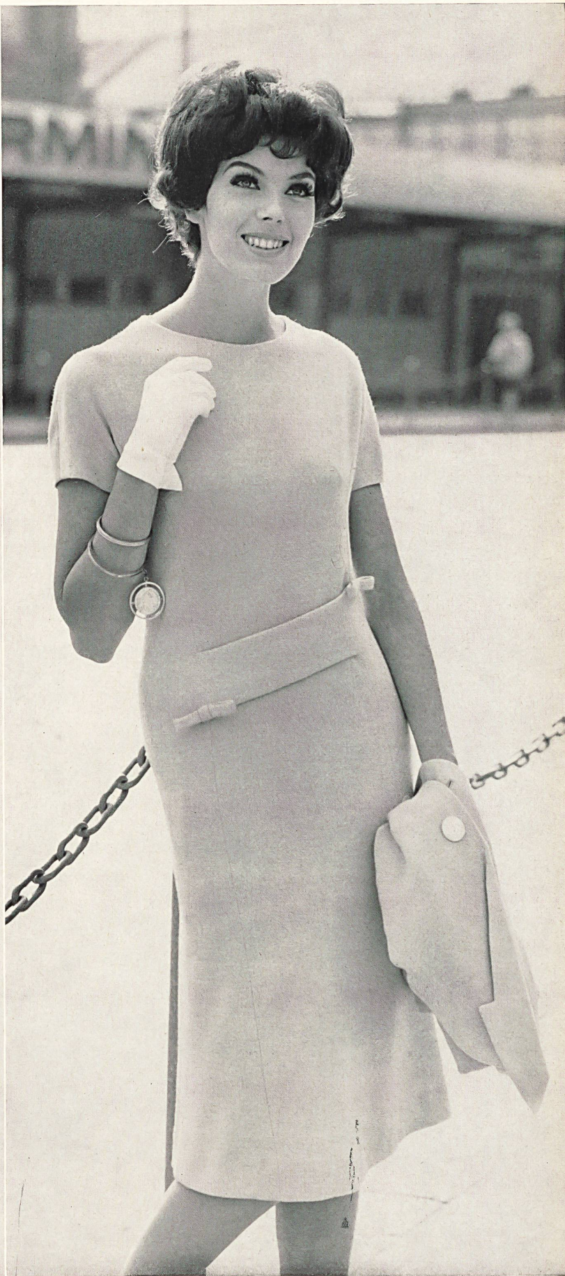
« HISCO », HIS & CO. S. A., MURGENTHAL

Robe à deux garnitures de tricot jacquard sous crevés piqués; jaquette à porter ouverte de même tricot jacquard • Dress with two knitted jacquard trimmings under stitched slashes; coat of the same jacquard knitted material to be worn open • Kleid mit beidseitig eingesteppter Garnitur aus feinem Jacquard-Dessin. Offene Jacke im selben Muster