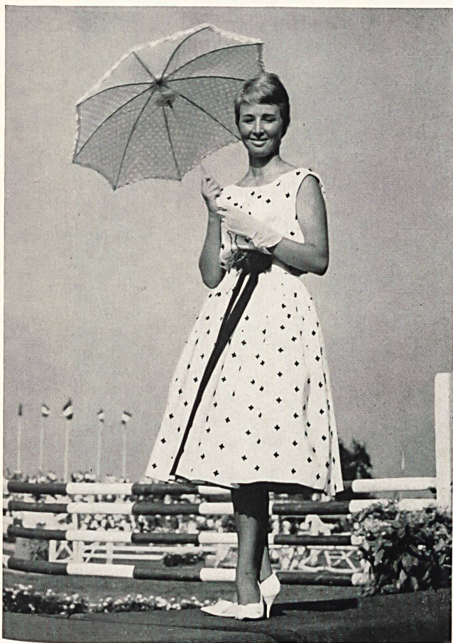
MACOLA S. A., ZURICH Cotton dress with embroidered appliqué motif

Opposite we show some of the photographs taken on this occasion.