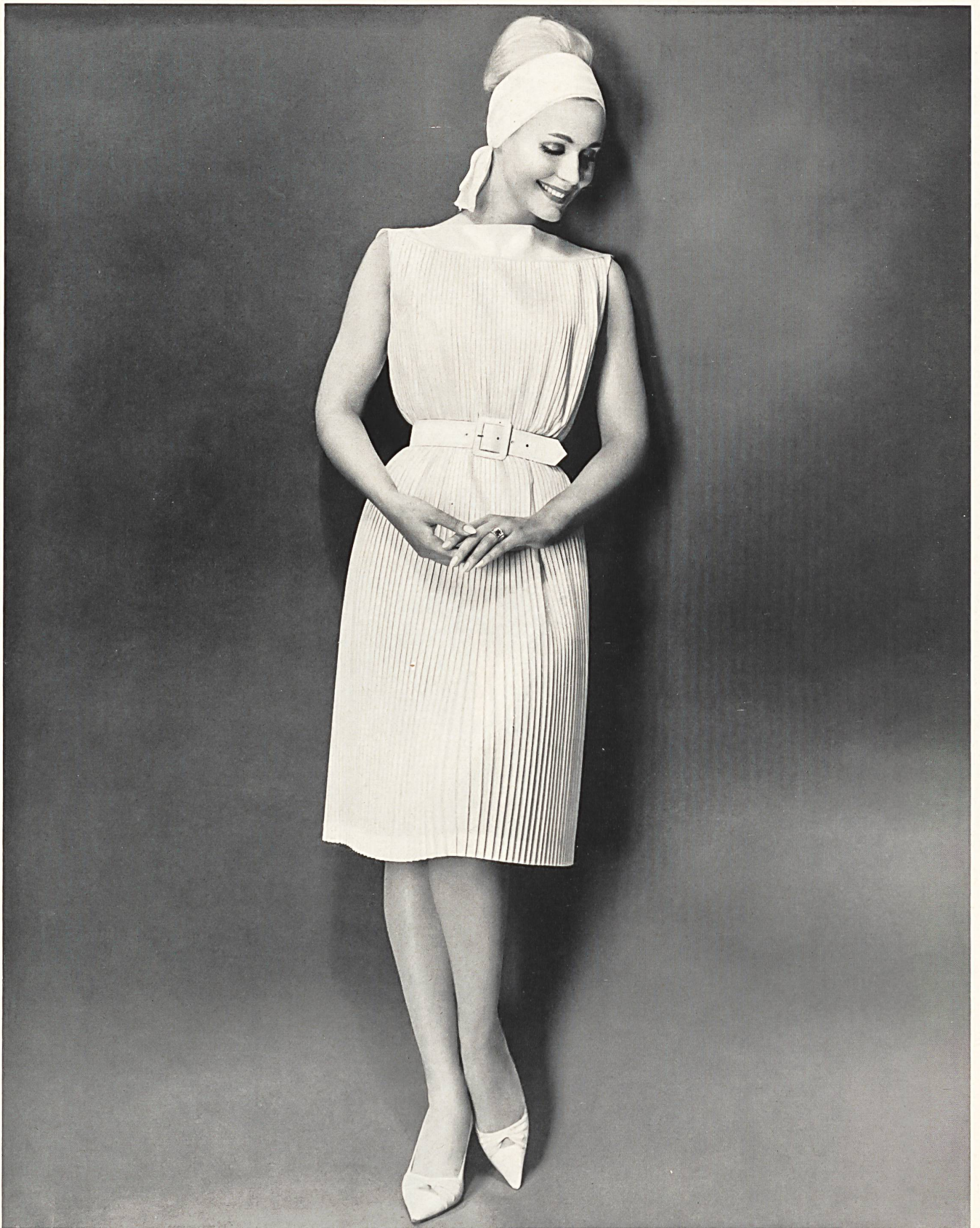
Elegantes Plissé-Kleid aus « Stoffels » Terylene

Nous présentons notre collection à l'Hôtel Central, à Zurich Tél. (051) 32 68 20