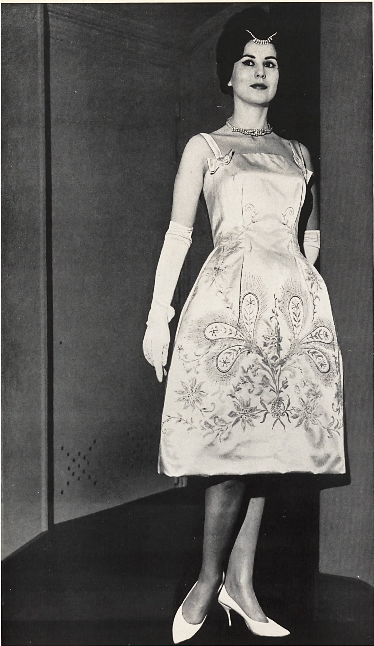
BOB BUGNAND Soie Rhodia, brodée de perles et main, de Rudolf Brauchbar & Cie S. A. Zurich Distribué par Montex, Paris