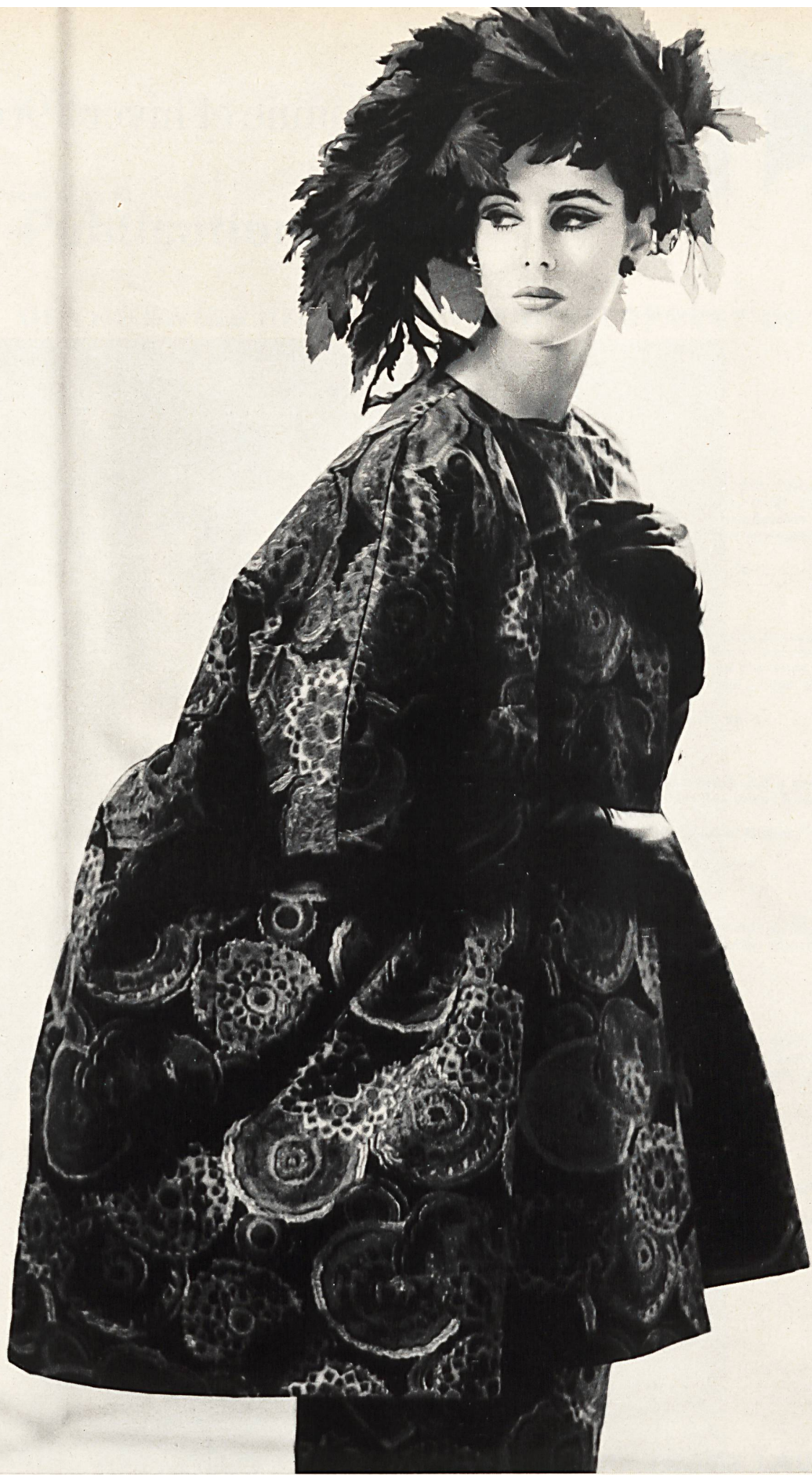
HUBERT DE GIVENCHY