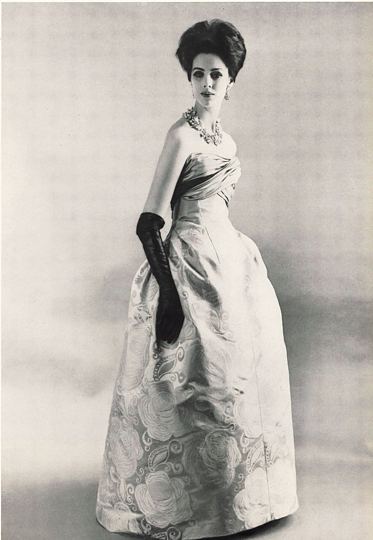
PIERRE BALMAIN Grande robe du soir en soie brochée «Damara» de L. Abraham & Cie, Soieries S.A., Zurich

MODELES EXCLUSIFS — REPRODUCTION INTERDITE