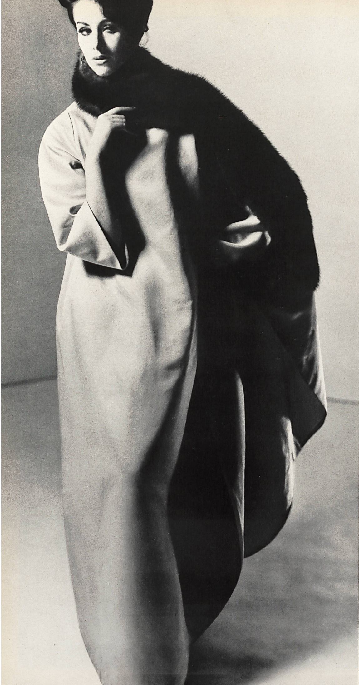
NINA RICCI Ensemble du soir en gabardine de soie de L. Abraham & Cie, Soieries S.A., Zurich