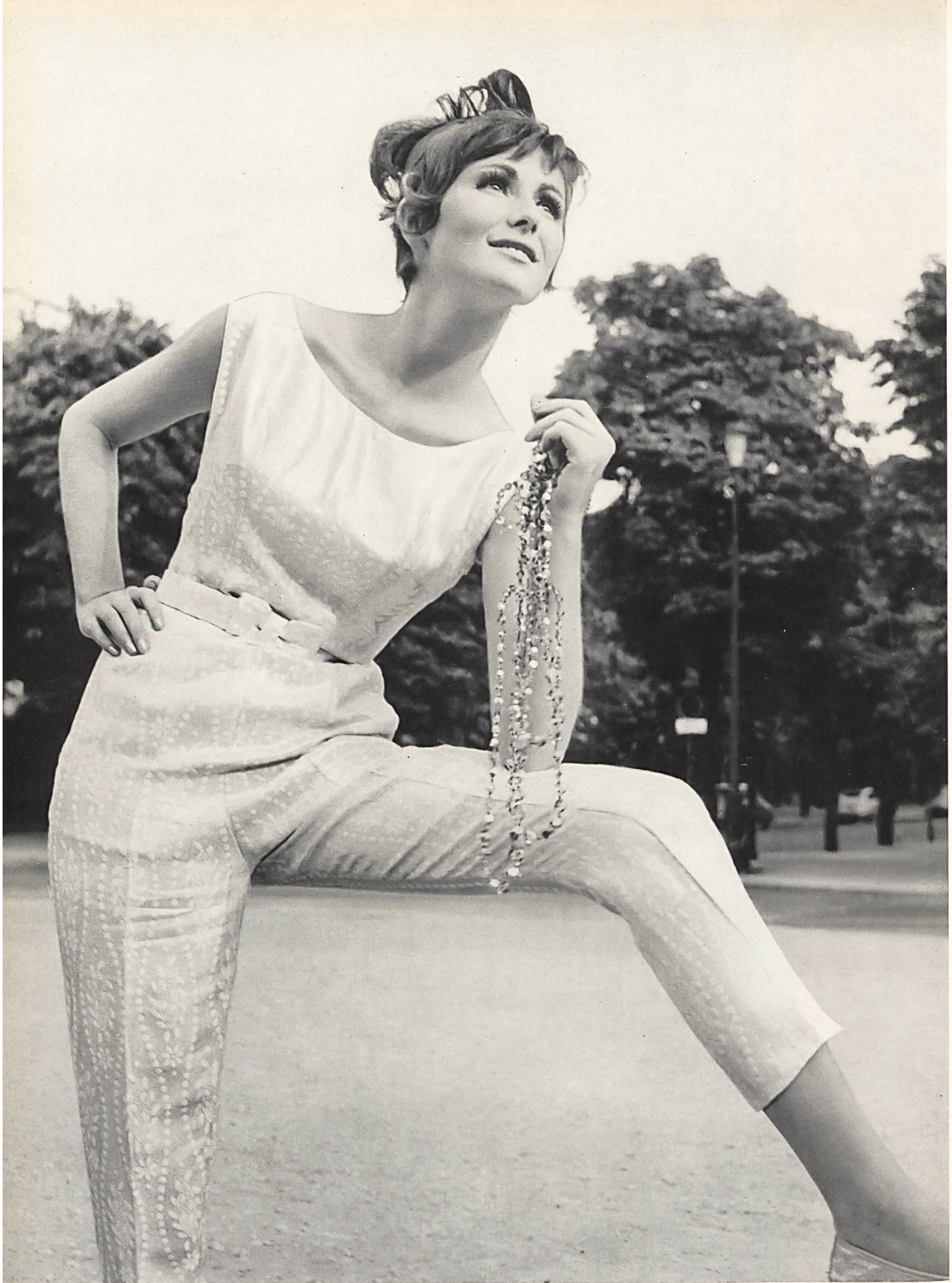
BERNARD SAGARDOY Façonné lamé, soie/métal, des Soieries Stehli S.A., Zurich Photo Joseph Grove.