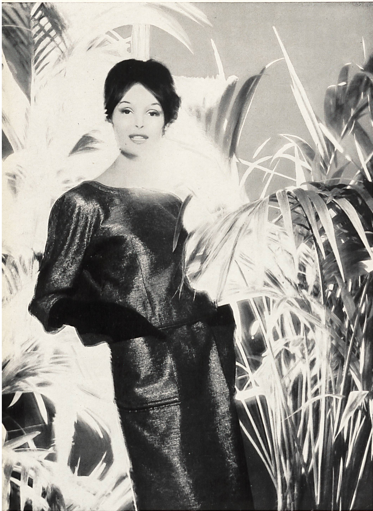
MAGGY ROUFF «Lanalux», laine/métal, de Robt. Schwarzenbach & Co., Thalwil