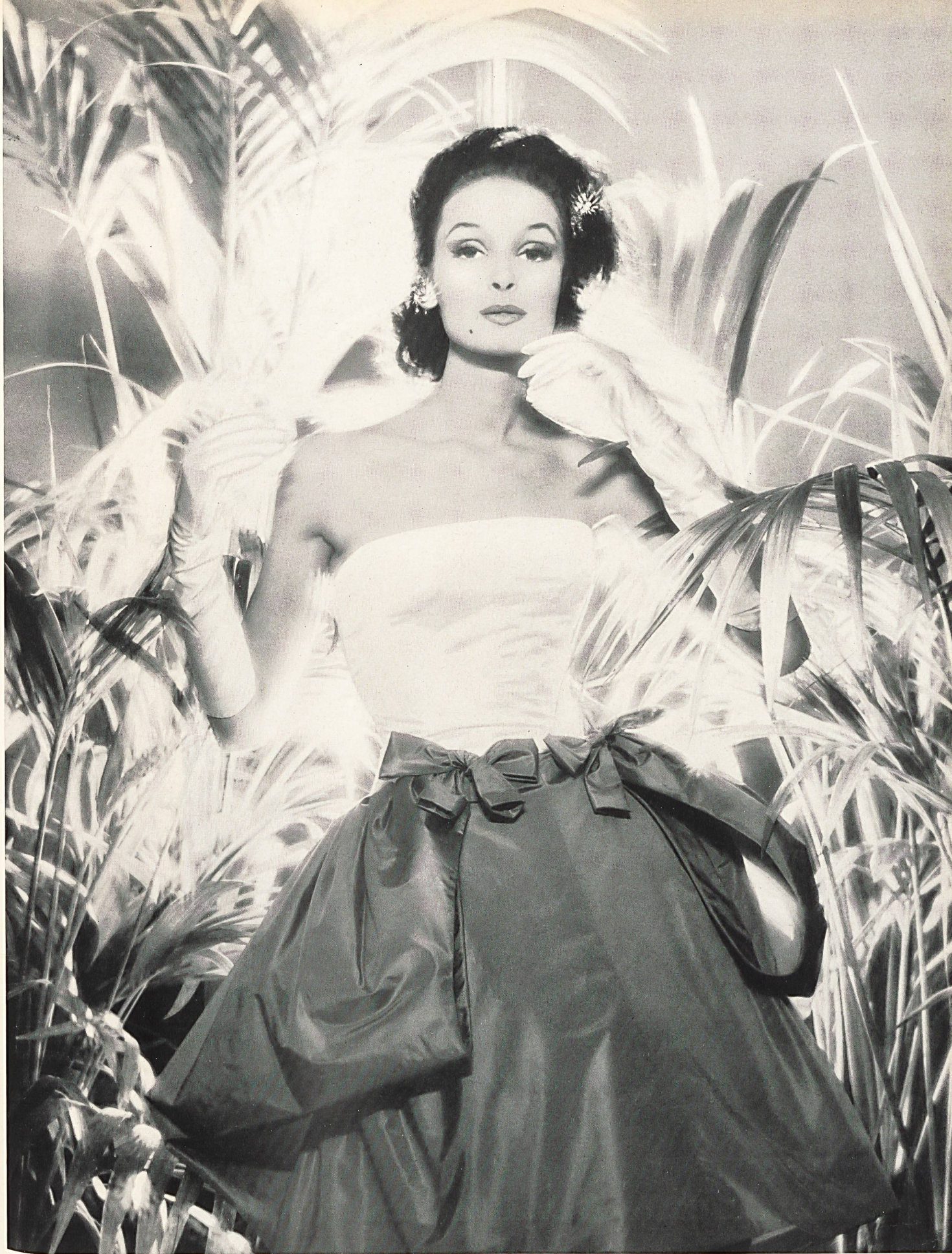
JACQUES ESTEREL Taffetas chiffon blanc et or de Robt. Schwarzenbach & Co., Thalwil