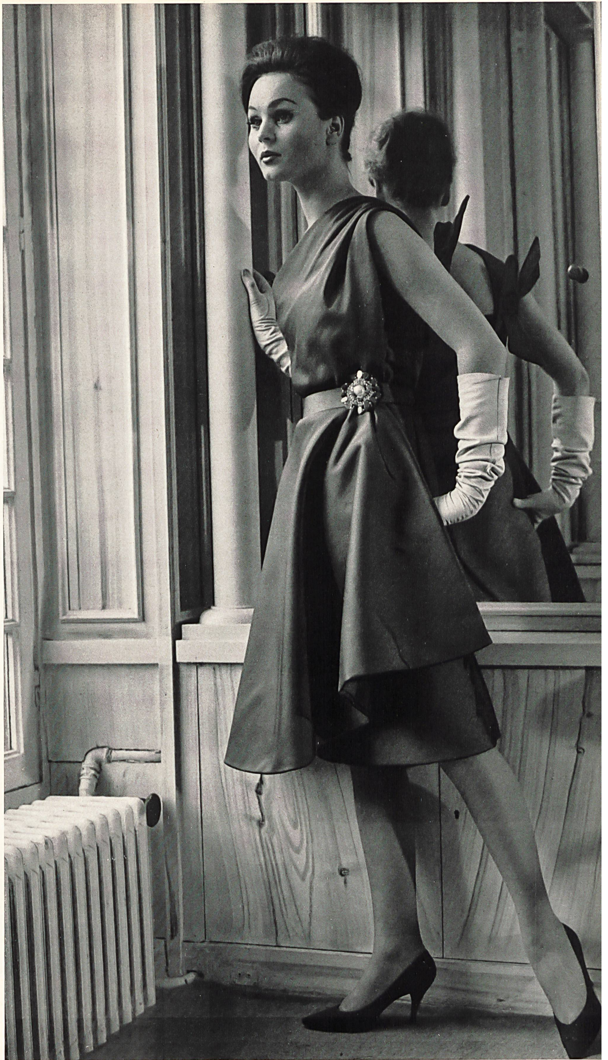
NINA RICCI Satin duchesse double face «Bermuda» de la S.A. Stünzi Fils, Horgen