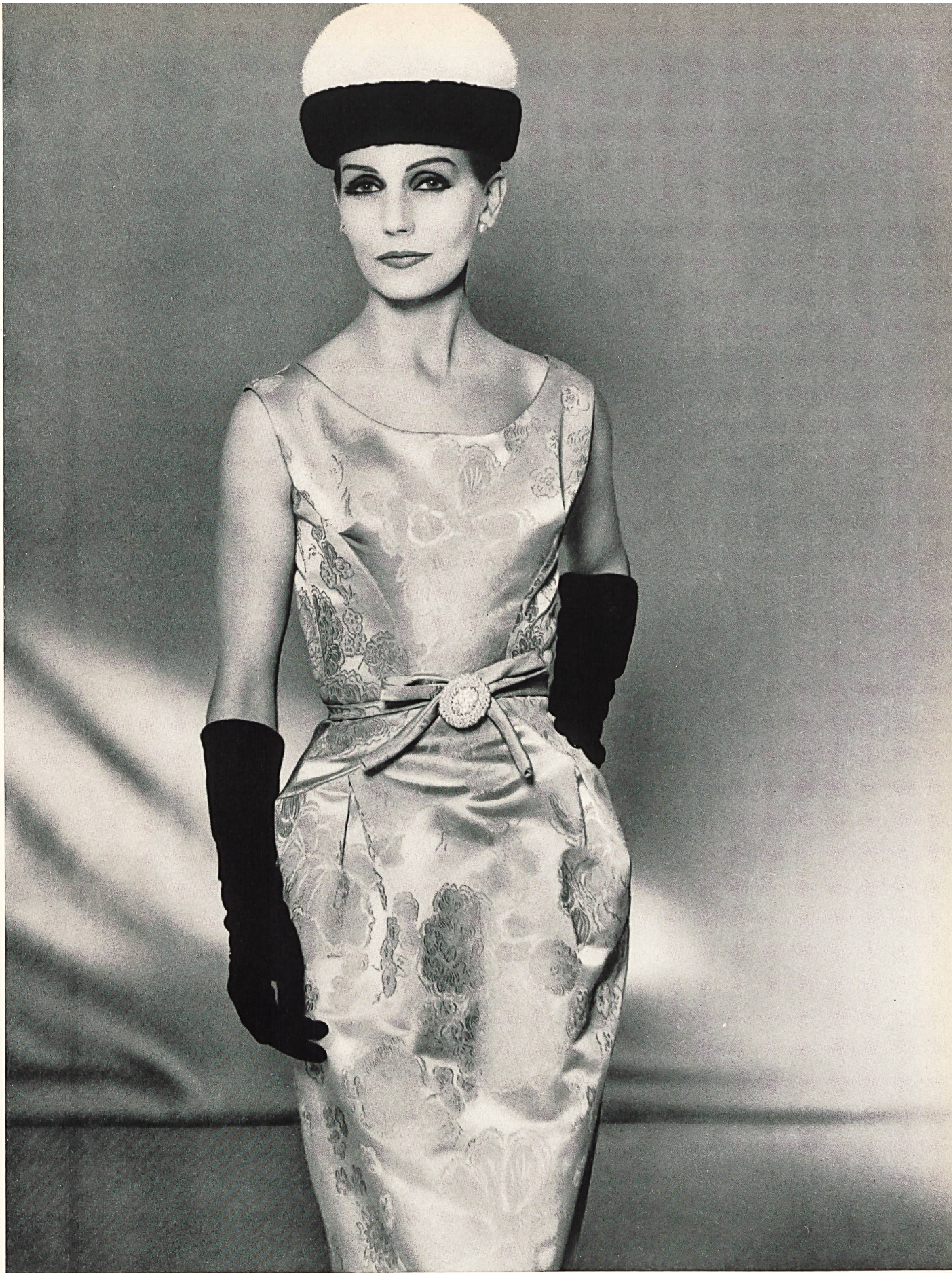
HUBERT DE GIVENCHY