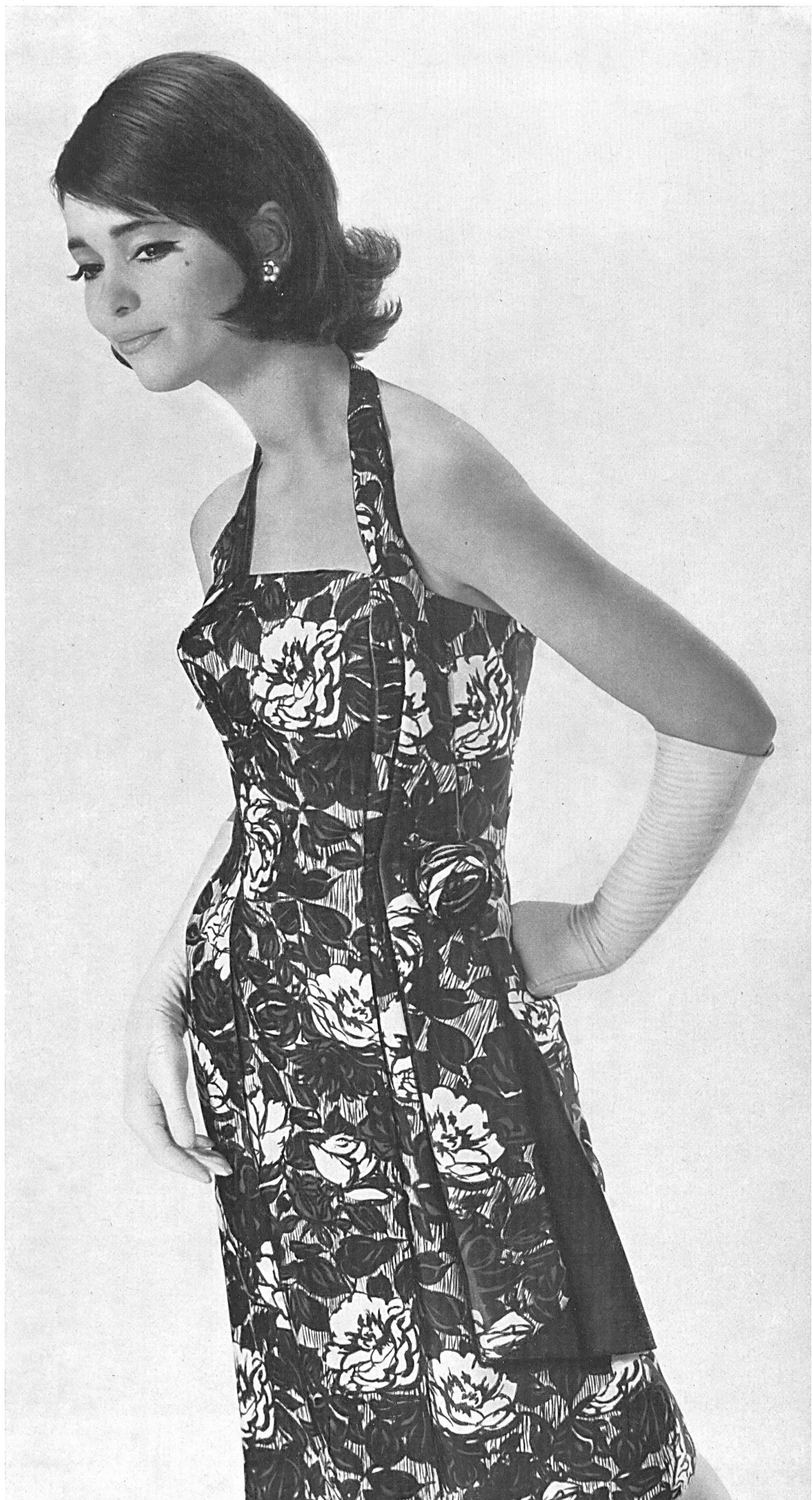
EUGEN BRAUNSCHWEIG A.G., ZURICH Robe de cocktail noire et blanche en pure soie imprimée Black and white printed pure silk cocktail dress Vestido de coctél en seda pura estampada blanca y negra Schwarz-weiss reinsidenes Cocktailkleid