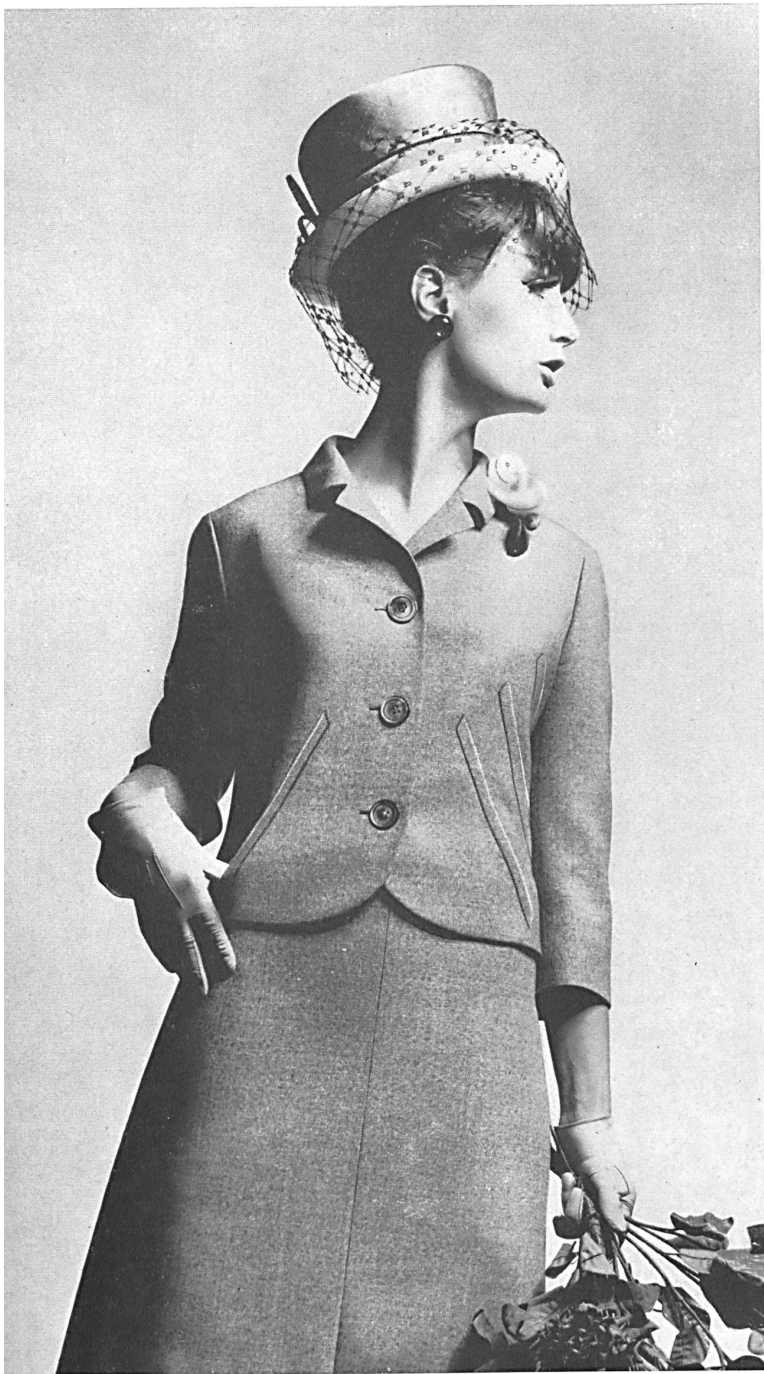
GLENN BOUTIQUE, HASLER & CO., ZÜRICH Tailleur nervuré en lainage gris Grey woollen ribbed suit Traje sastre de lana gris con pespunteados decorativos Graues Kostüm aus Wollstoff mit Biesen