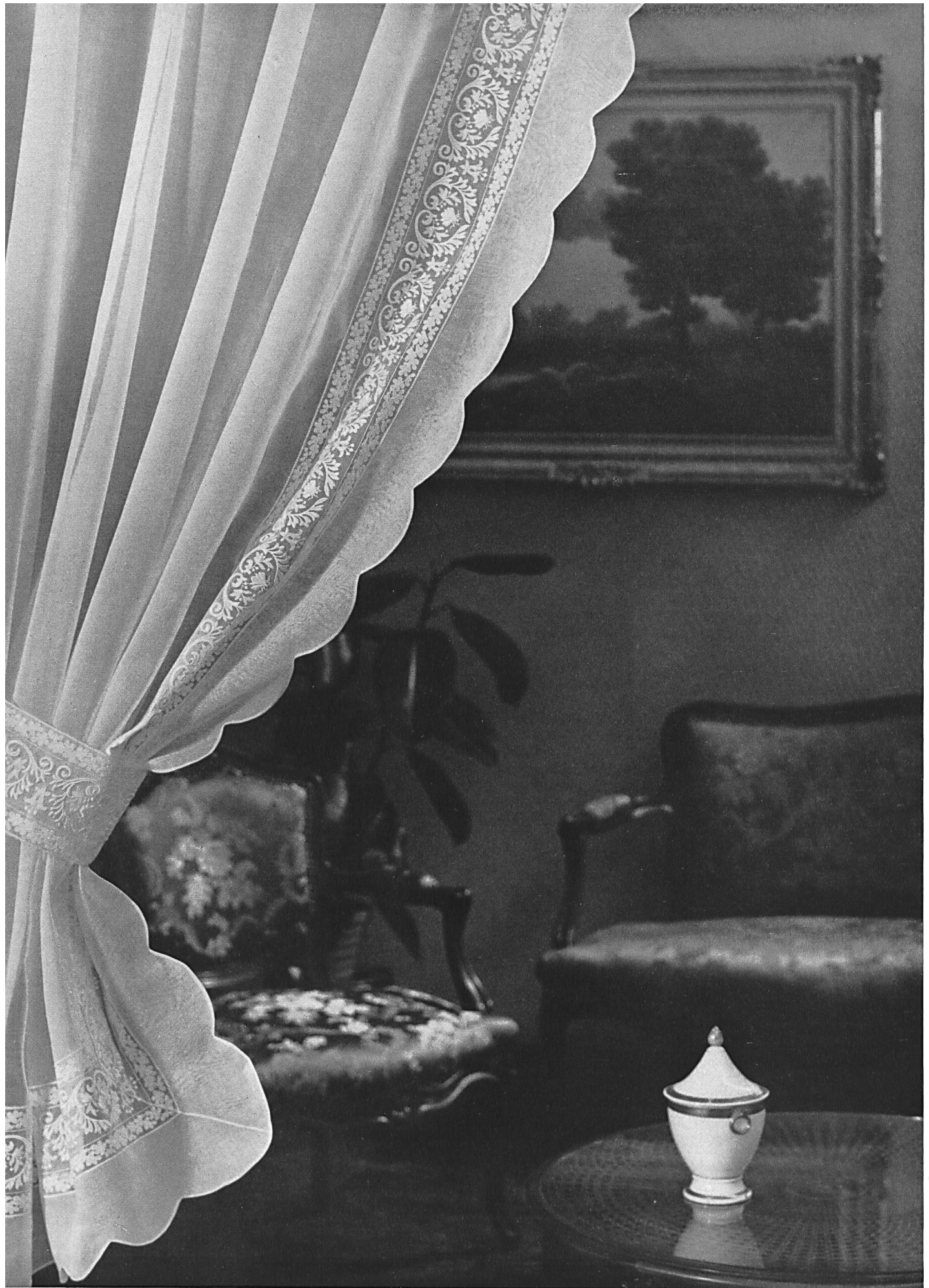
FORSTER WILLI & CO., SAINT-GALL Rideau d'organdi avec galon de broderie incrusté Organdie curtain with embroidered braid insertion Cortina de organdi con galón de bordado incrustado Organdivorhang mit eingesetztem Stickereigalon