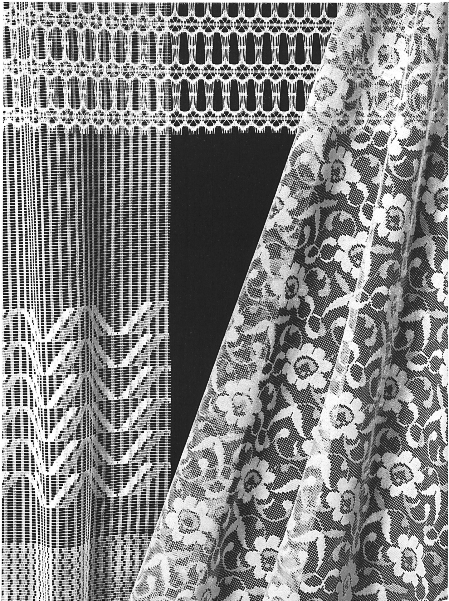
SOCIÉTÉ SUISSE DE L'INDUSTRIE TULLIÈRE S.A., MÜNCHWILEN Rideaux « Muratex » (tricotés) 100 % synthétiques 100 % synthetic « Muratex » tricot curtains Cortinas « Muratex » (de tricot) 100 % sinteticas Vollsynthetische Raschelgardinen Marke « Muratex »