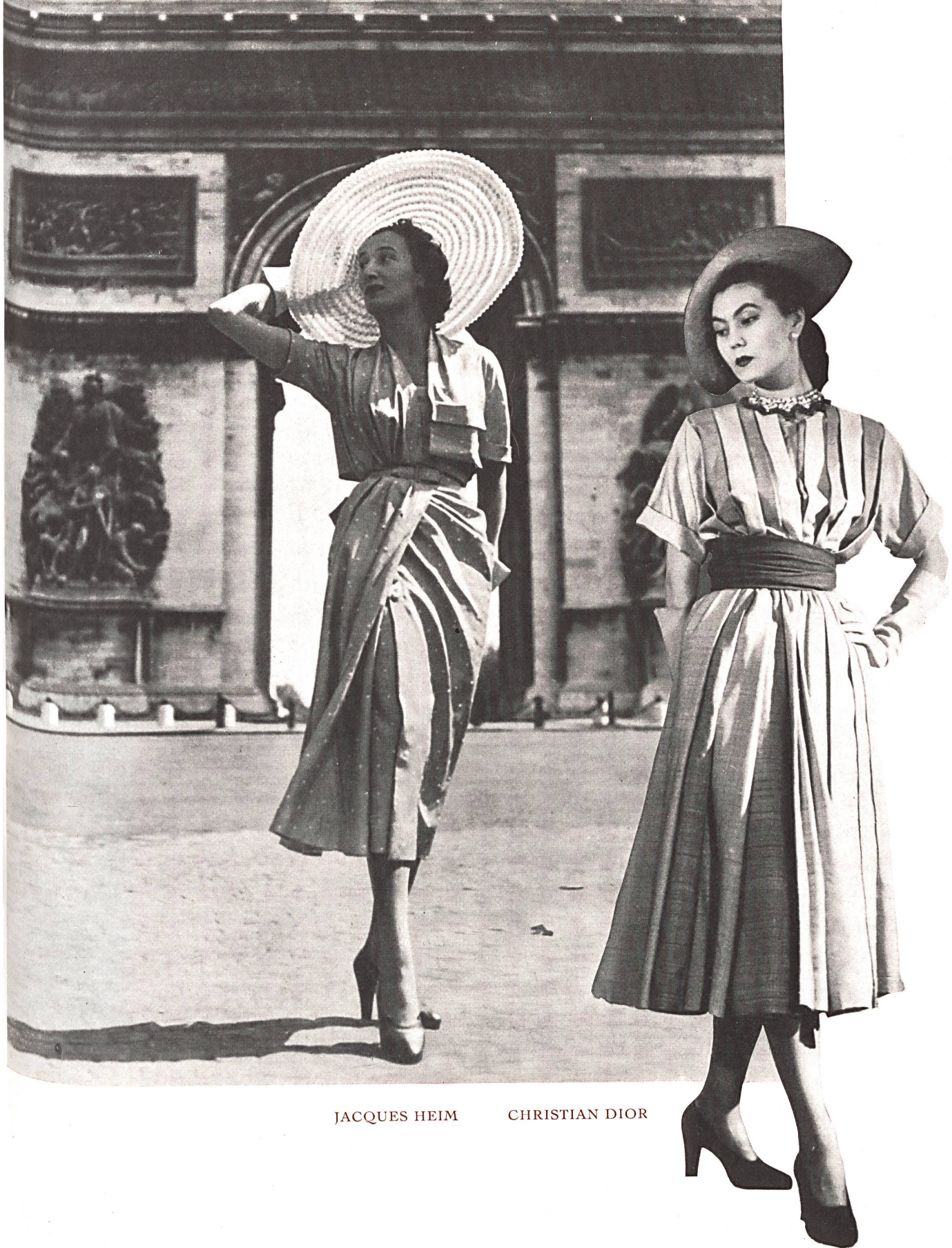
JACQUES HEIM CHRISTIAN DIOR