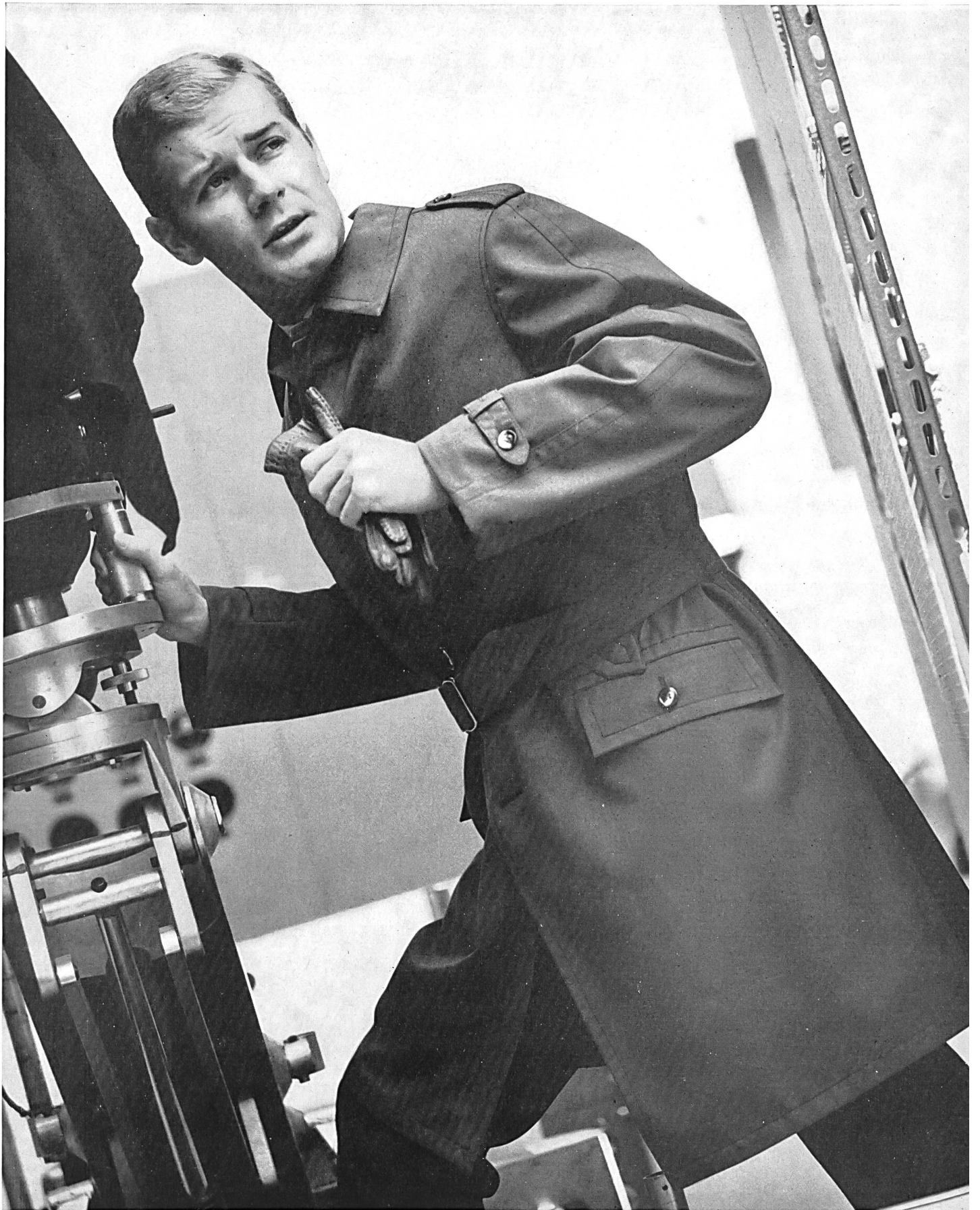
HAUSAMMANN TEXTILES S.A., WINTERTHUR « Osa-Atmic » tissu Diolène et coton — Diolen and cotton fabric — Tejido de Diolene y algodón — Diolen/Baumwoll-Gewebe Modèle « PKZ », Burger Kehl & Cie S.A., Zurich