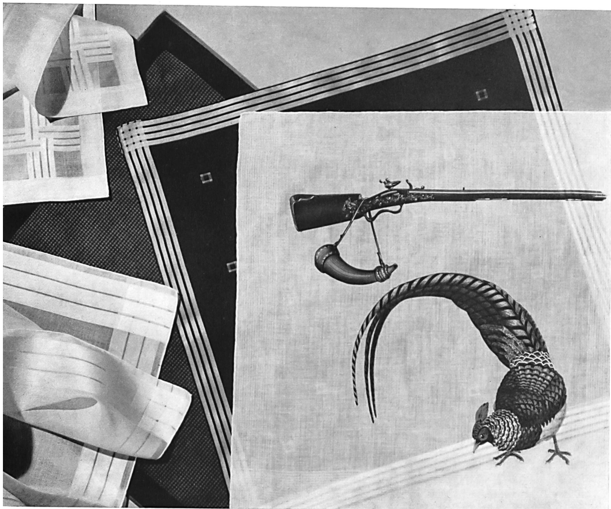
« FISBA », CHRISTIAN FISCHBACHER CO, SAINT-GALL Mouchoirs pour messieurs, en tissage fantaisie, à fils coupés, imprimés Men's handkerchiefs: fancy woven, with clip cord effects, printed Pañuelos para caballero: tejidos fantasía, con efectos de vainica, estampados Herrentücher: phantasiengewoben, gescherlet, bedruckt