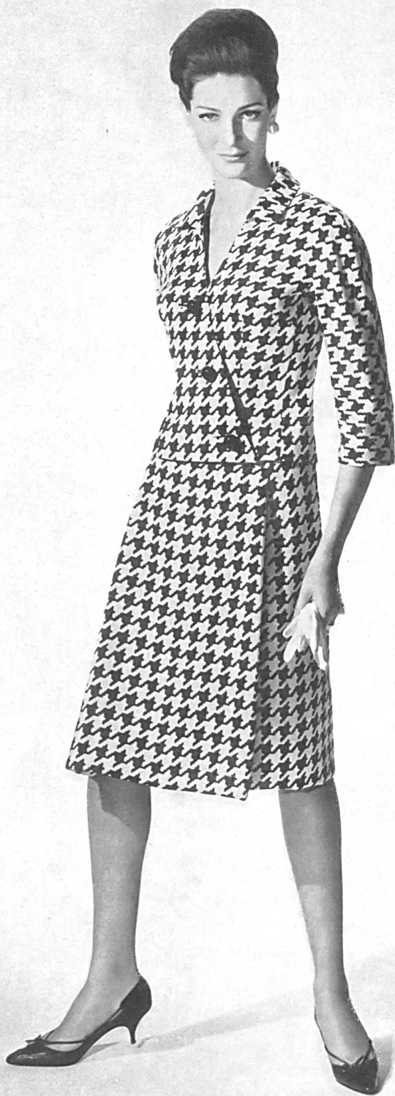
METTLER & CIE S.A., SAINT-GALL Tissu fibranne imitation lin imprimé Printed linen imitation staple fibre fabric Modèle Helga, Los Angeles

cuts, graceful movements, chin muff collars with a great deal of fur and his management of elegant Forster-Willi chenille lace in a «beatnik» manner.