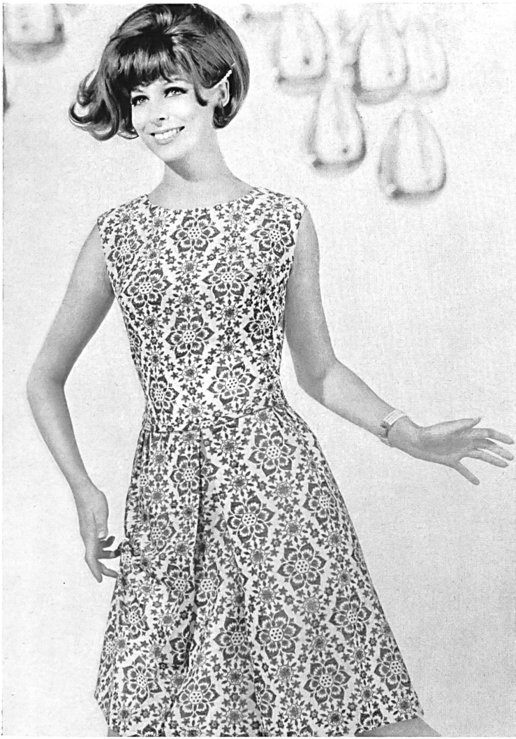
SOCIÉTÉ DE LA VISCOSE SUISSE, EMMENBRÜCKE Robe en jersey Pontesa imprimé, avec effets Lurex Printed Pontesa jersey dress with Lurex effects Vestido de jersey Pontesa estampada con efectos Lurex Pontesa-Jersey-Kleid mit Lurex-Effekt Modèle: « Blu*Nor » Lucien Nordmann, Berne