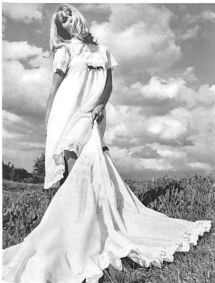
JOSEPH BANCROFT & SONS CO. AG. ZURICH Ensemble de terrasse en Ban-Lon jersey-mousseline Modèle: Acmé, Paris