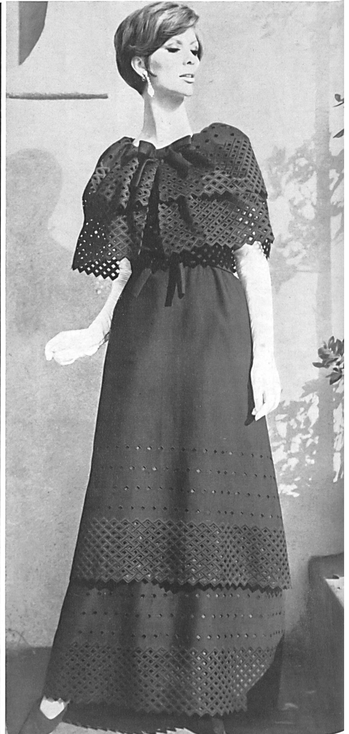
FORSTER WILLI & CO., SAINT-GALL Bordure brodée dans le nouveau style géométrique Embroidered edgings in the new geomet- rical style Modèle Michael Novarese, Los Angeles