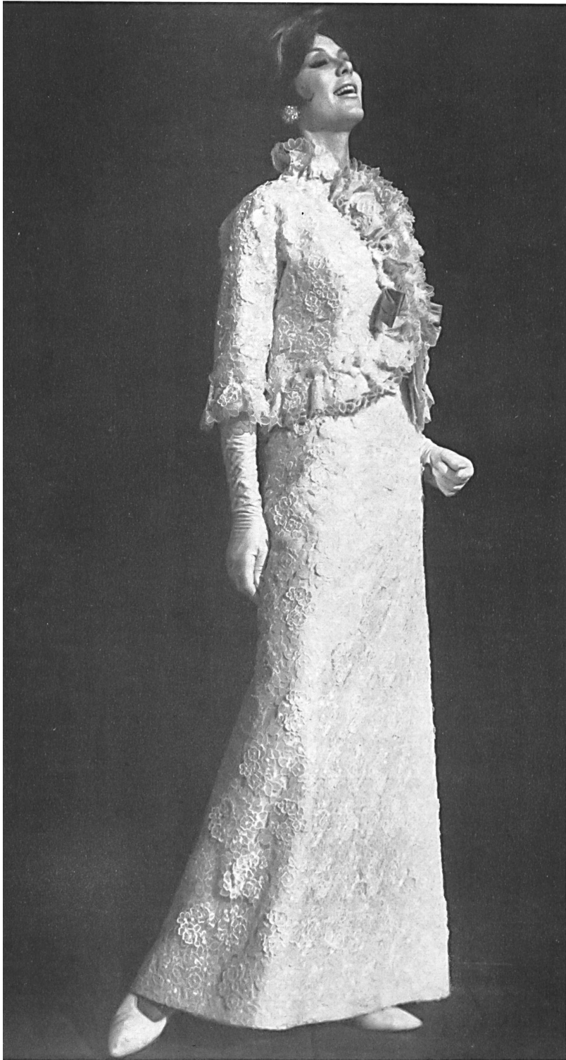
FORSTER WILLI & CO. SAINT-GALL Broderie avec applications sur organza de soie blanc Embroidered white silk organza with appliqué-work Modèle Michael Novarese, Los Angeles