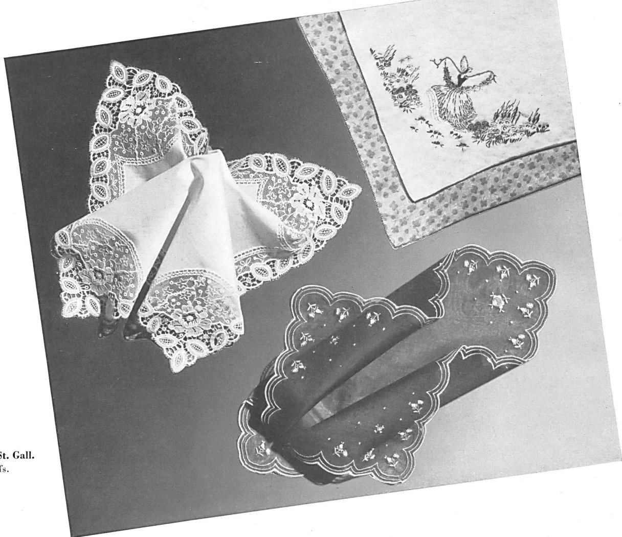
Sailer & Schoensleben, St. Gall. Embroidered handkerchiefs. Pañuelos bordados.