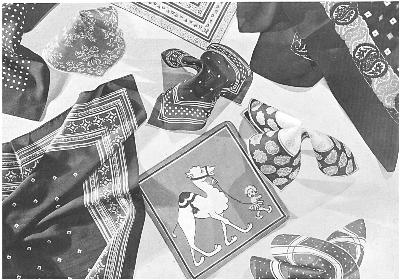
J. Kreier- Bænziger's Erben. St. Gall.

Fichus, printed handkerchiefs, children's hand- kerchiefs in cot- ton lawn and staple fibre. estampados y de algodón y fibrana para niños.