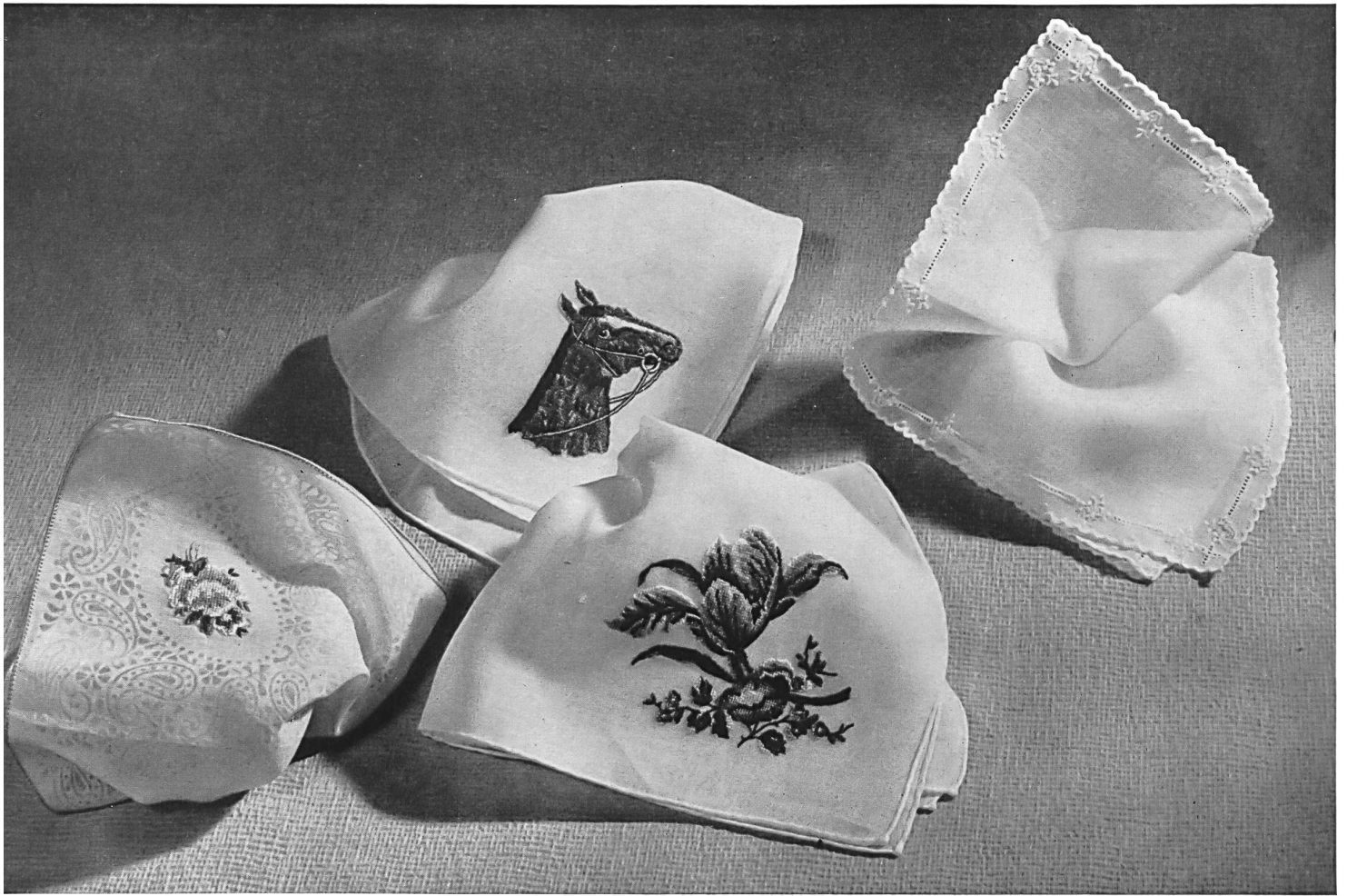
Ed. Sturzenegger Ltd., St. Gall. Machine-embroidered handkerchiefs of different types. Pañuelos de diferentes ejecuciones, con bordados a máquina.