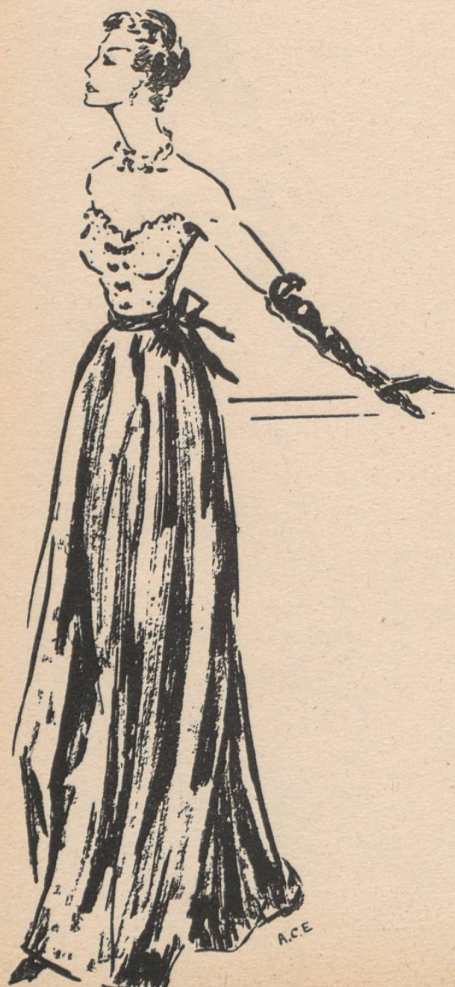
Vestido de noche, con falda negra y corpiño de encaje inglés de fabricación suiza, de Spectator Sports, Londres.